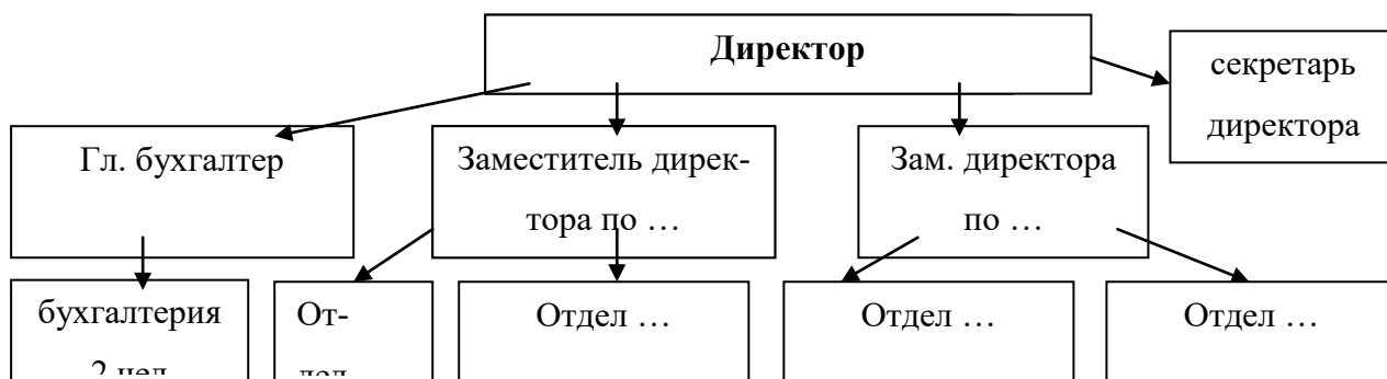
Рис. 1. Пример организационной структуры ... библиотеки (библиотечной системы)