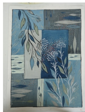
Эскиз для гобелена на тему «Русь»