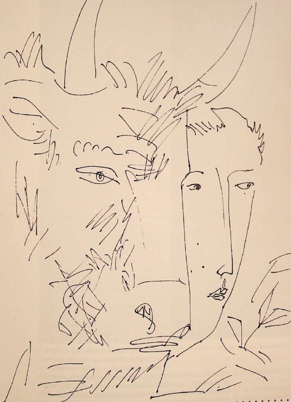
Пасифая и Бык. 1980-е гг. Тушь, перо