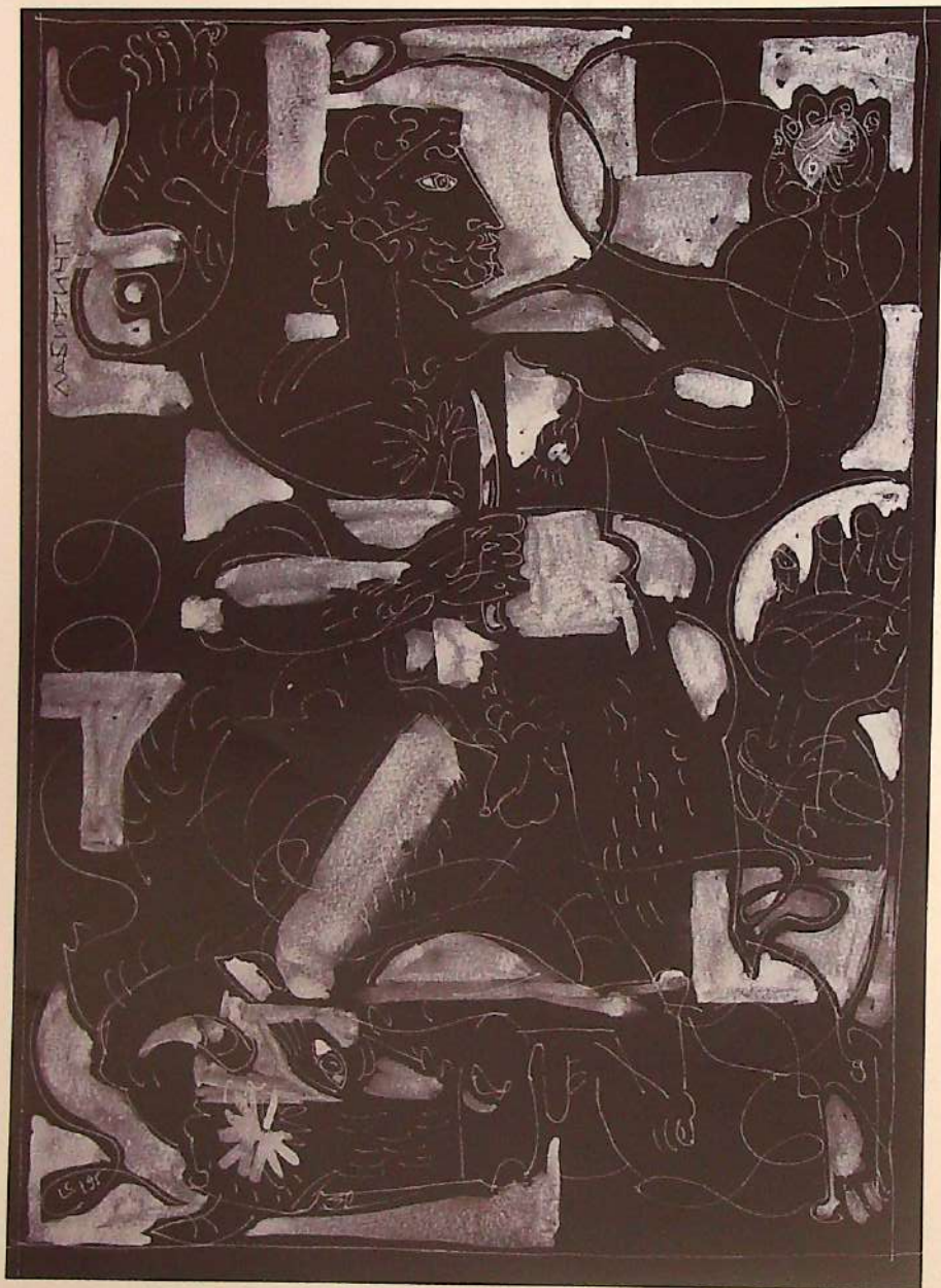
Лабиринт. 1995 г. Бумага тонированная, белая тушь

А любовь эта старая. В начале 70-х, будучи студентом художественного училища, Сергей сподоблен был с ч а с т ь я