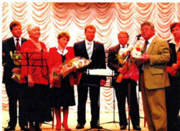
Поздравление с юбилеем от ректора академии профессора В. Я. Рушанина. 2006 г.