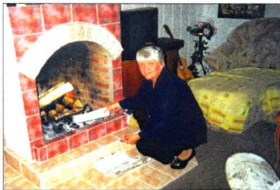
У камина. 2003 г.