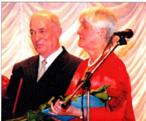
С профессором, лауреатом государственной премии Г. Гуном. Март 2006 г.