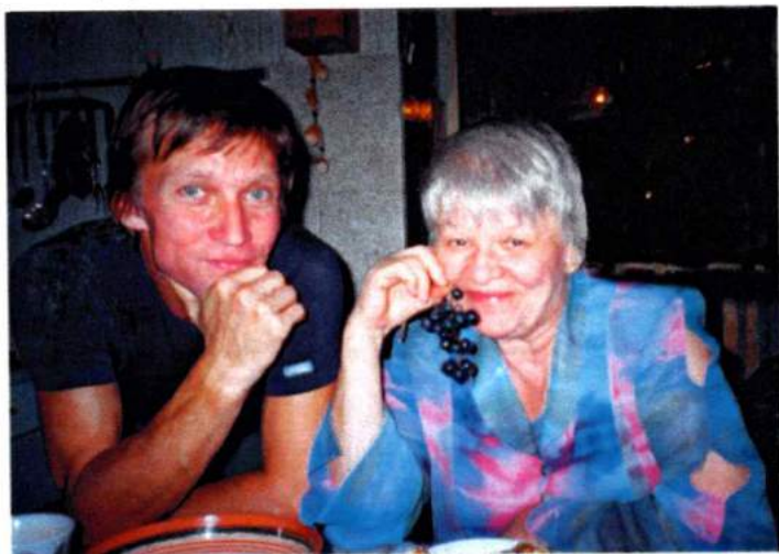
С заслуженным артистом РФ А. Рубцовым. 2004 г.