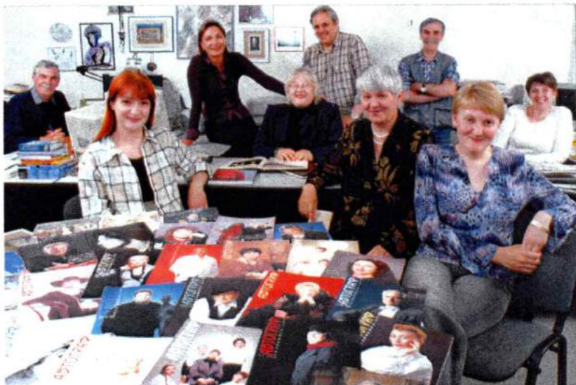
Редакция журнала «Автограф» в полном составе. 2005 г.