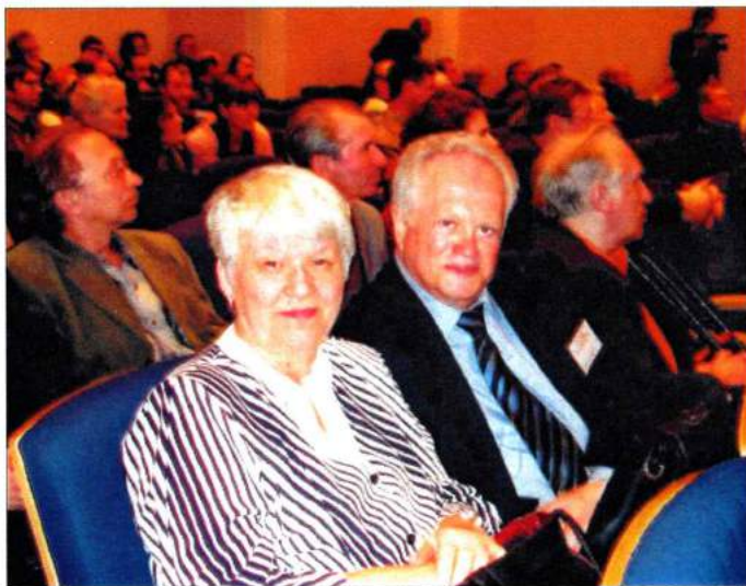
На 9-м съезде Союза композиторов России (с народным артистом России А. Кроллом). 2005 г.