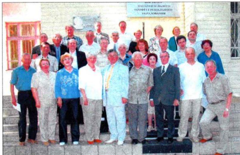
Профессора ЧГАКИ. 2006 г.