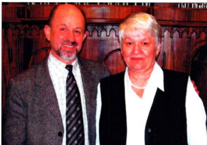
С заслуженным деятелем искусств РФ, профессором, председателем Воронежской организации Союза композиторов России Е. Трембовельским. 2000 г.