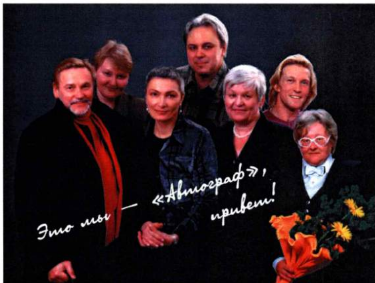
Народный артист СССР В. Васильев (крайний слева) в редакции «Автограф». 2002 г.