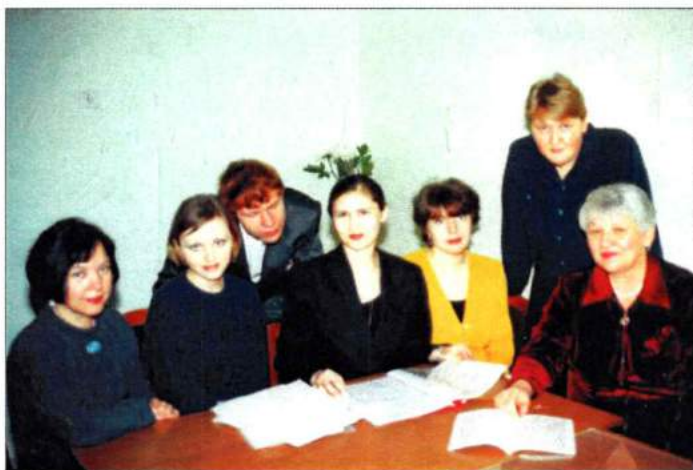
С аспирантами. Конец 1990-х гг.