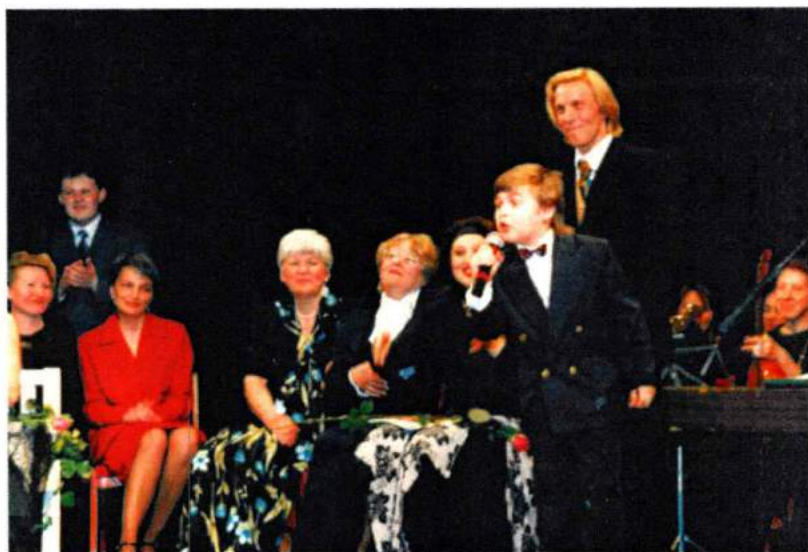
Презентация первого номера журнала «Автограф». 13 мая 1998 г.