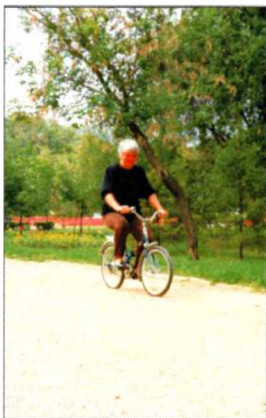
Здоровый образ жизни. 1998 г.