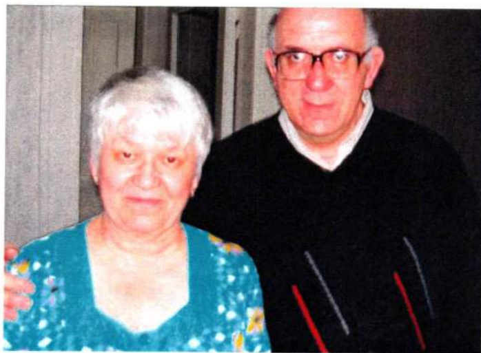
С композитором, народным артистом РФ В. Биберганом (Санкт-Петербург). 2005 г.