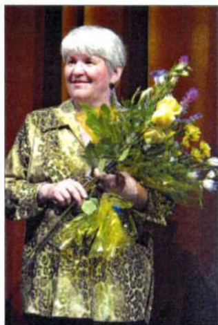
На пятилети «Автограф». 2003 г.