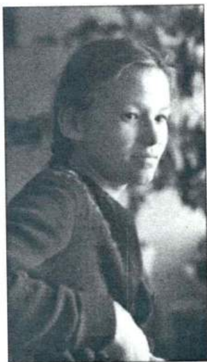
Школьница. Май 1954 г.