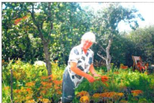
На дачном участке. 2003 г.