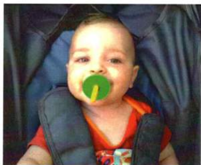
Ариэль (Иерусалим, Израиль)