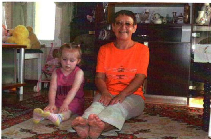
Виктория (Иерусалим, Израиль)