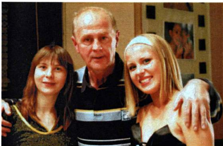
С участницами студенческого кинофестиваля. 2007 г.