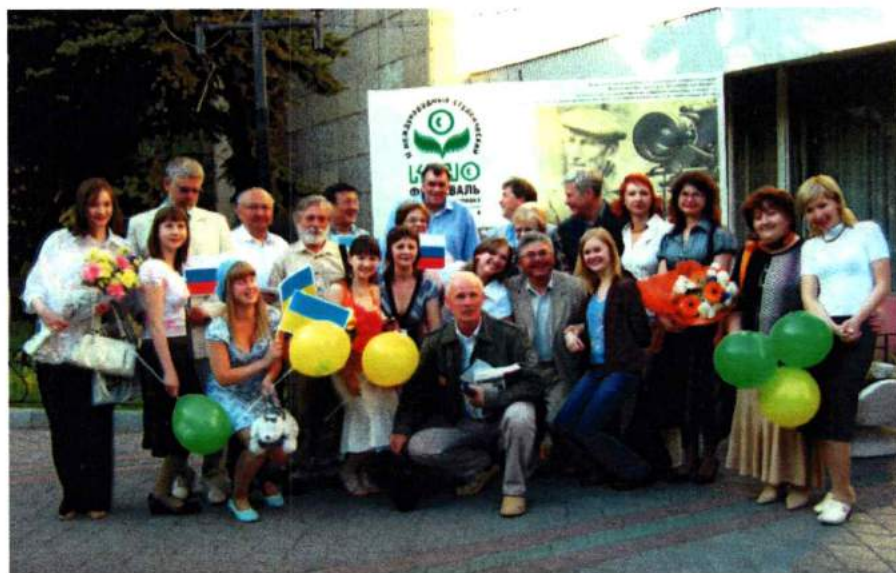
С участниками II международного студенческого кинофестиваля им. С. А. Герасимова. 2005 г.