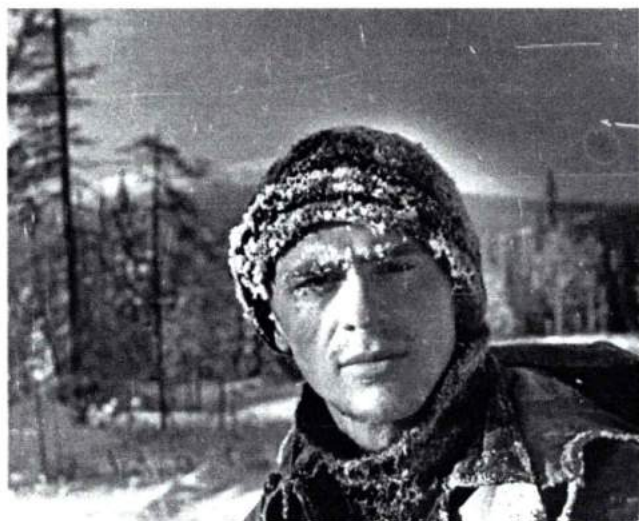
В горах Северного Урала. 1969 г.