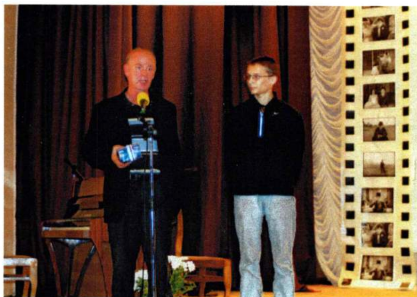
Награждение победителей I внутриакадемического студенческого фестиваля «День студенческого кино». 2007 г.