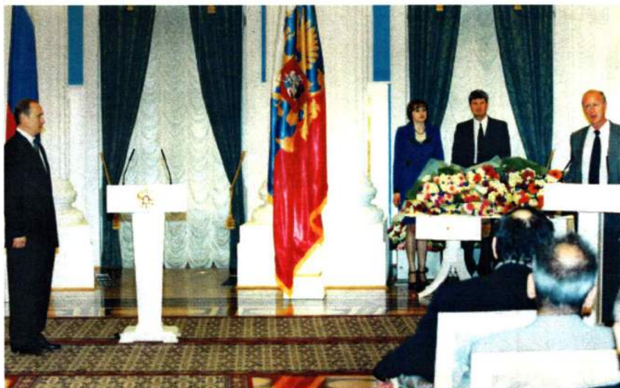
Вручение В. Д. Петрову Государственной премии в области кинематографии. 2001 г.