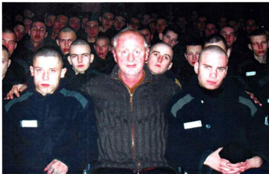
В колонии для несовершеннолетних преступников, п. Атлян. Работа в комиссии по помилованию. 2006 г.