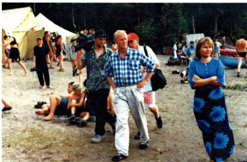
На съемках детского сериала «Приключения Даши». Озеро Тургояк. 1999 г.