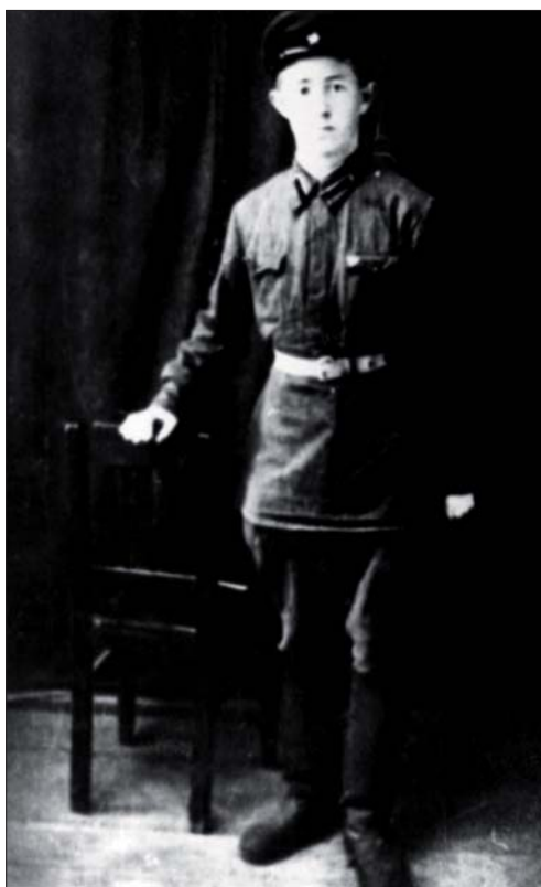
Курсант Лепельского артиллерийско-минометного училища. 1941 г.