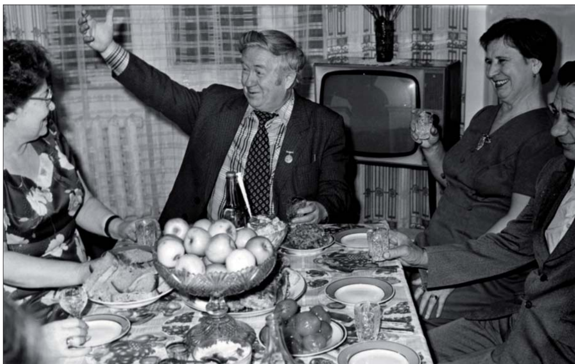
В кругу друзей. 1970-е гг.