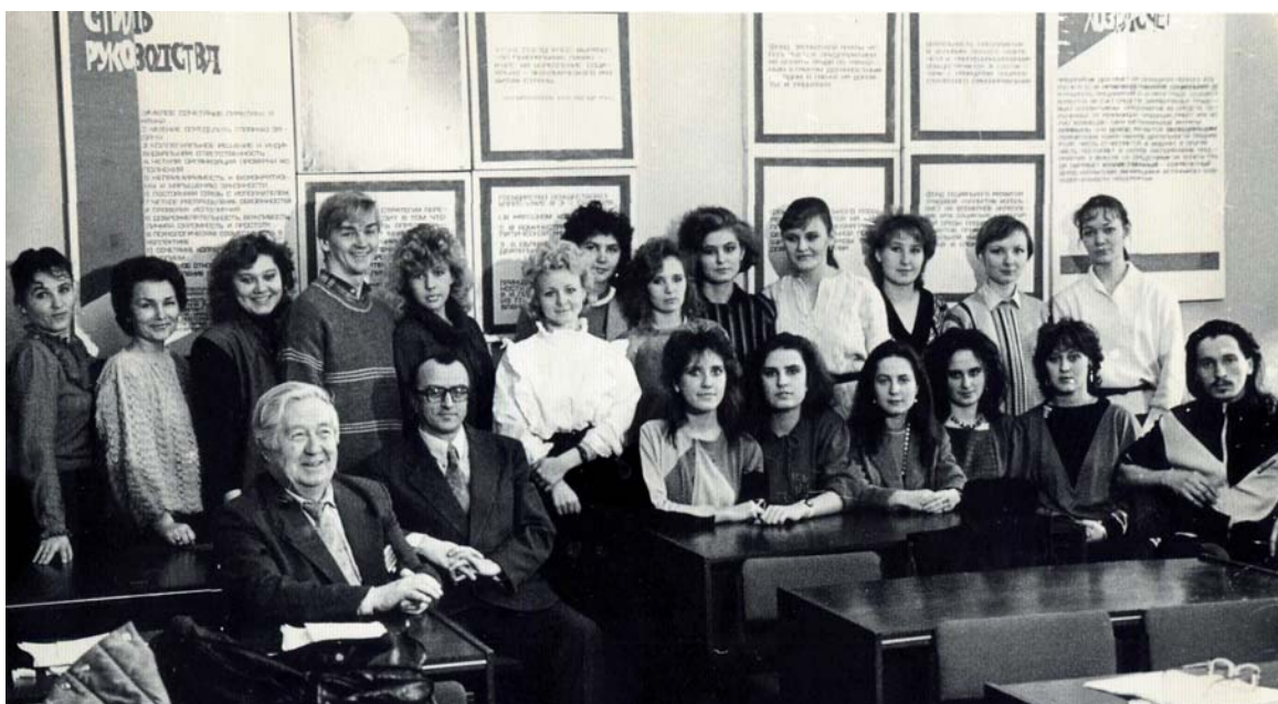
На методических учениях. 1980-е гг.