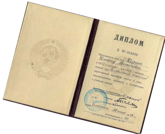
Диплом об окончании партийной школы. 1949 г.