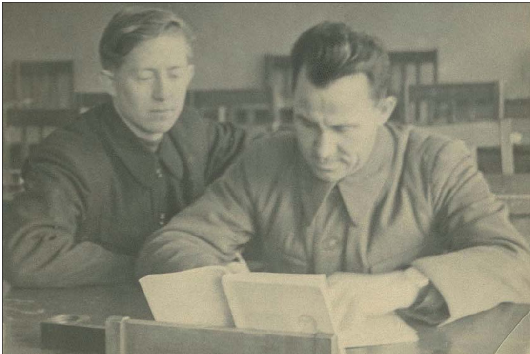
На занятиях в партийной школе. 1950-е гг.