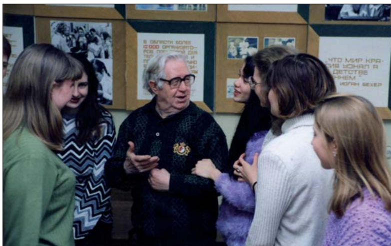
Среди студентов на кафедре СКД 2000 г.