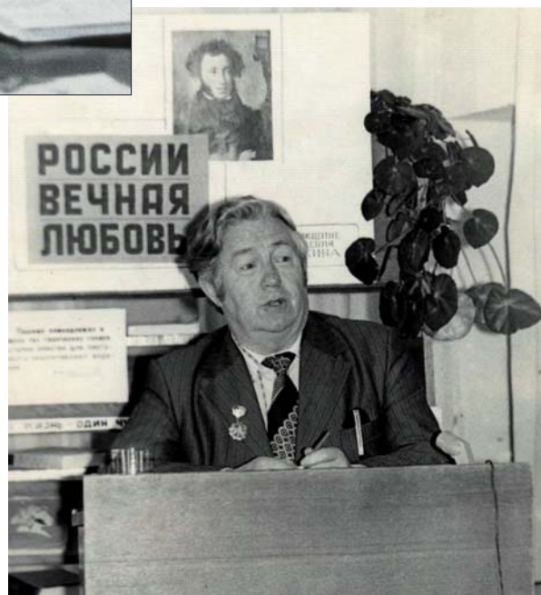
На лекции. 1980-е гг.