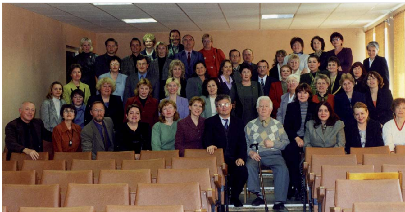
Первый слет выпускников ЧГАКИ. 2003 г.