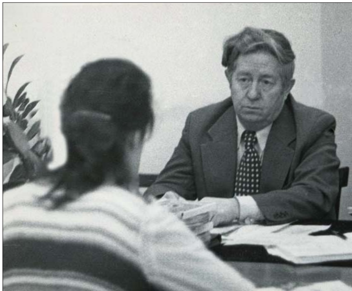
На экзаменах · 1980-е гг.