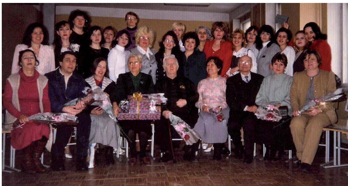
На кафедре социально-культурной деятельности 2002 г.