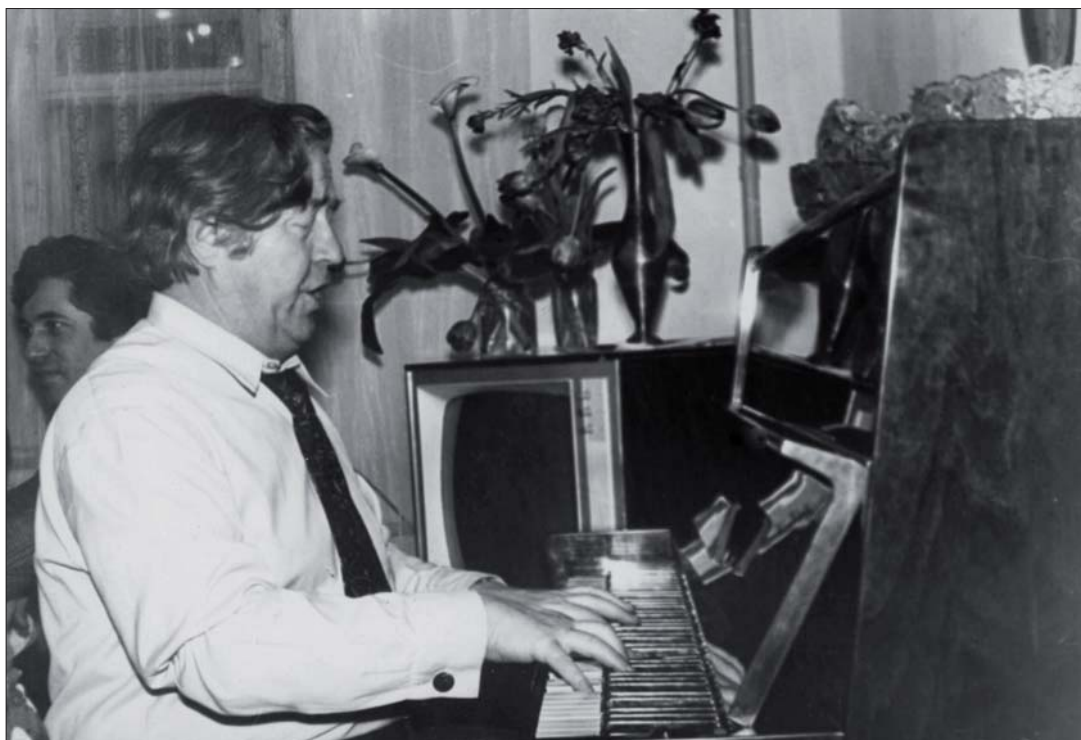
За инструментом. 1970-е гг.