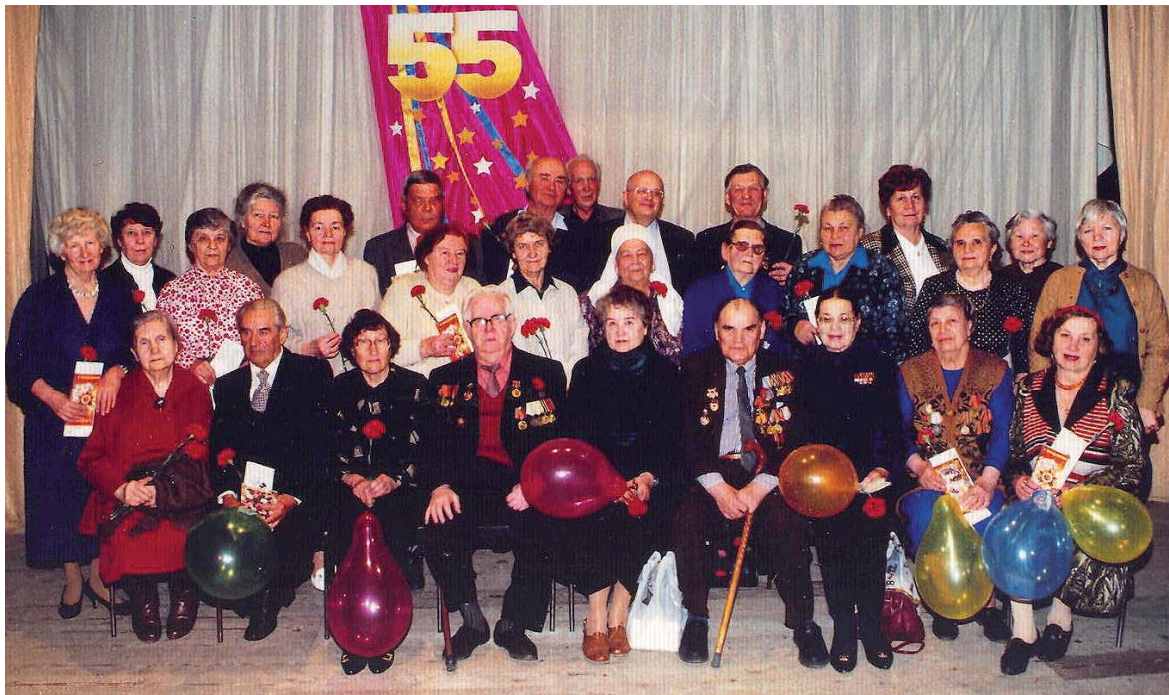
С ветеранами Челябинского колледжа культуры. . 2000 г.