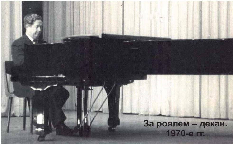
За роялем – декан. 1970-е гг.