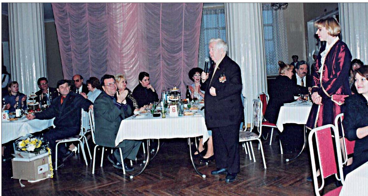
Одна у Перчика семья – его коллеги, студенты, друзья!