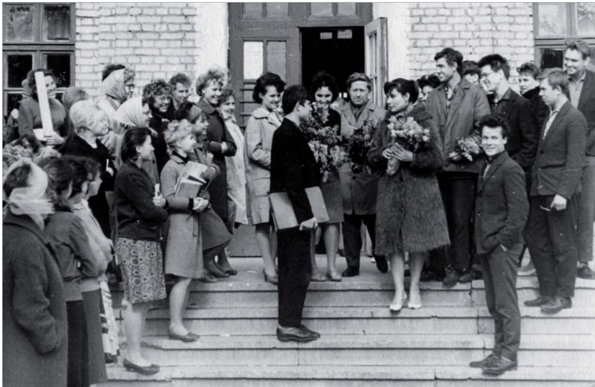
Директор училища культуры со студентами после встречи с актрисой Т. Самойловой. 1965 г.