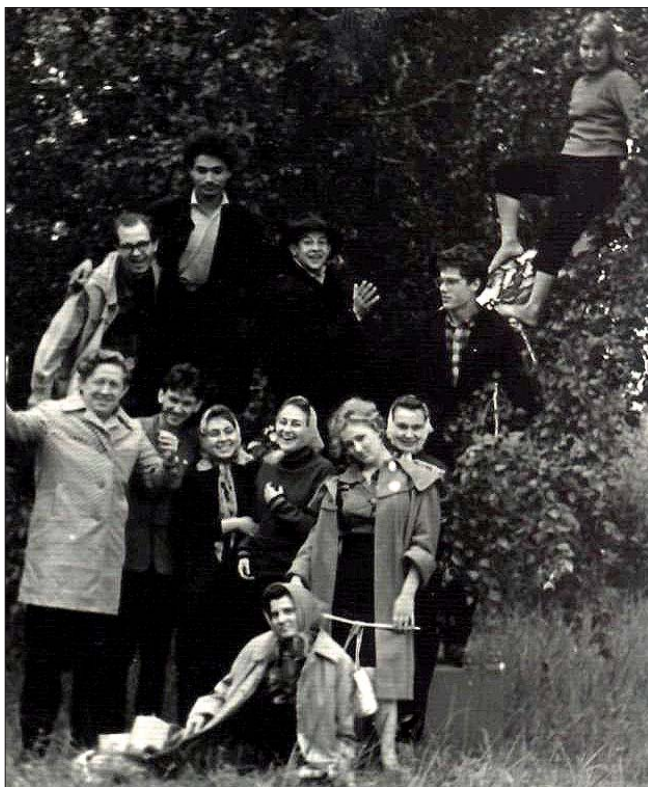
На отдыхе с коллективом ДК ЧМЗ. 1960-е гг.