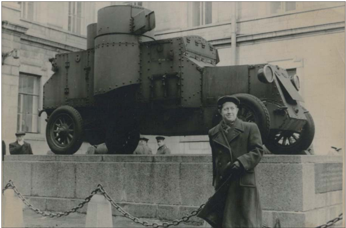
В Ленинграде. 1950-е гг.