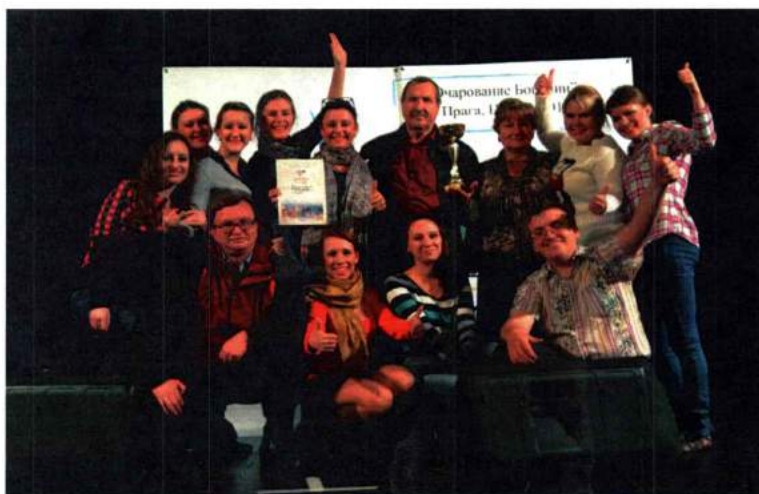
Гран-при конкурса! Вручение диплома и кубка победителя III международного конкурса «Очарование Богемии». Прага (Чехия), 2013 г.