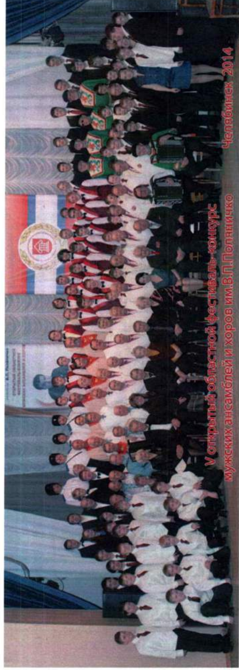
У открытый областной фестиваль-конкурс мужских ансамблей и хоров им.В.П.Полынико