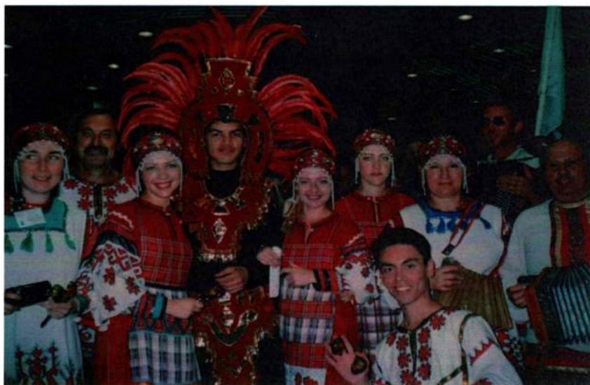
Всемирная хоровая олимпиада в Линце (Австрия). 2000 г.