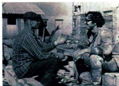
Студенческий строительный отряд «Элита» Уральской государственной консерватории. Совхоз «Пламя», Алапаевский район Свердловской обл. 1969 г.