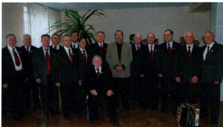
Лауреаты конкурсов «Опаленные сердца», «Золотые россыпи Урала», «Памяти им. В. П. Поляничко» народный коллектив мужской вокальный ансамбль ОАО ЧЭМК «Слав». 2011 г.