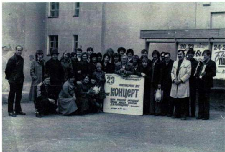
Хор русской песни ДК завода им. Д. Колющенко. Южноуральск, 1991 г.