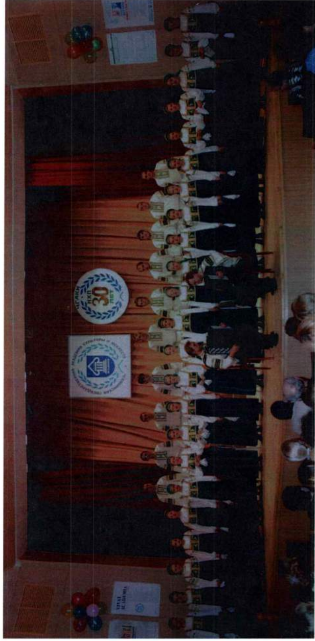
Хор народной музыки «Песни Урала» Челябинской государственной академии культуры и искусств. 2004 г.