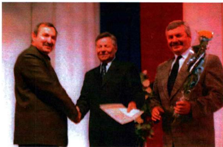
Вручение премии губернатора Челябинской области. 2001 г.