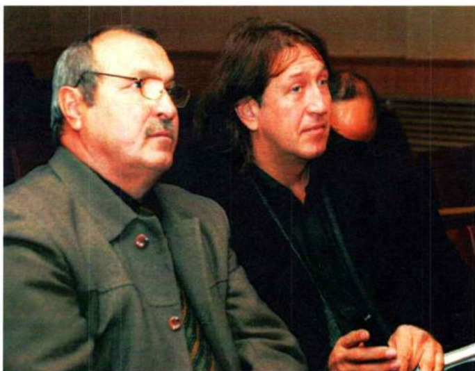
На репетиции хора Челябинской государственной академии культуры и искусств. С народным артистом РФ О. Митяевым. 2009 г.