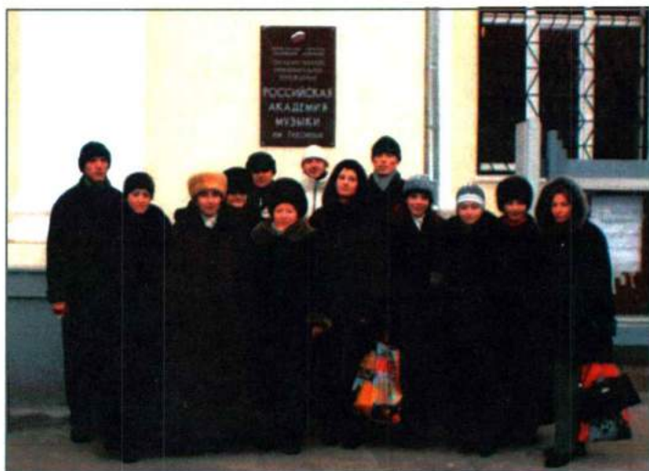
Группа преподавателей и студентов кафедры народного хорового пения в Москве. 2002 г.