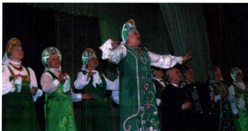
Лауреат VII Областного фестиваля-конкурса хоров ветеранов войны и труда «Золотые россыпи Урала» женский хор русской песни ОАО ЧЭМК. 2013 г.