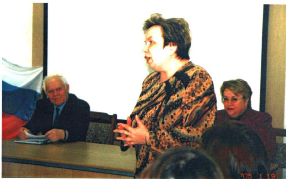
Презентация Центра проблем социокультурной подготовки личности специалиста и коллектива. 19 января 2005 г.