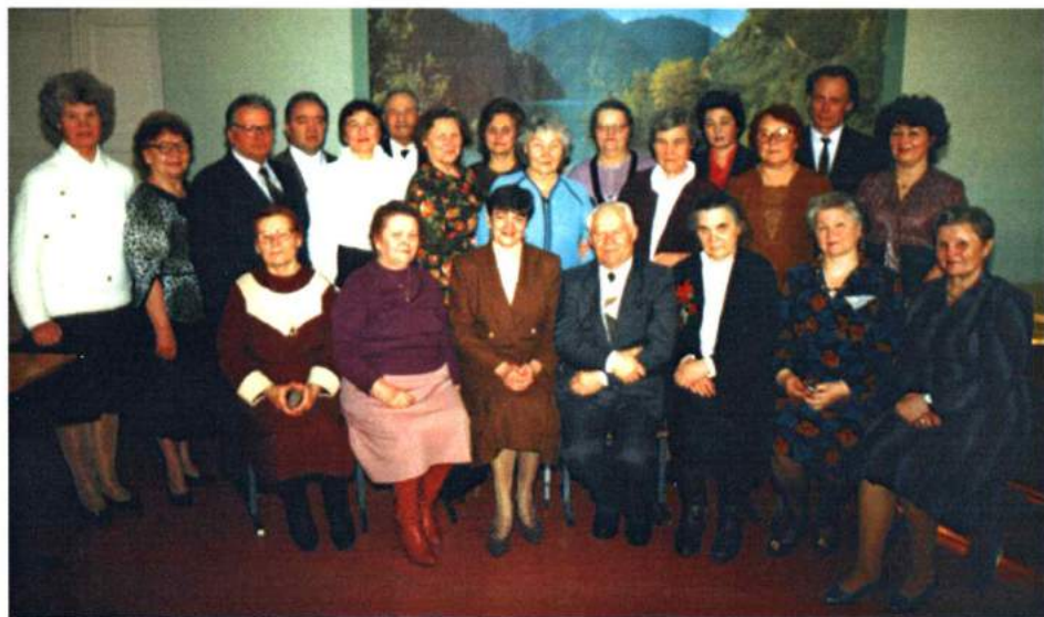
Первый состав педагогического коллектива школы № 96 г. Челябинска (1953 – 1963). Февраль 1995 г.