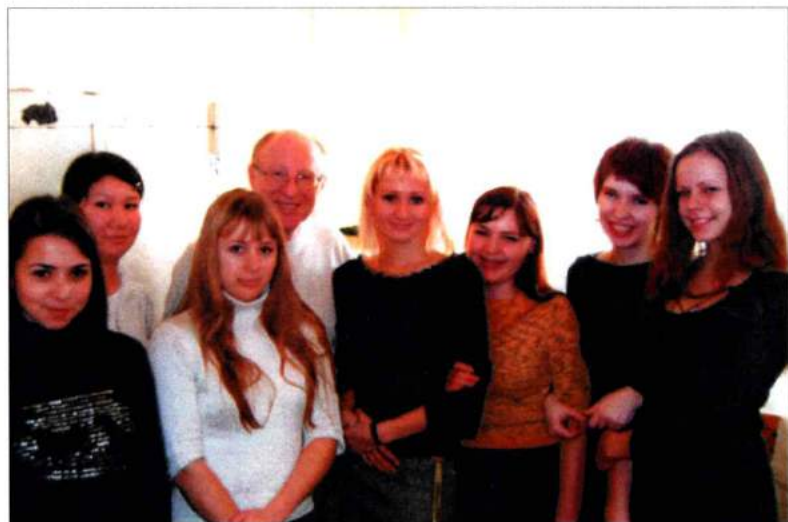
С любимыми студентами исполнительского факультета ЧГАКИ. 2005 г.