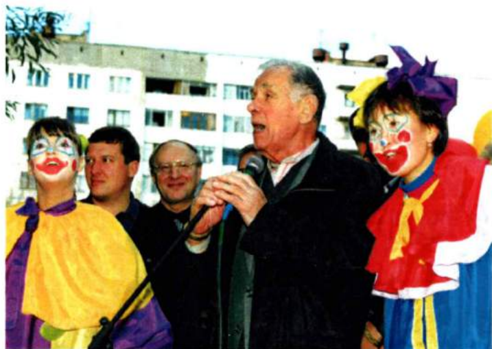
С Георгием Жжёновым на празднике двора. 2003 г.