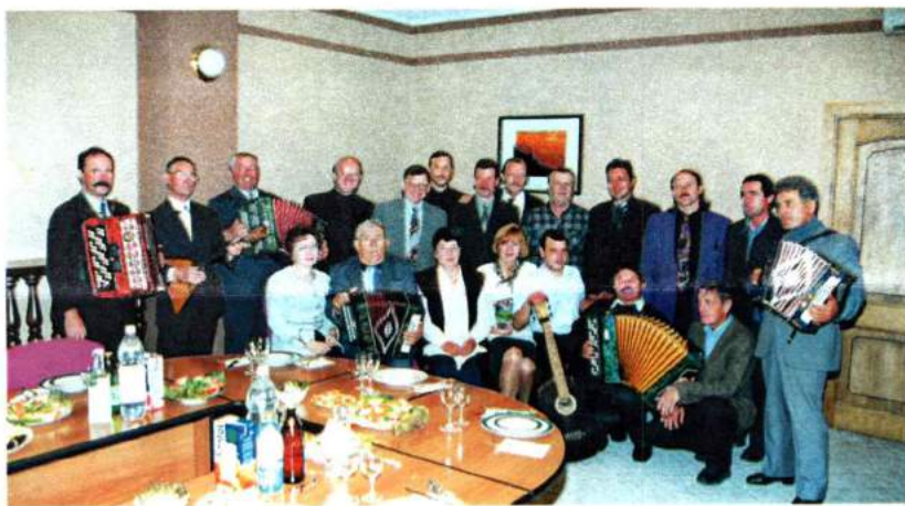
Прием ведущих гармонистов Южного Урала главой Челябинска Вячеславом Тарасовым. 1998 г.