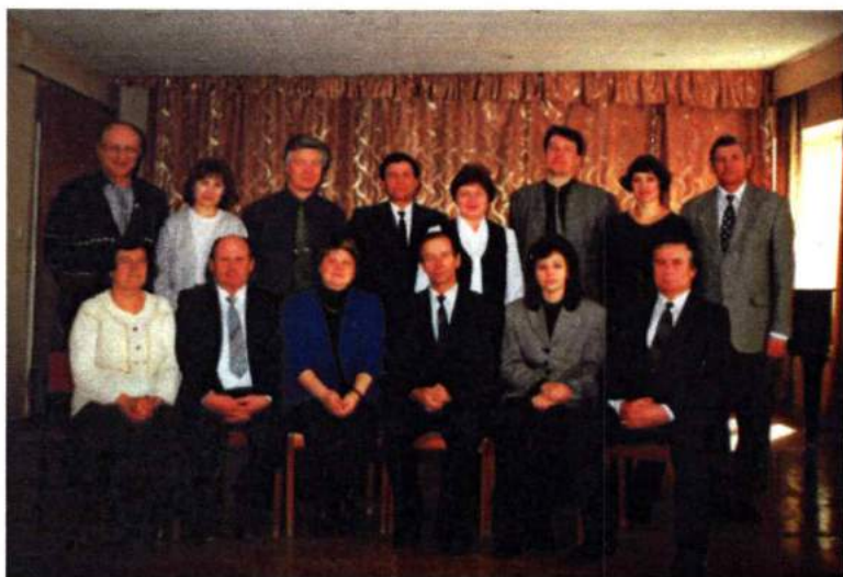
Кафедра народных инструментов ЧГАКИ. 2001 г.