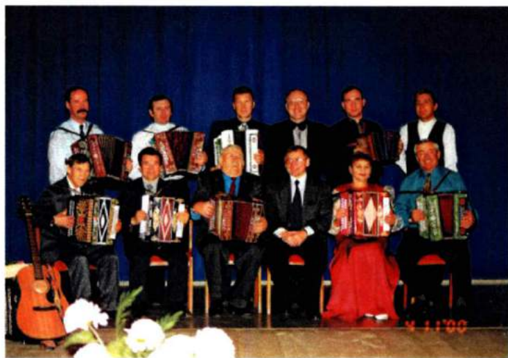
«Золотая десятка» гармонистов Южного Урала. В первом ряду четвертый слева В. М. Тарасов (глава г. Челябинска). 1999 г.