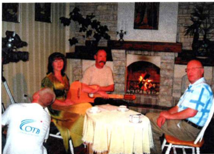
Подготовка к съемкам программы «Искры камина». 2007 г.