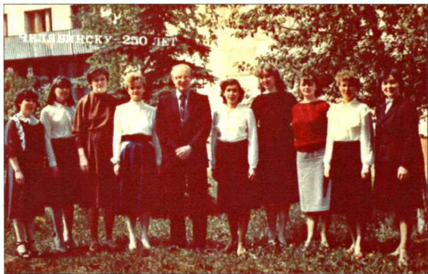
С выпускниками кафедры народных инструментов. Челябинск, 1986 г.