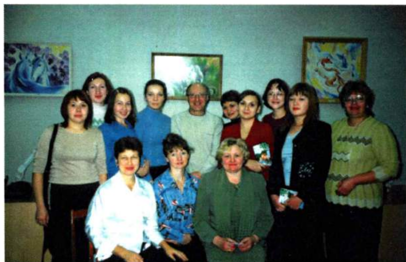
Встреча со студентами факультета документальных коммуникаций ЧГАКИ. 2003 г.