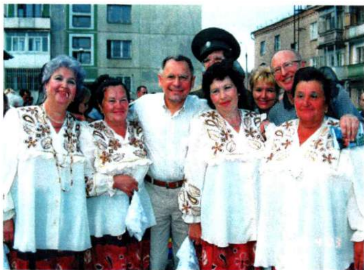
С главой Челябинска В. М. Тарасовым на празднике двора. 2003 г.