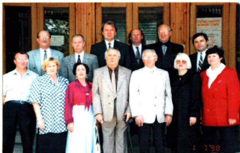
Профессора ЧГИК. 1998 г.