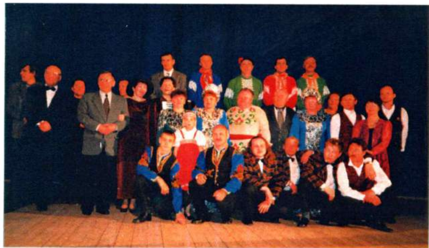
Участники Всероссийского фестиваля «Играй, гармонь». Челябинск, 2000 г.