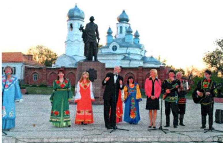
С ансамблем «Уральская гармонь». Троицк, 2005 г.