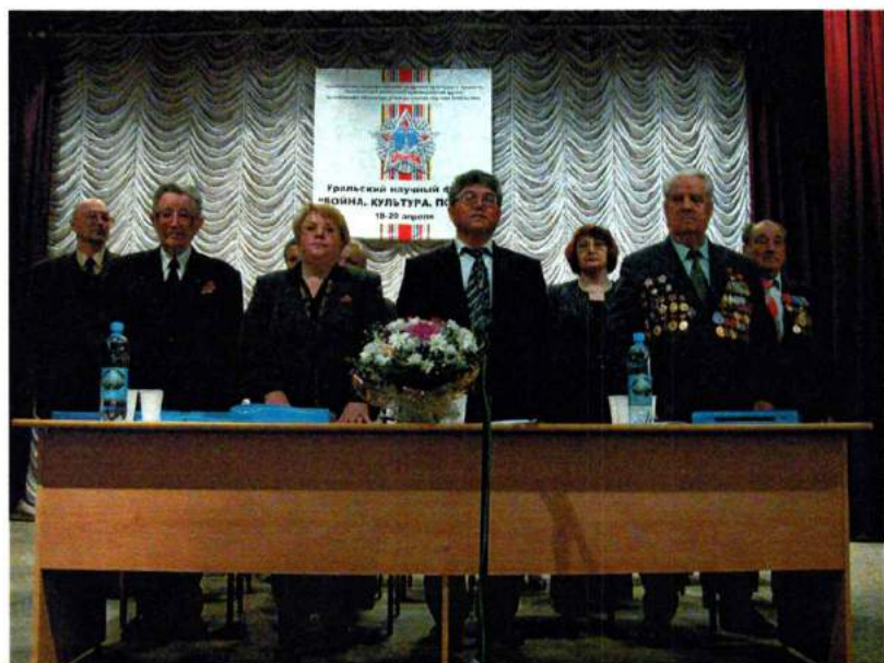
Апрель 2005. В академии прошел уральский научный форум "Война. Культура. Победа"