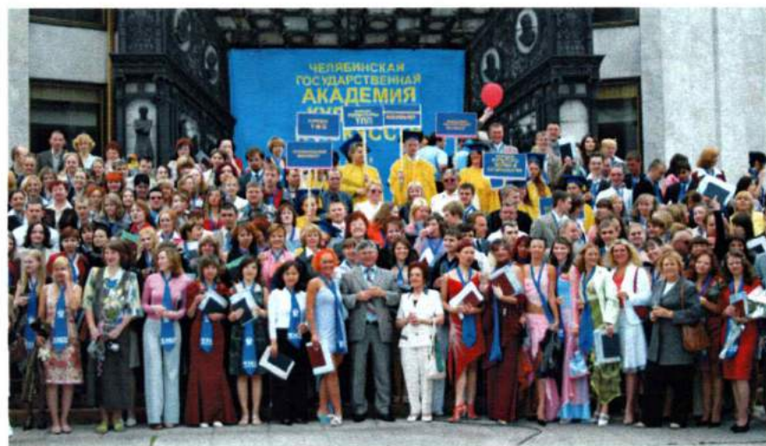
Июнь 2005. Церемония вручения дипломов выпускникам ЧГАКИ на Театральной площади