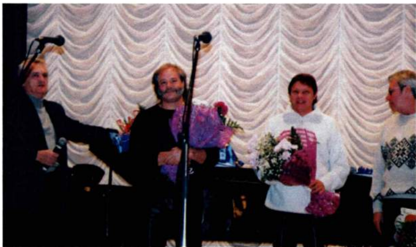
Ноябрь 2004. Творческая встреча с выпускниками академии - участниками ансамбля "Ариэль"