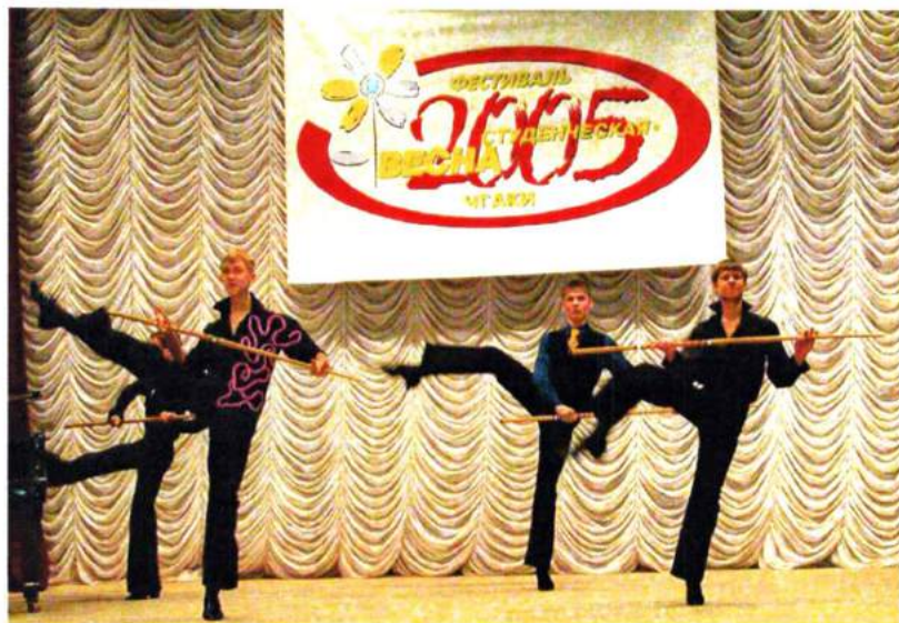
Апрель 2005. Академия заняла первое место на городском и областном фестивале "Весна студенческая"