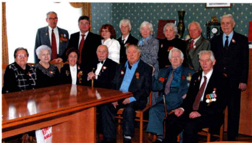
Май 2005. Чествование ветеранов Великой Отечественной войны