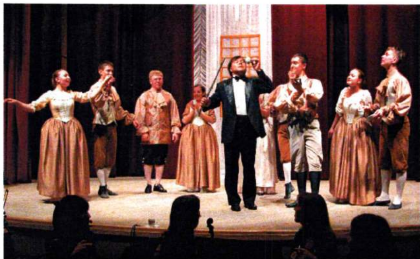
Май 2005. Презентация "Кофейной кантаты" в ЧГАКИ