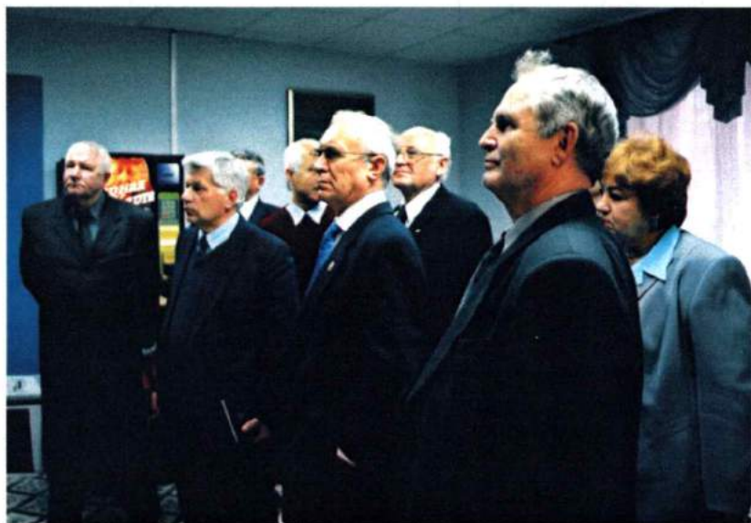
Ноябрь 2004. Выездное заседание совета ректоров Челябинской области прошло в ЧГАКИ