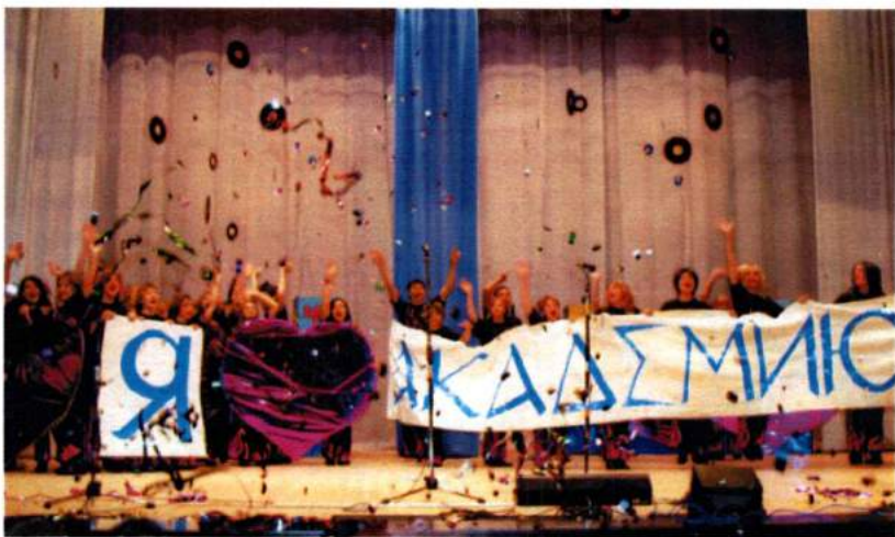
Октябрь 2004. Посвящение в студенты ЧГАКИ