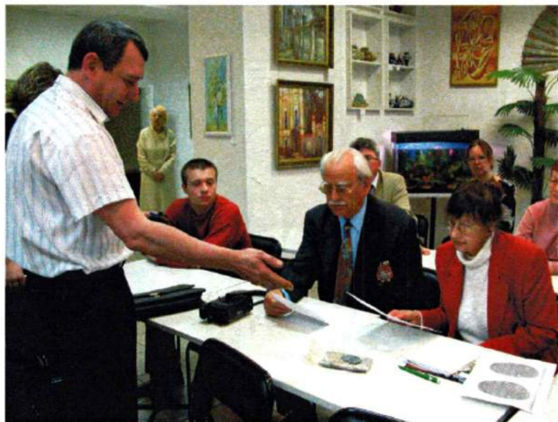
Май 2005. ЧГАКИ посетила делегация из Германии с антивоенной миссией