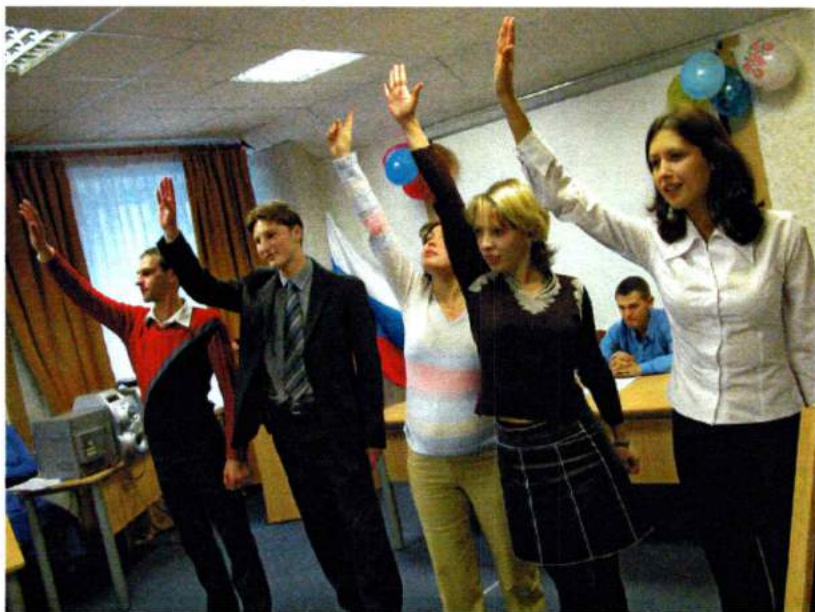
Октябрь 2004. Церемония посвящения аспирантов