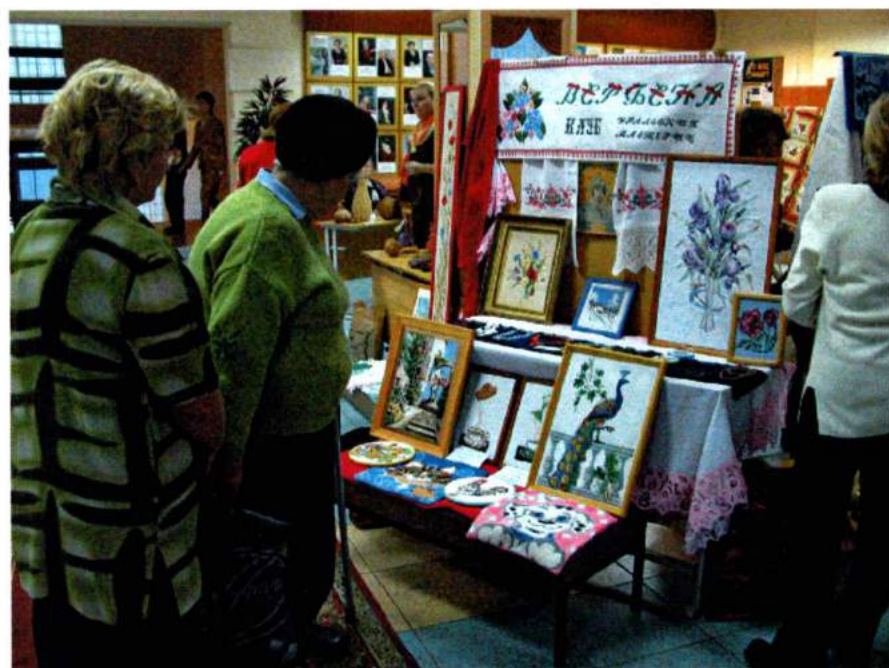
Ноябрь 2005. Проведение областной научно-практической конференции «Развитие клубного семейного творчества как аспект духовно-нравственного воспитания подрастающего поколения»