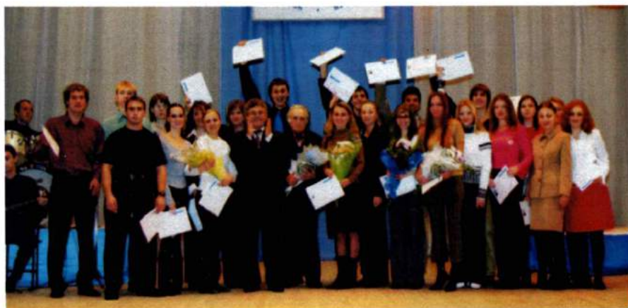
Ноябрь 2004. Ежегодный Слет отличников