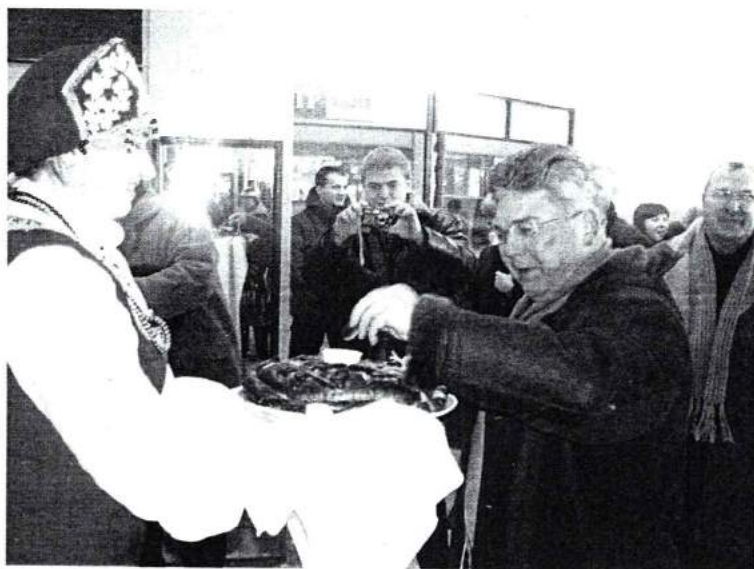
Ноябрь 2006г. Прошли Дни ЧГАКИ в Уральской академии ветеринарной медицины (г. Троицк)