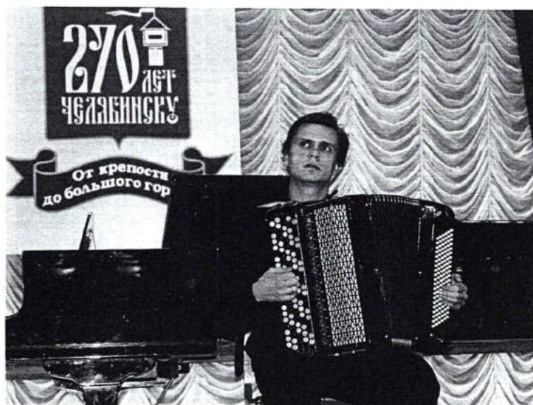
Октябрь 2006г. В академии прошло празднование Дня музыки