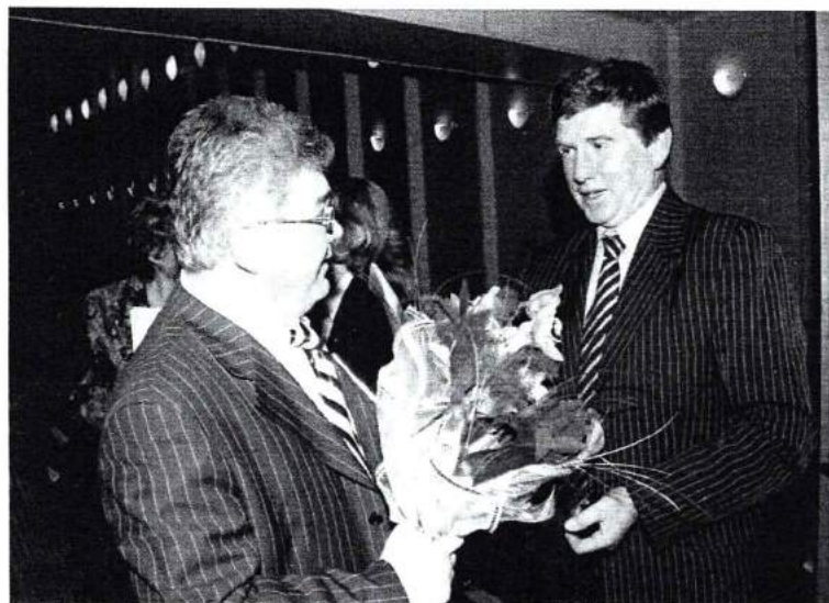
Февраль 2007г. В академии прошли выборы ректора. На фото: ректор ЧГАКИ В.Я. Рушанин принимает поздравления Министра культуры Челябинской области В.Н. Макарова