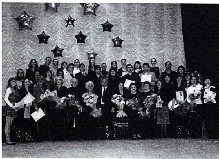
Ноябрь 2006г. В академии прошел Слет отличников ЧГАКИ