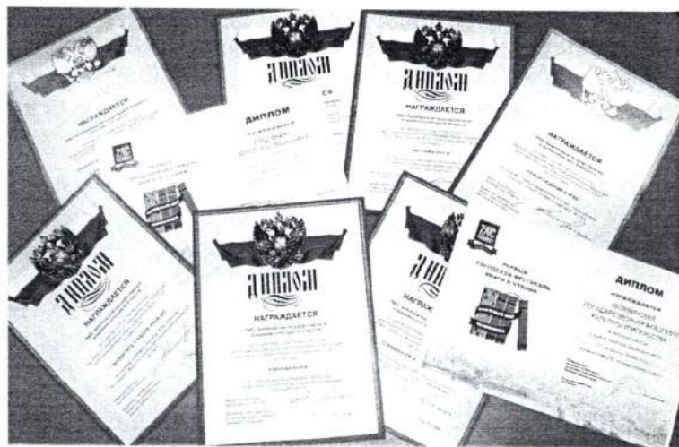
Сентябрь 2006г. Академия завоевала 9 дипломов за лучшую издательско-полиграфическую продукцию на выставке «Южноуральская книга 2006»