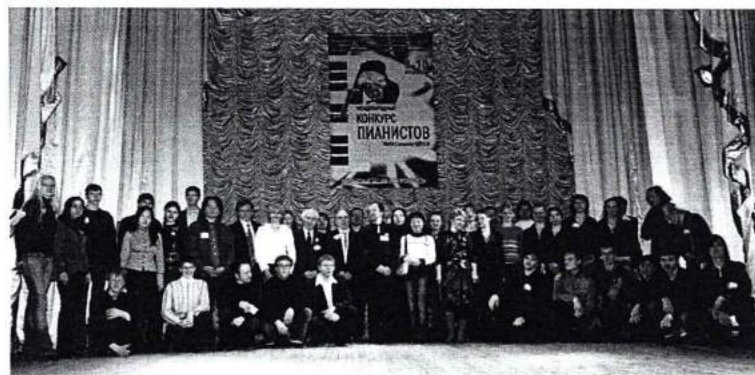
Март 2007г. В академии прошел Международный конкурс пианистов им. С. Нейгауза