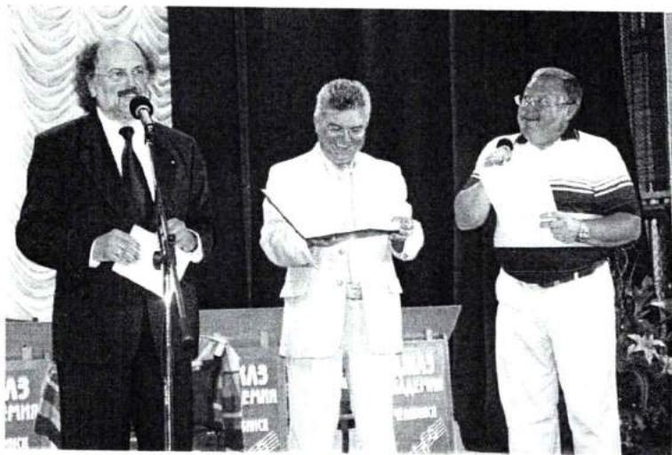
Март 2007г. ЧГАКИ посетил ректор Народного университета Рудольф Зигерист (Германия)