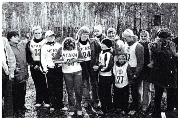
Сентябрь 2006г. На базе летнего лагеря «Мелодия» прошел традиционный «осенний» День здоровья