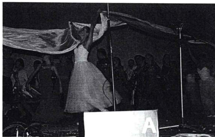
Октябрь 2006г. Состоялось посвящение в студенты ЧГАКИ