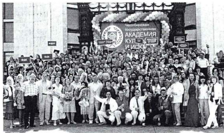
Июнь 2007г. Состоялось вручение дипломов выпускникам ЧГАКИ на Театральной площади г. Челябинска