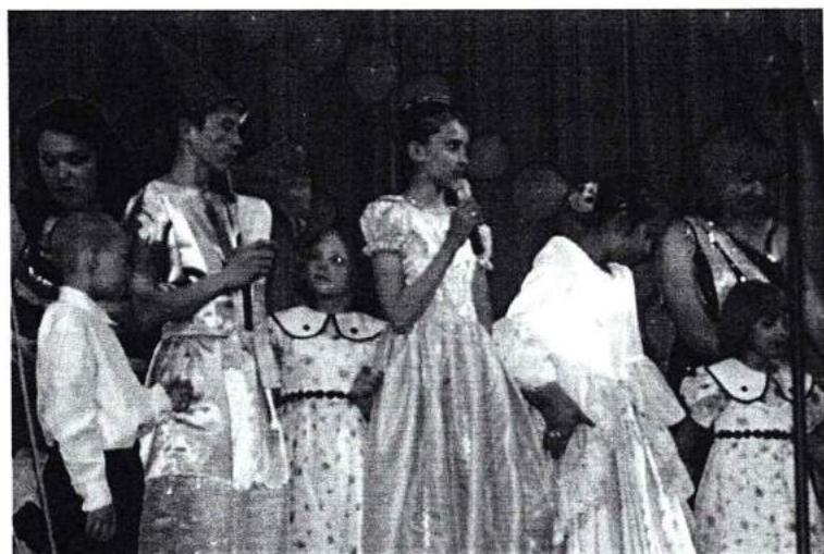
Апрель 2007г. Состоялся областной фестиваль «Ты не один!»