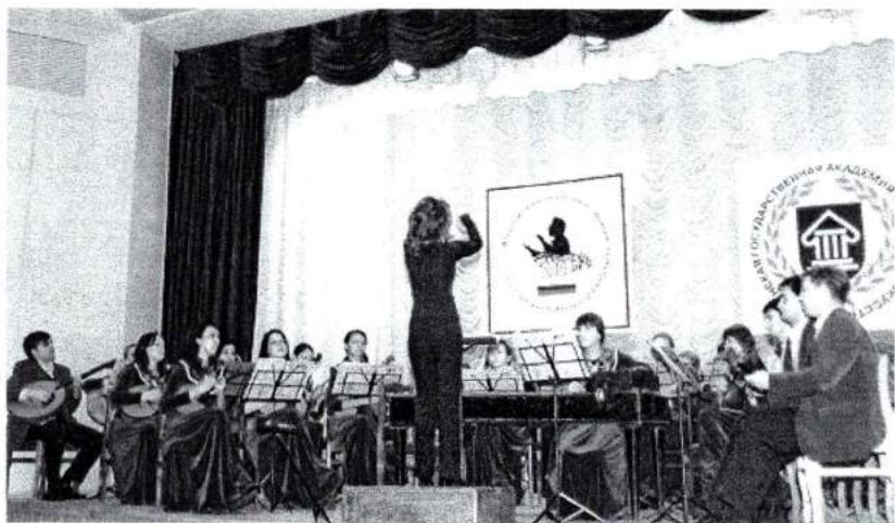
Март 2008 г. Третий Уральский межвузовский конкурс дирижеров оркестров русских народных инструментов