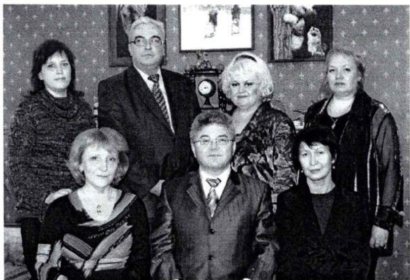
Февраль 2008 г. Выпускники ЧГАКИ – лауреаты VI премии имени П. В. Сапронова