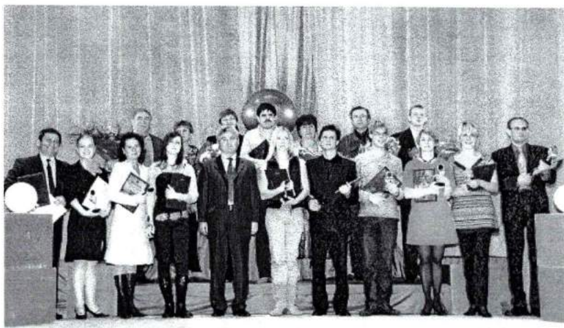
Март 2008 г. Праздник, посвященный Дню работника культуры