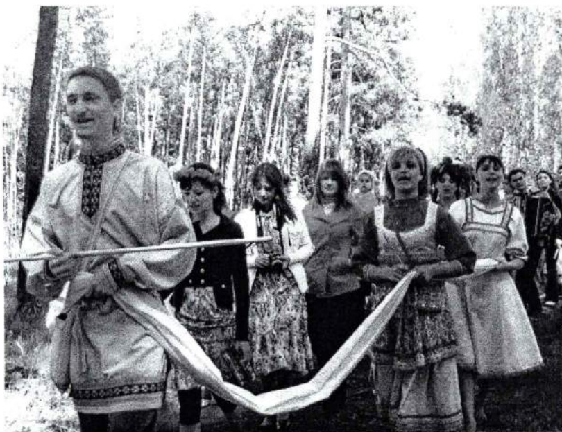
Май 2008 г. Праздник Стрелы в Каштаке