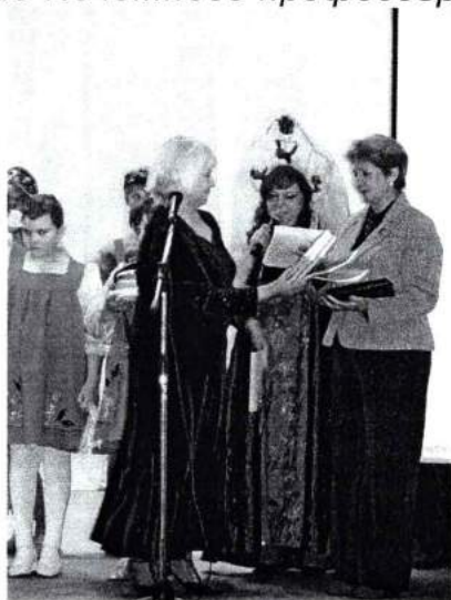
Январь 2008 г. Детский фестиваль национальной культуры «Чудеса малахитовой шкатулки»