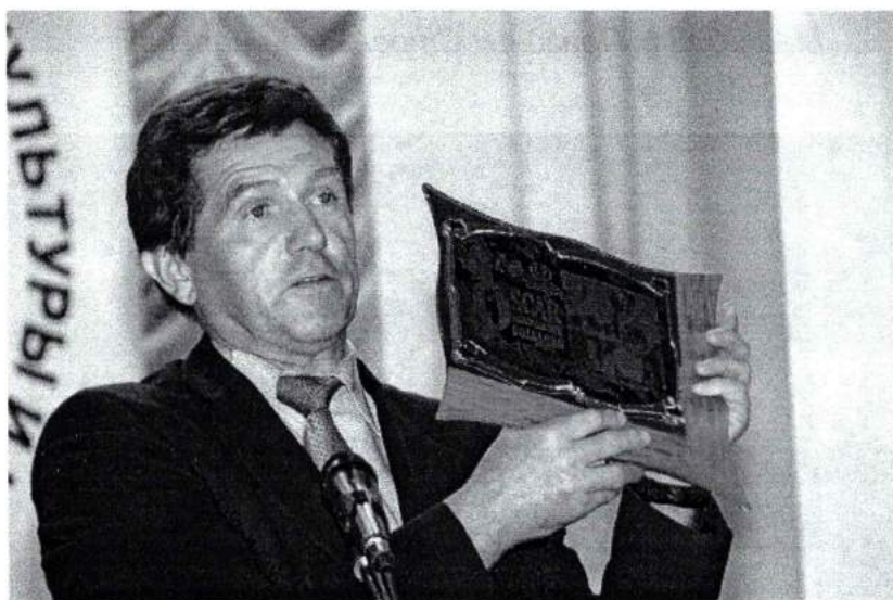
Май 2008 г. Академия культуры и искусств – обладатель международного «Оскара» в области фольклора