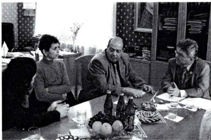
Апрель 2008 г. Посещение ЧГАКИ делегацией из Египетской академии художеств