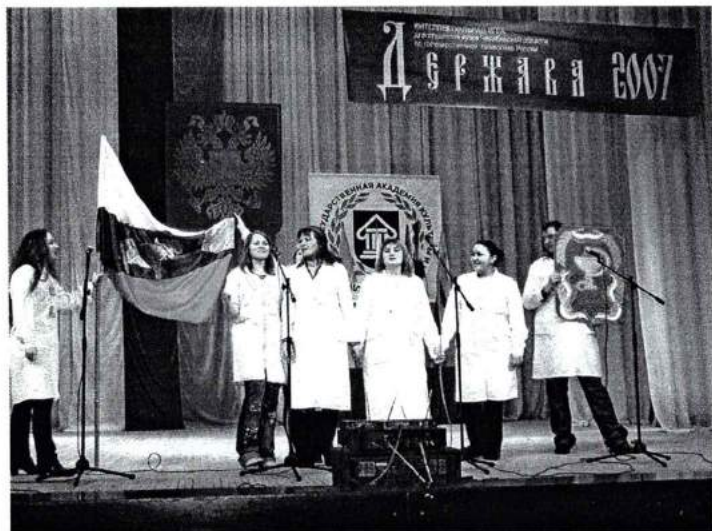
Ноябрь 2007 г. Студенческая интеллектуальная игра "Держава"