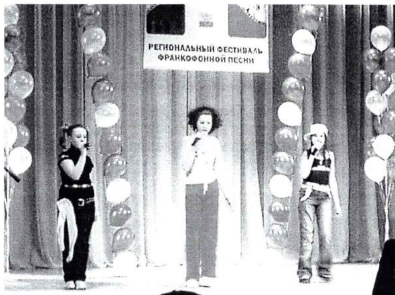
Апрель 2008 г. Региональный фестиваль французской песни