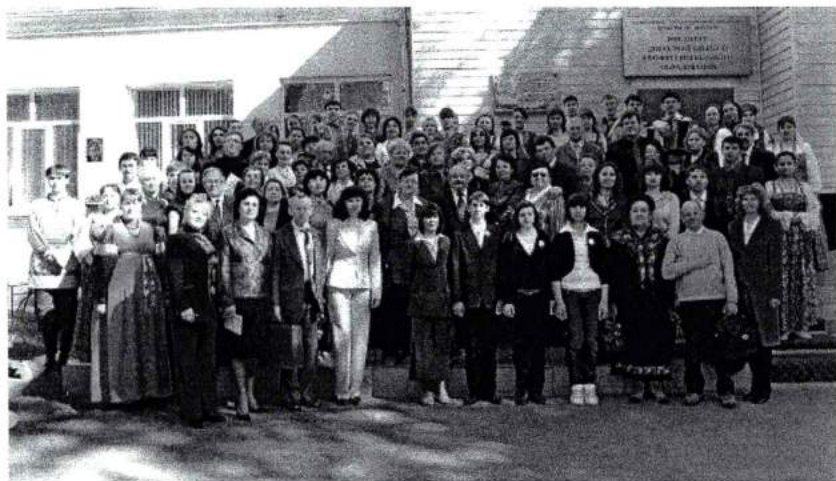
Май 2008 г. Четвертые Лазаревские чтения в ЧГАКИ