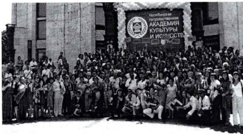
Июнь 2008 г. На церемонии вручения дипломов выпускникам ЧГАКИ