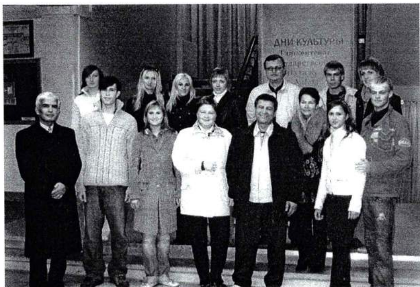
Сентябрь 2007 г. Преподаватели и студенты ЧГАКИ во время проведения дней культуры в Ташкенте