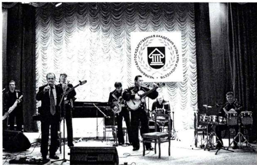
Апрель 2008 г. Концерт группы «Шико»