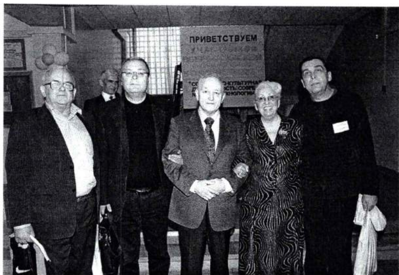
Ноябрь 2007 г. Участники Всероссийской научно-практической конференции "Социально-культурная деятельность: современные технологии"