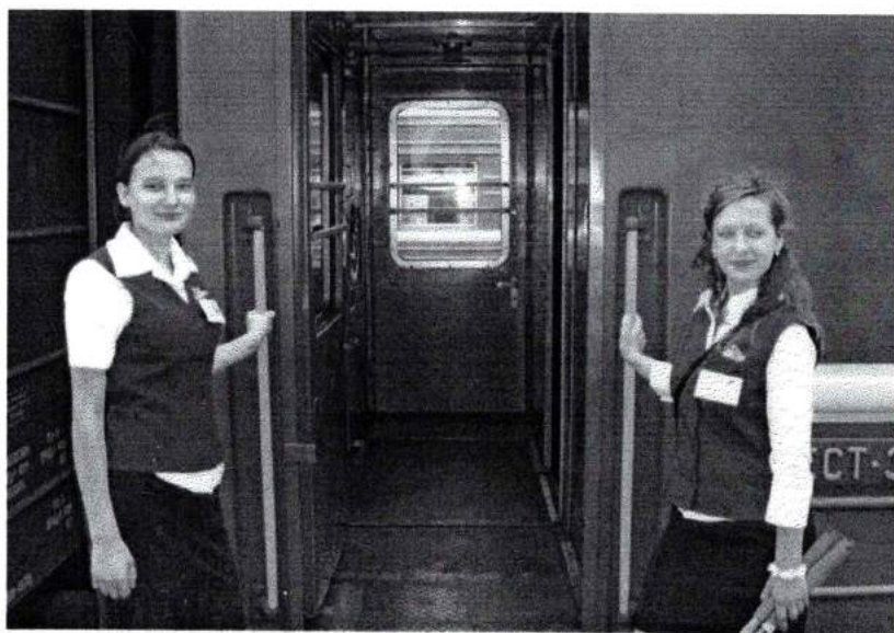
Июль 2009 г. Студенческий отряд проводников «Стрела» готовится к поездке