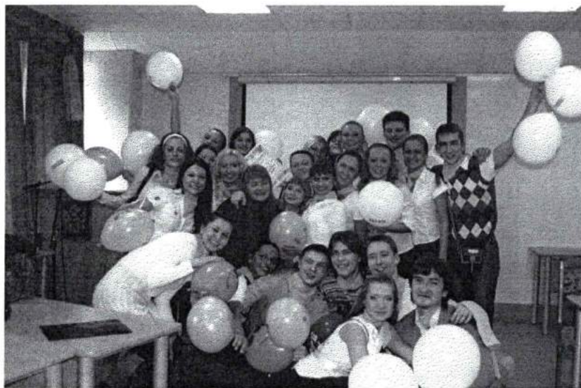
Апрель 2009 г. Лучшая группа Академии 2009 г. – 305 группа хореографического факультета