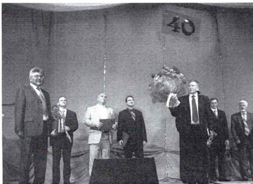
Октябрь 2008 г. Празднование 40-летия Академии. Нас поздравляют ректоры вузов