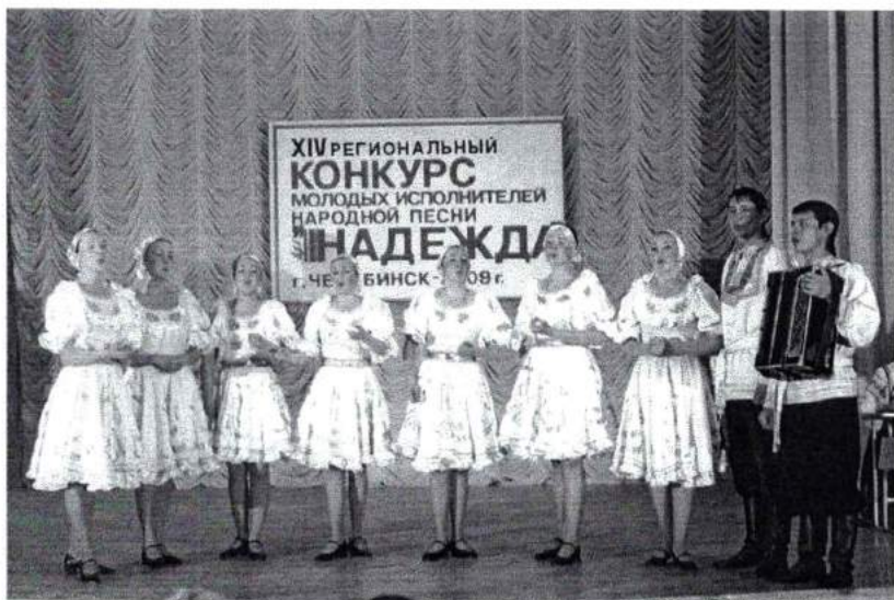
Апрель 2009 г. Конкурс исполнителей народной песни в Академии