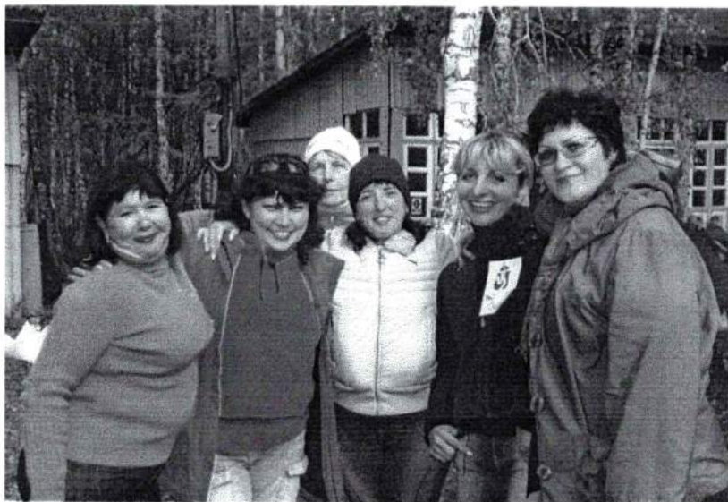
Сентябрь 2008 г. Дружный коллектив бухгалтерии на Дне здоровья в лагере «Мелодия»