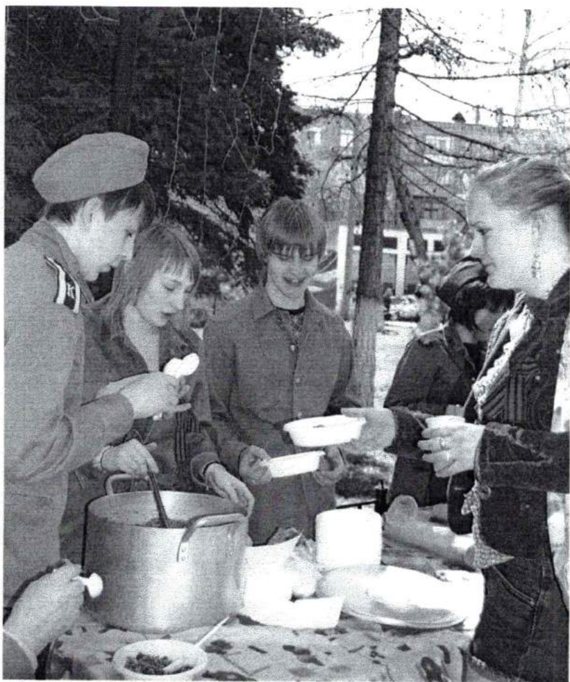
Май 2009 г. Солдатская каша