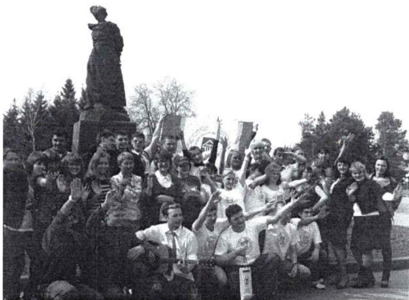
Май 2009 г. Проводы орлят-2009