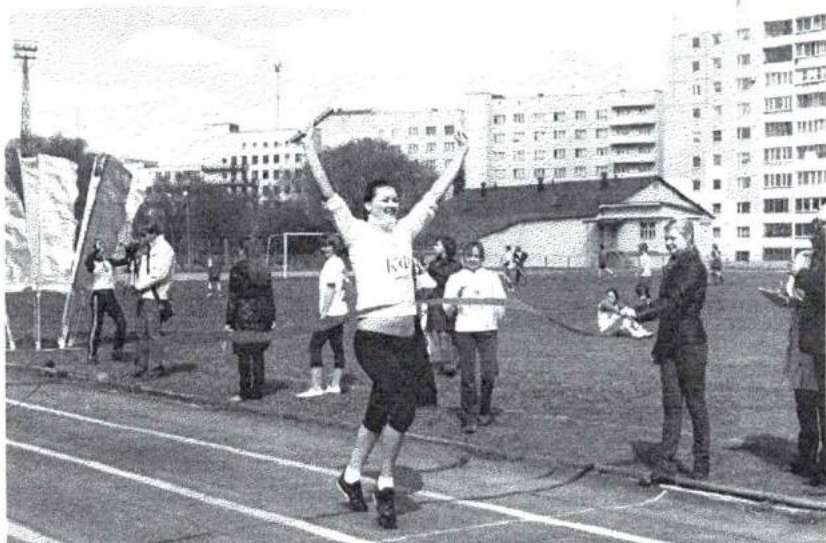
Май 2009 г. Это сладкое слово - ПОБЕДА! Студенческий спортивный праздник