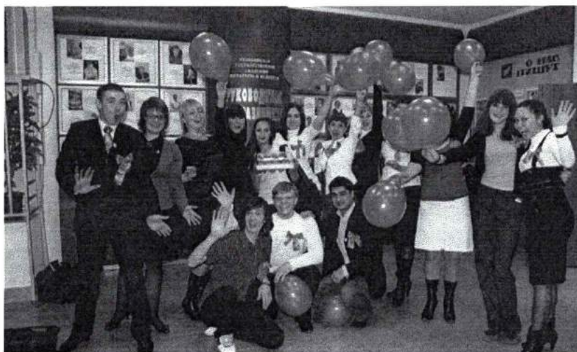
Апрель 2009 г. Новый состав Студсовета Академии