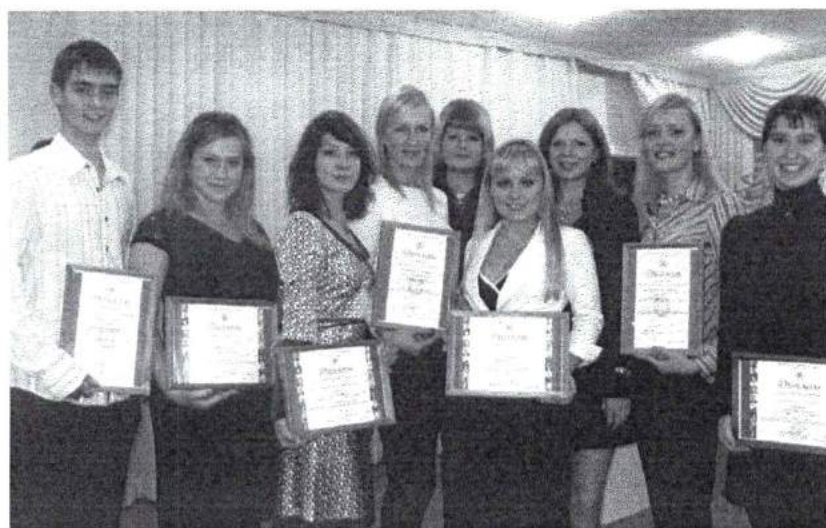
Ноябрь 2008 г. Именные стипендиаты Академии