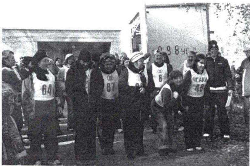
Сентябрь 2008 г. На старт! День здоровья в лагере «Мелодия»