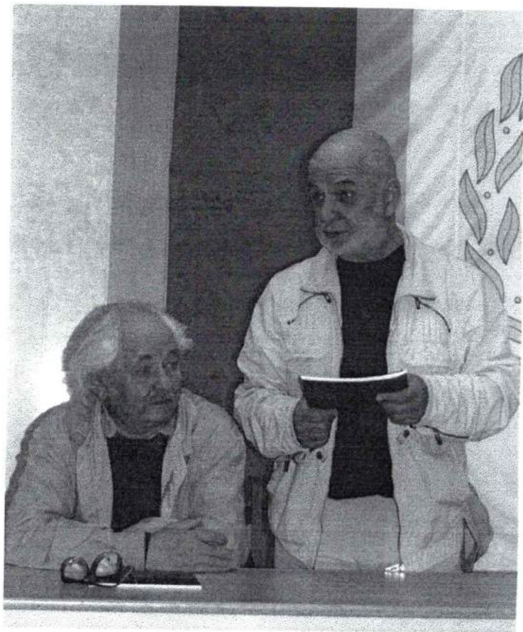
Май 2009 г. Художники на презентации каталога художественной коллекции ЧГАКИ «АКАДЕМИЯ» 2004-2008