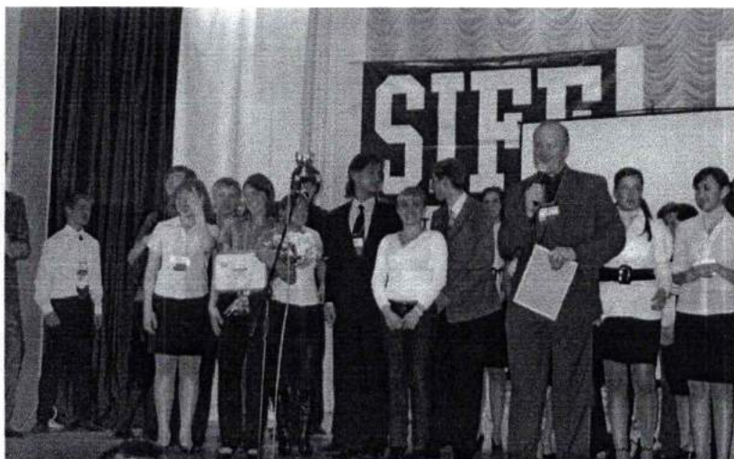
Апрель 2009 г. Команда ЧГАКИ – победитель областного конкурса SIFE