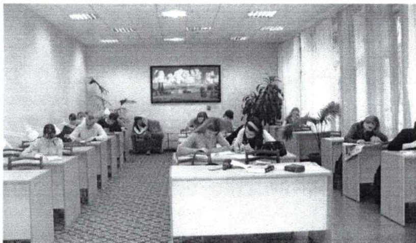
Студенты в библиотеке