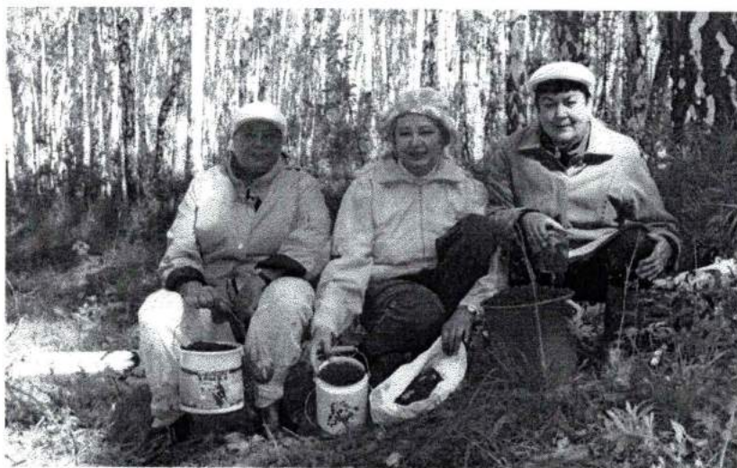
Июль 2009 г. На отдыхе в спортивно-оздоровительном лагере «Мелодия»