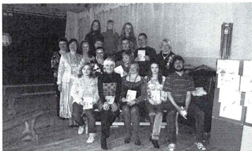
Май 2009 г. Презентация сборника поэтической студии «Взлетная полоса»