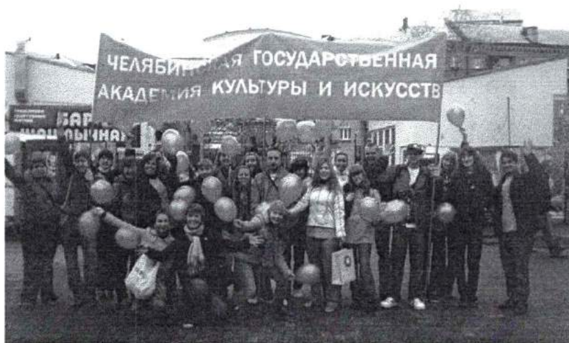
1 мая. Студенты на демонстрации