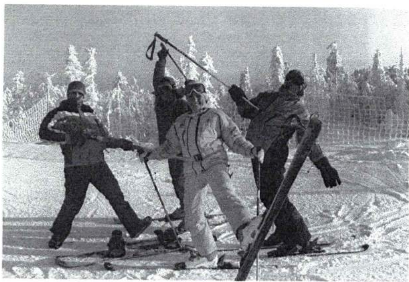
Январь 2009 г. Студенческие каникулы