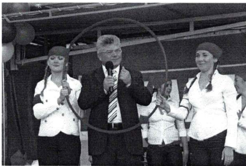
1 сентября 2008 г. День знаний в Академии