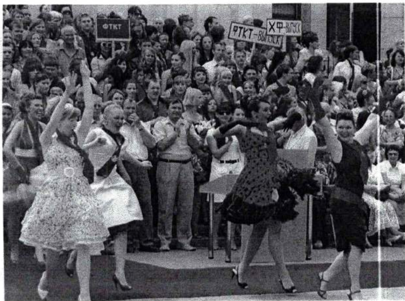
Июнь 2009 г. Выпускники – 2009