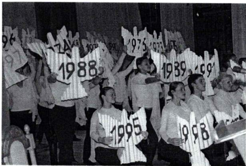
Октябрь 2008 г. Празднование 40-летия Академии