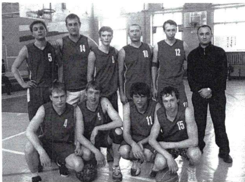
Март 2009 г. Сборная команда Академии по баскетболу