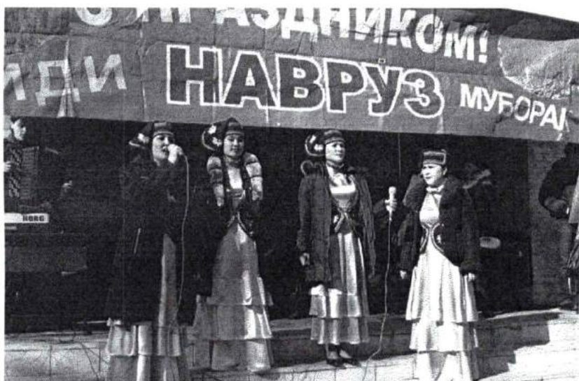
Март 2009 г. Навруз - праздник весны