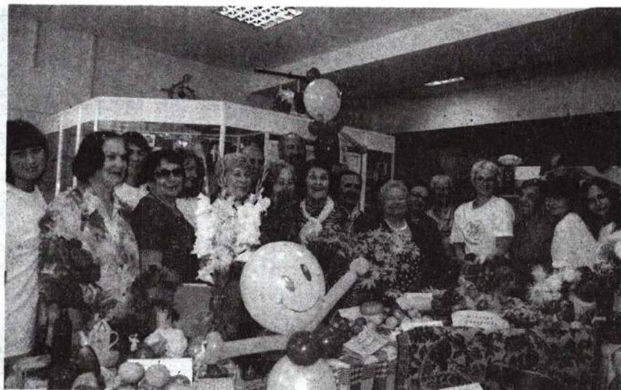
Конкурс «Дары природы» 12 сентября 2011 г.