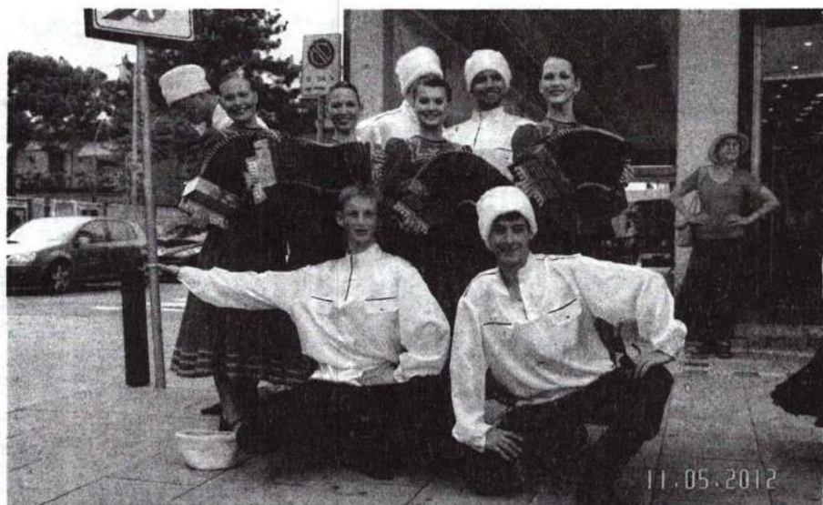
Хореографический фестиваль в Италии 11 мая 2012 г.