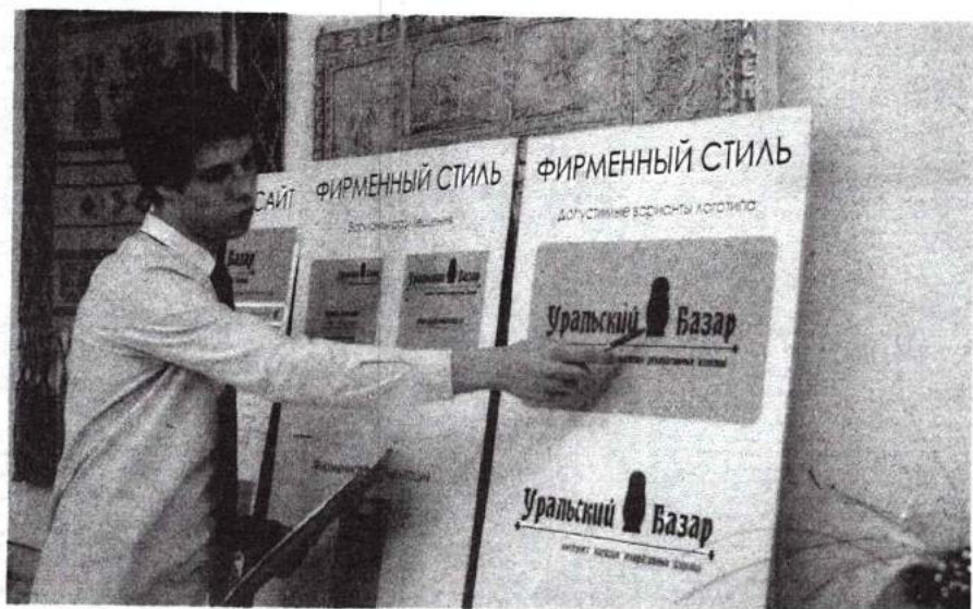
Защита дипломных проектов 14 июня 2012 г.