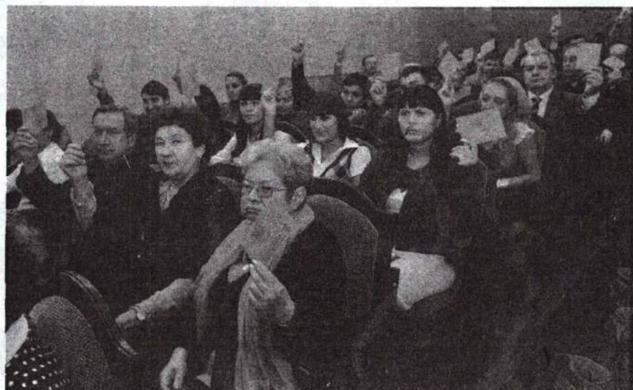
Выборы ректора 22 декабря 2011 г.