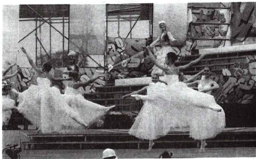
XX всероссийский фестиваль «Российская студенческая весна – 2012» 14–18 мая 2012 г.