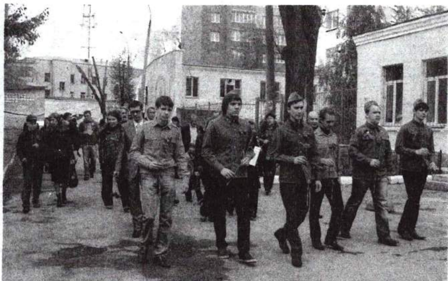
День Победы 5 мая 2012 г.