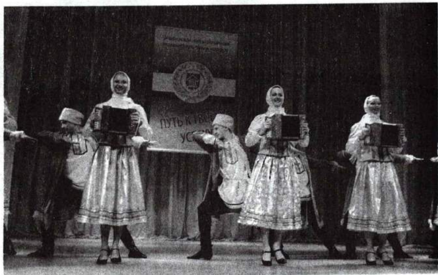
День открытых дверей 13 ноября 2011 г.