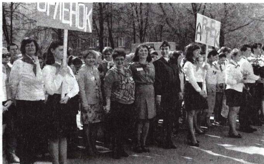
Слет вожатых ВДЦ «Орленок» и МДЦ «Артек» 18 апреля 2012 г.