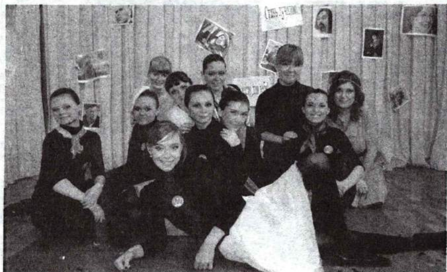
704 ИДР – лучшая группа академии 2012 г. 27 апреля 2012 г.