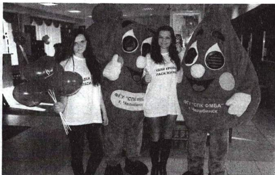
День донора 5 апреля 2011 г.