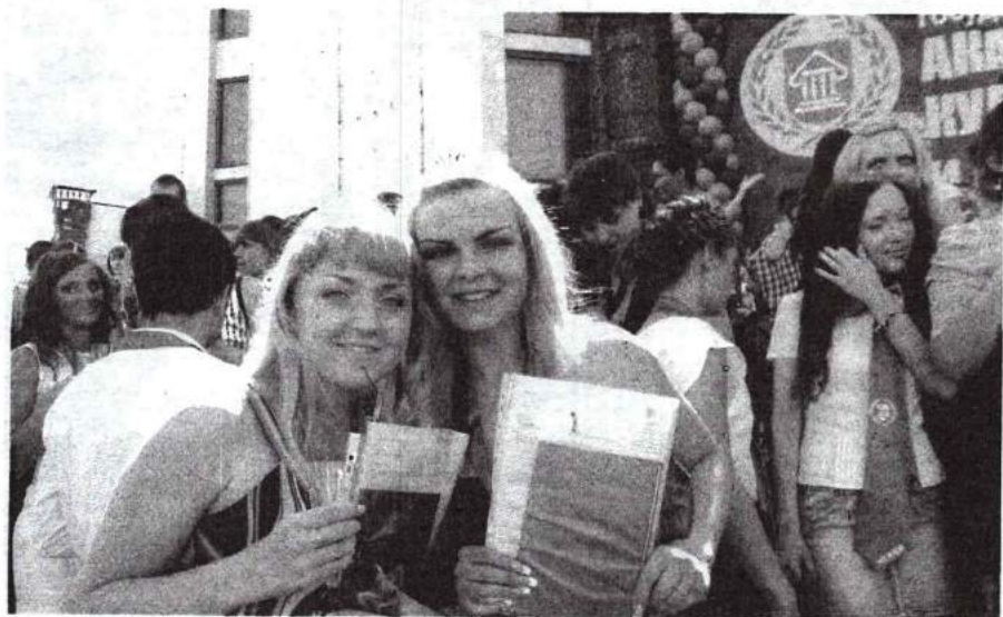
Церемония вручения дипломов «Миссия выполнима» 23 июня 2012 г.