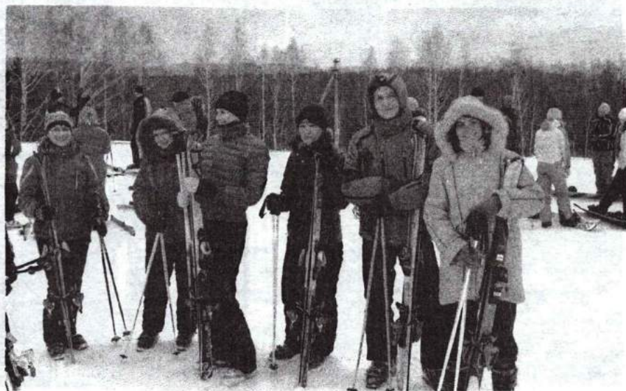
День здоровья 5 марта 2012 г.