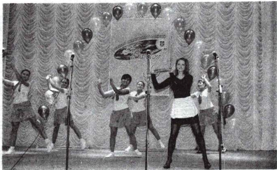
Смотр студенческих объединений «Вояж» 16 ноября 2011 г.