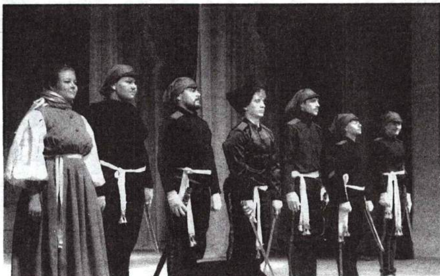
Интеллектуальная игра «1812 год» 16 марта 2012 г.