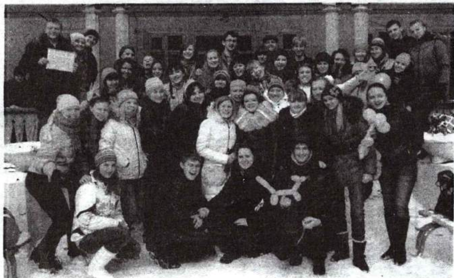
Учебно-методические сборы студенческого актива 24–26 марта 2012 г.