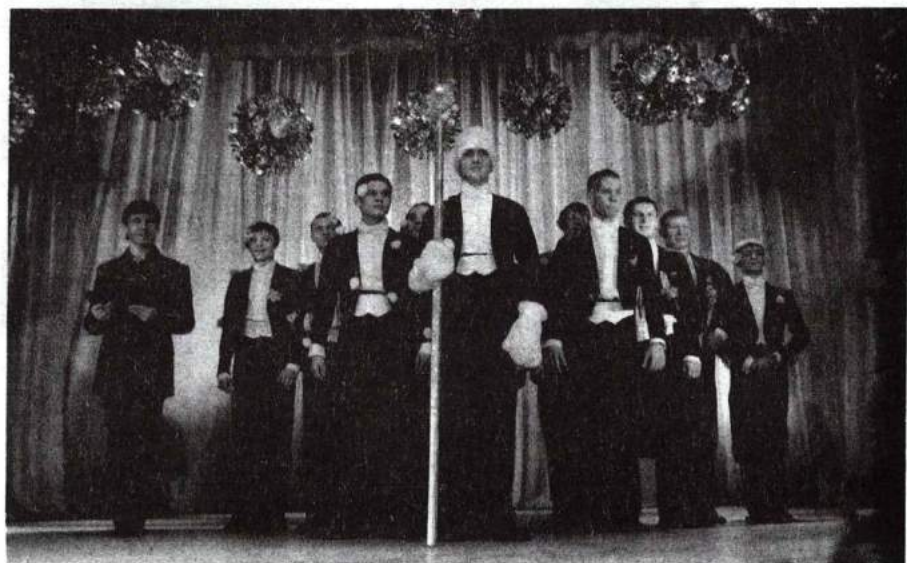
Концерт, посвященный празднованию Нового года 29 декабря 2011 г.