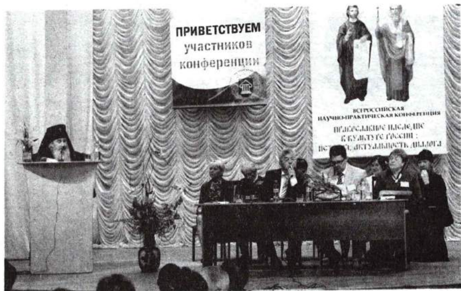
X Славянский научный сбор 17 мая 2012 г.