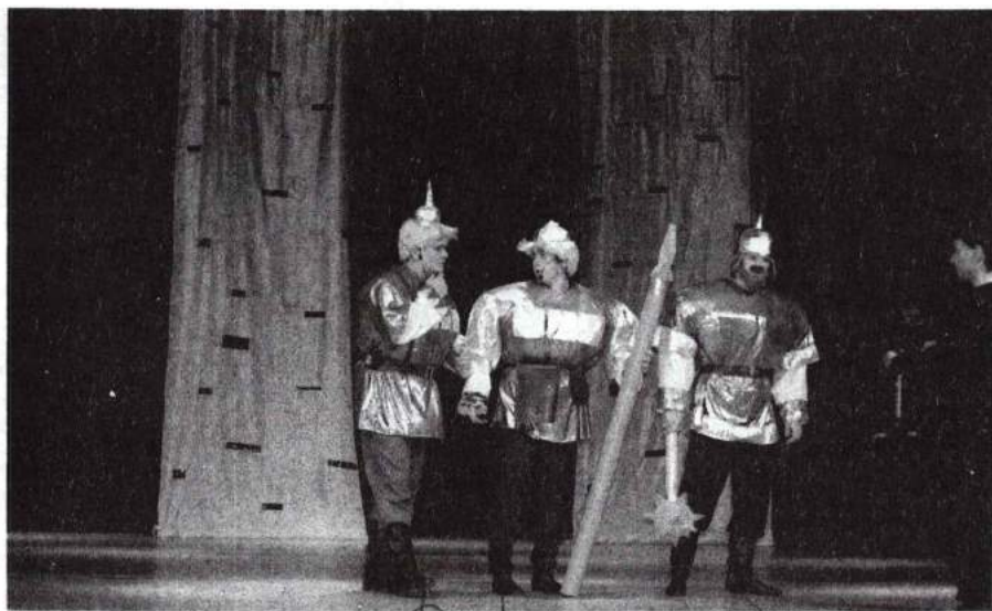
Посвящение в студенты «Три богатыря» 17 октября 2011 г.