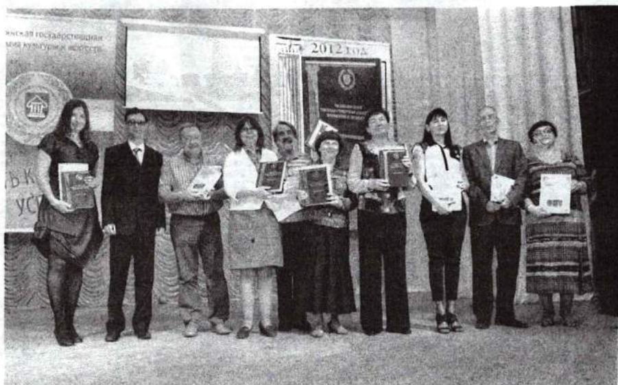
Презентация энциклопедии академии 20 апреля 2011 г.