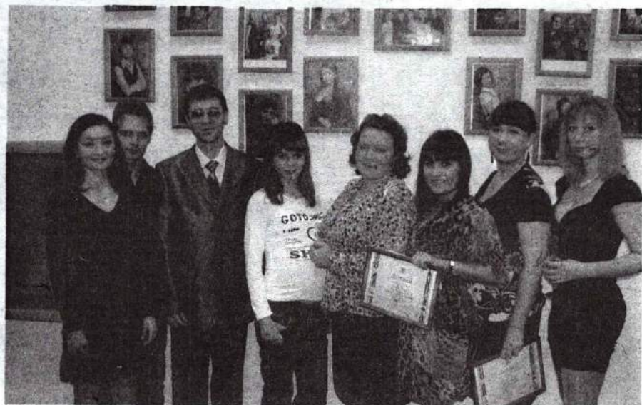
Торжественный прием именных стипендиатов 17 ноября 2011 г.