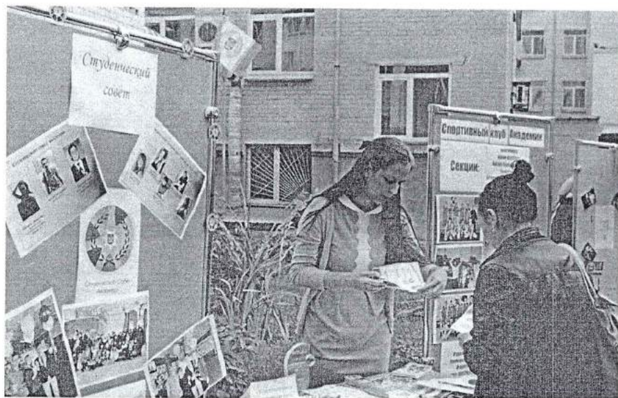
9–13 сентября 2013 г. Неделя первокурсника