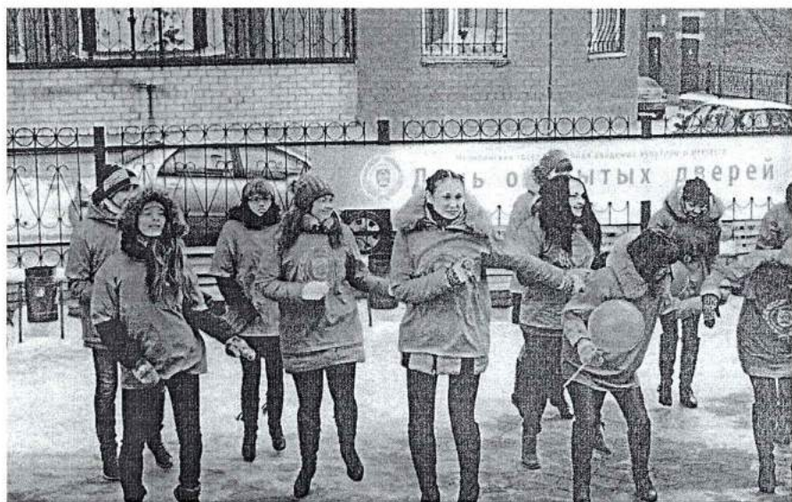
2 марта 2014 г. День открытых дверей