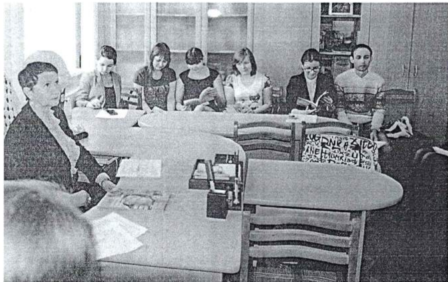
10 апреля 2014 г. 46 научная студенческая конференция