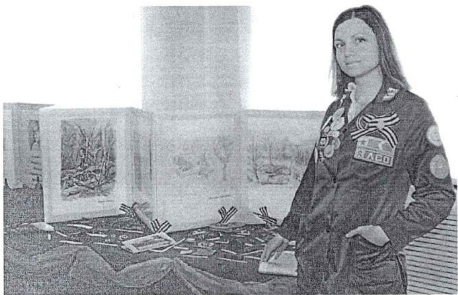
8 мая 2014 г. Выставка находок поискового отряда