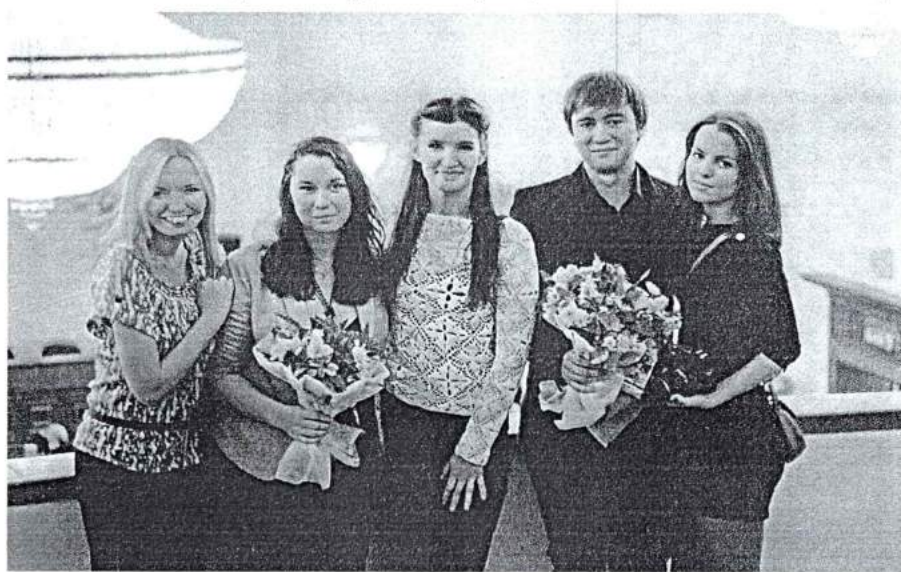
15 ноября 2013 г. Стипендиаты Законодательного собрания Челябинской области