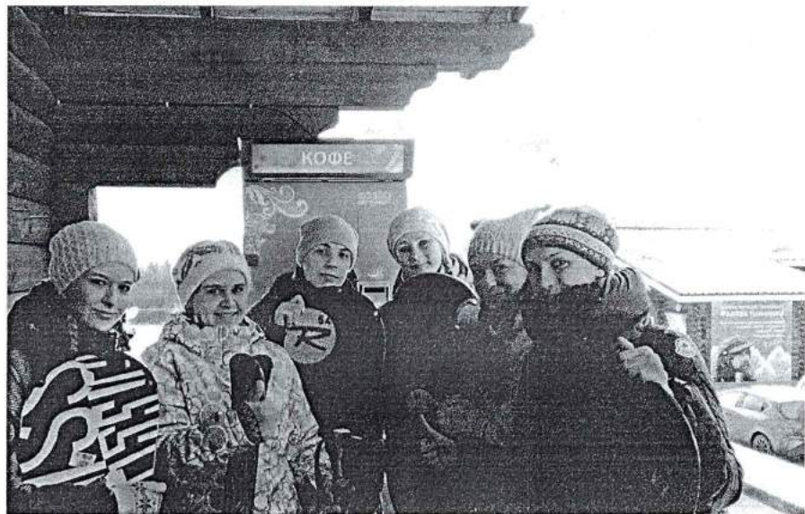
7 декабря 2013 г. День здоровья в Солнечной Долине