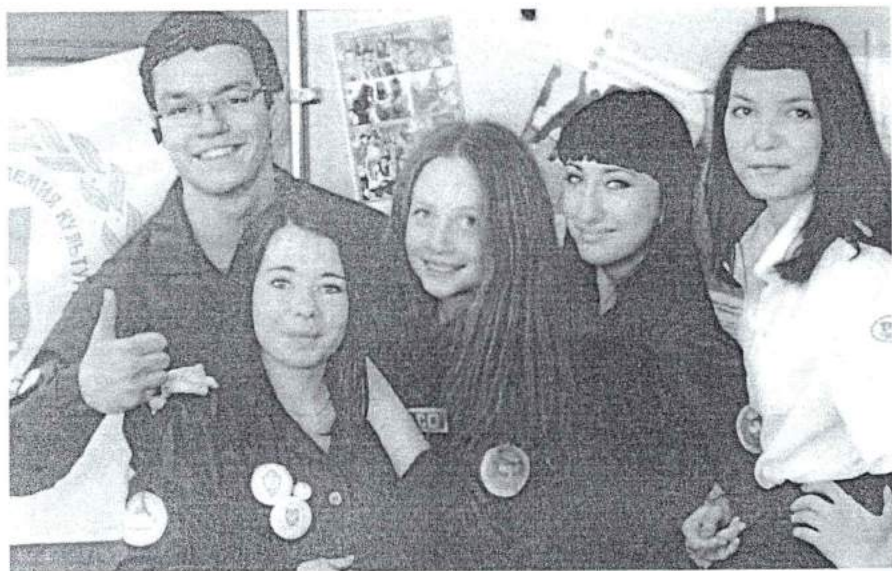
Июнь 2014 г. Студенческие отряды академии