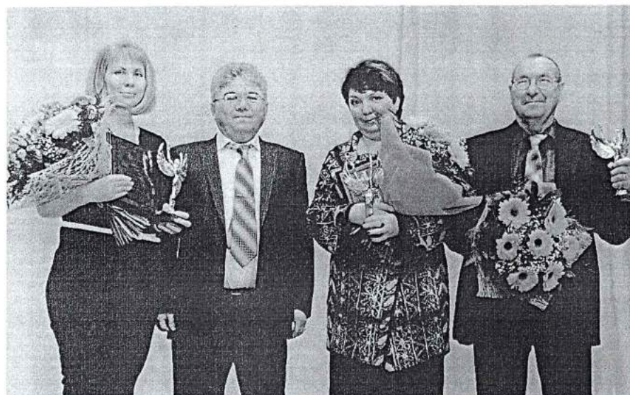
27 декабря 2013 г. Вручение премий «Легенда. Успех. Надежда»