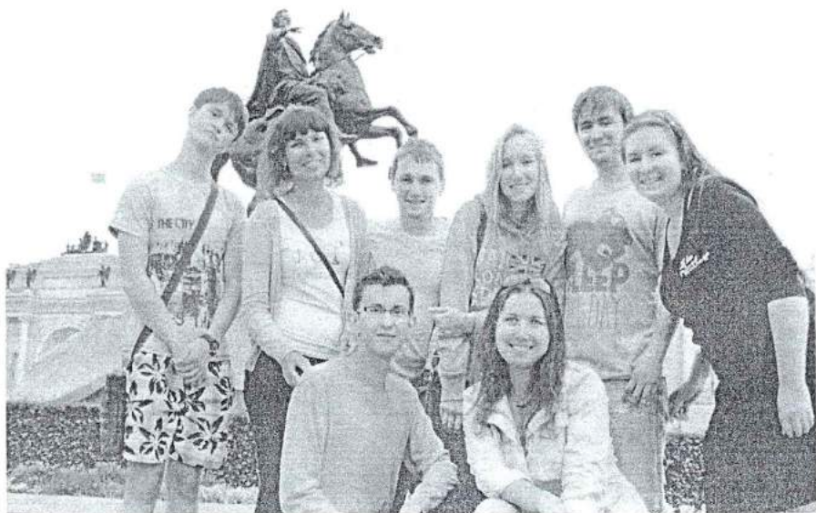
15–25 августа 2013 г. Поездка лучшей группы – 413 ПИ в г. Санкт-Петербург