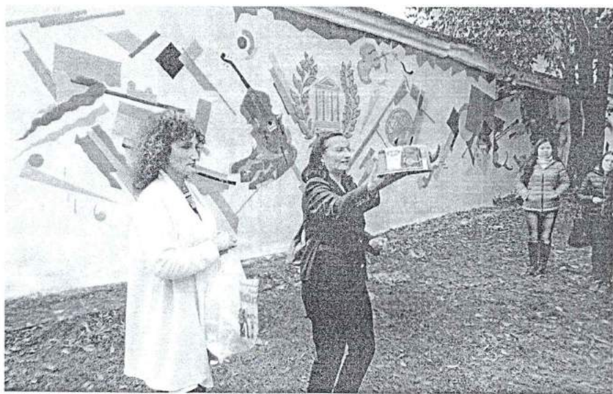
2 октября 2013 г. Торжественное открытие выставки работ студентов и преподавателей ФДПТ