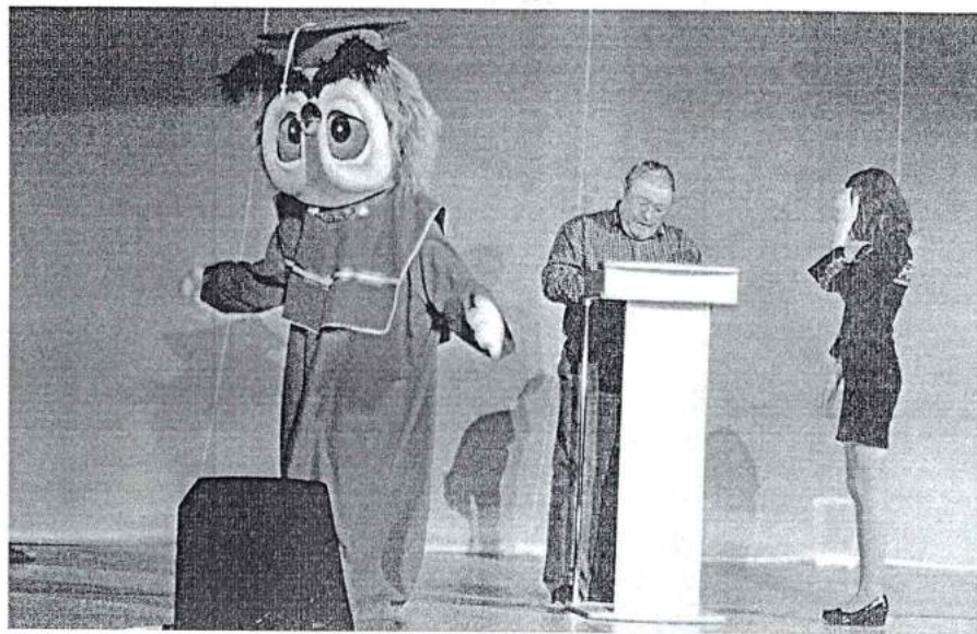
24 января 2014 г. День российского студенчества