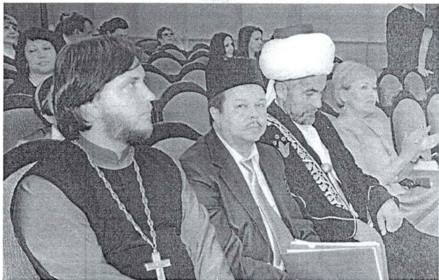
15–16 мая 2014 г. XII Славянский научный сбор «Урал. Православие. Культура»