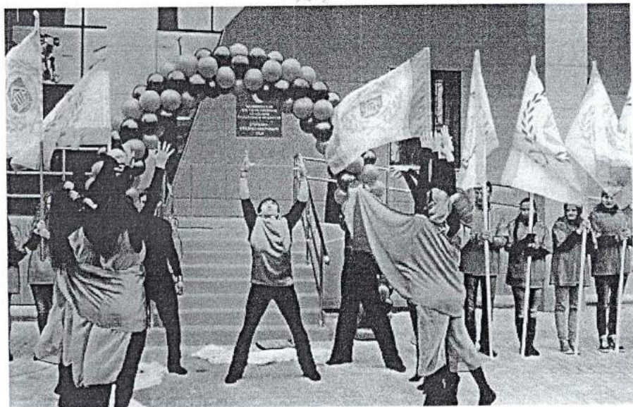
7 октября 2013 г. Открытие учебно-тренировочного комплекса