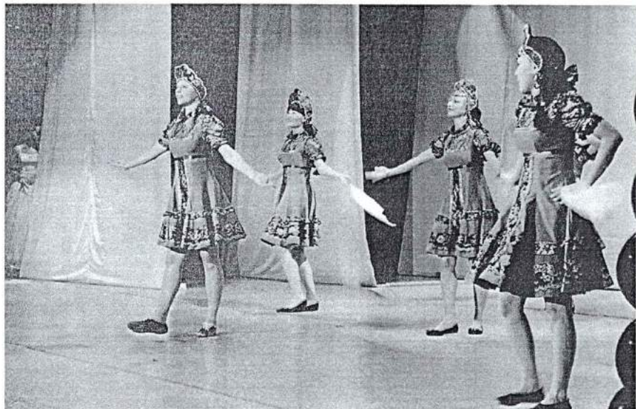
5 апреля 2014 г. XI Областной фестиваль сотворчества «Ты не один»