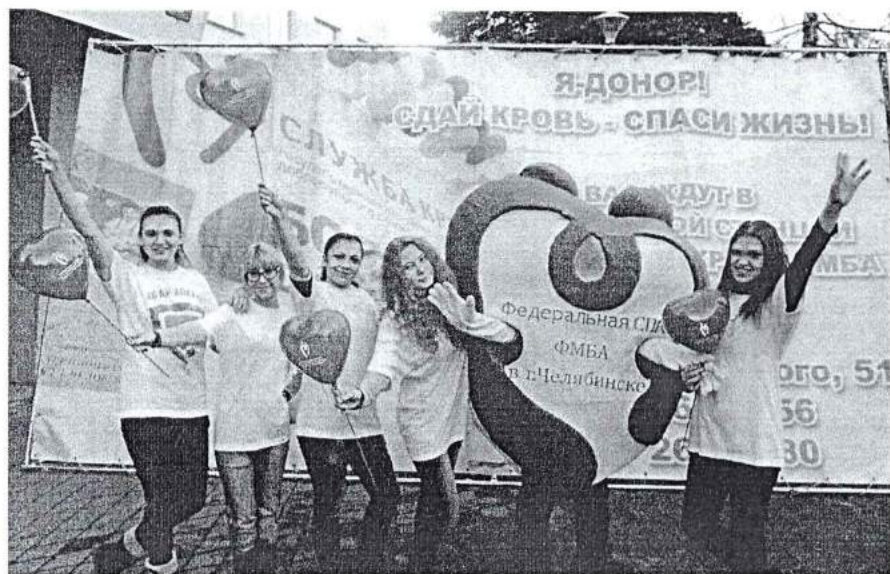
6 ноября 2013 г. День донора