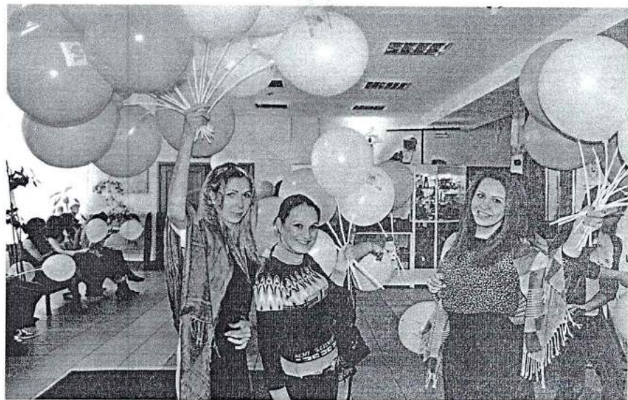
Апрель – май 2014 г. IV открытый городской молодёжный форум «Патриоты Челябинска – 2014»