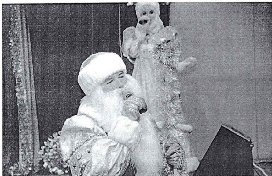
27 декабря 2013 г. Новогодний праздник «И пусть мечты сбываются!»