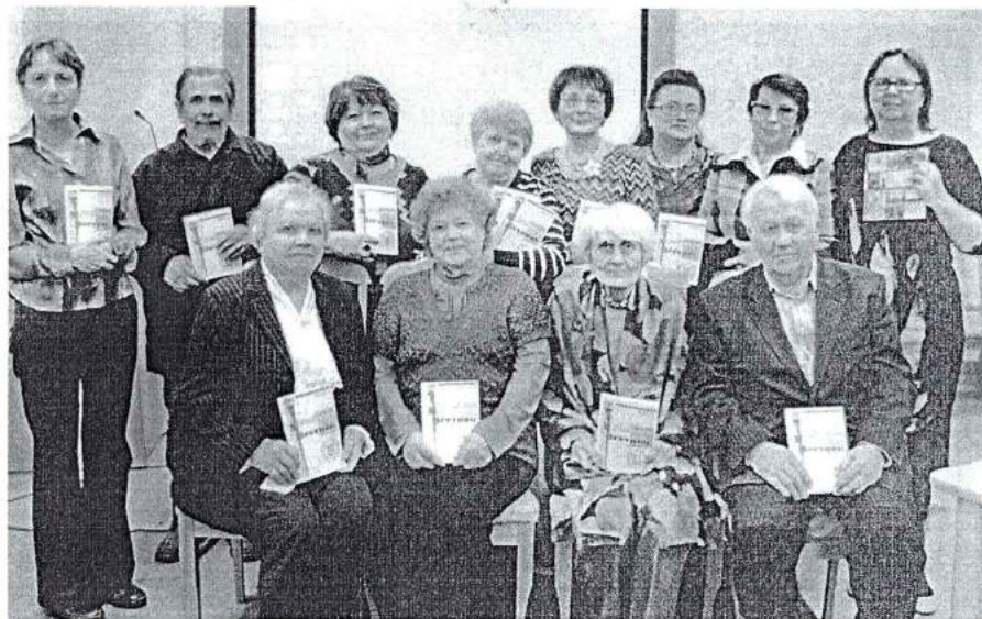
27 февраля 2014 г. Презентация «Музейного вестника»