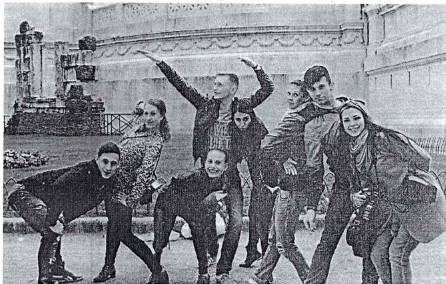
Март 2014 г. Международный молодежный фестиваль «Vivat, Roma» (г. Рим)