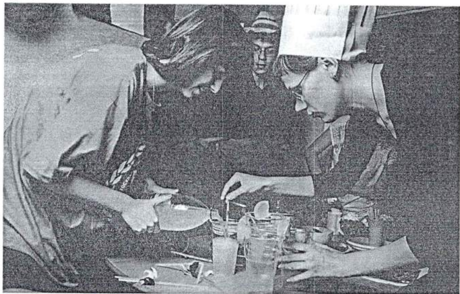
26 сентября 2013 г. Кулинарное шоу «Юбилейное меню»