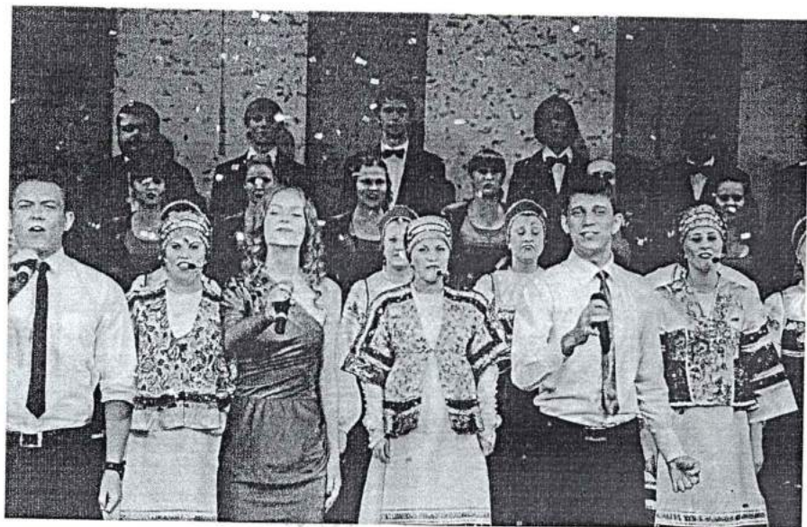
11 октября 2013 г. 45-летний юбилей академии