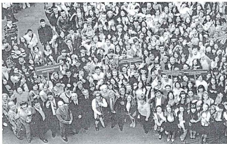
2 сентября 2013 г. Посвящение в студенты