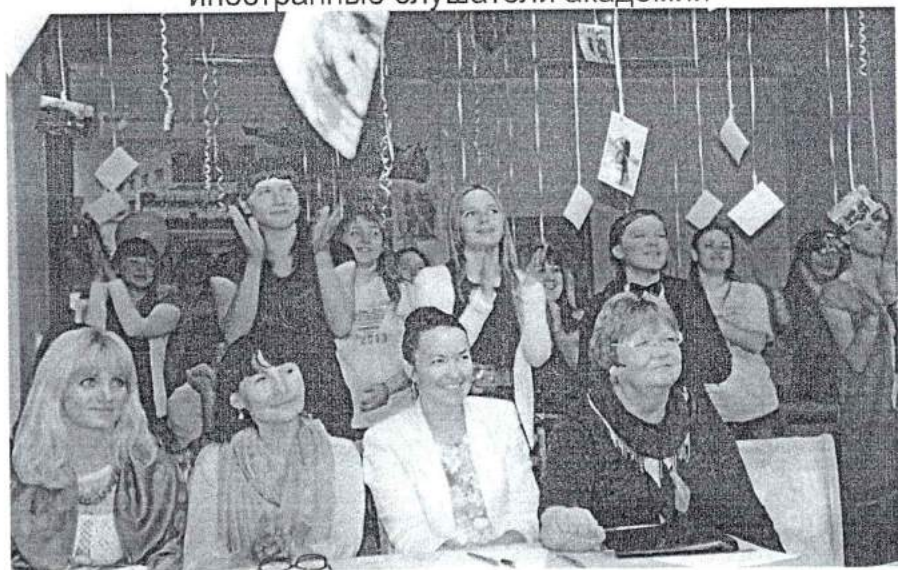
27 сентября 2013 г. Педагогическая олимпиада по итогам летней практики студентов кафедры СКД