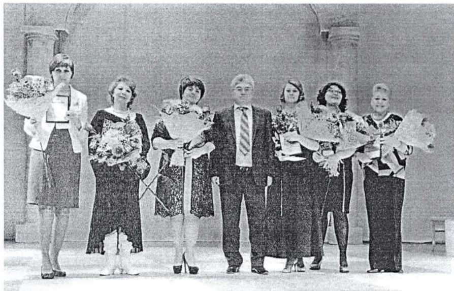
21 февраля 2014 г. Вручение премий им. П. В. Сапронова