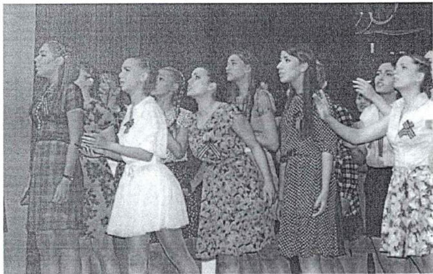
8 мая 2014 г. Праздничный концерт ко Дню Победы