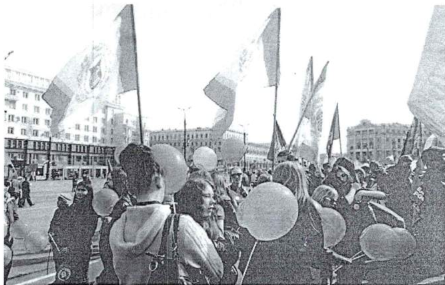
1 мая 2014 г. Торжественное шествие