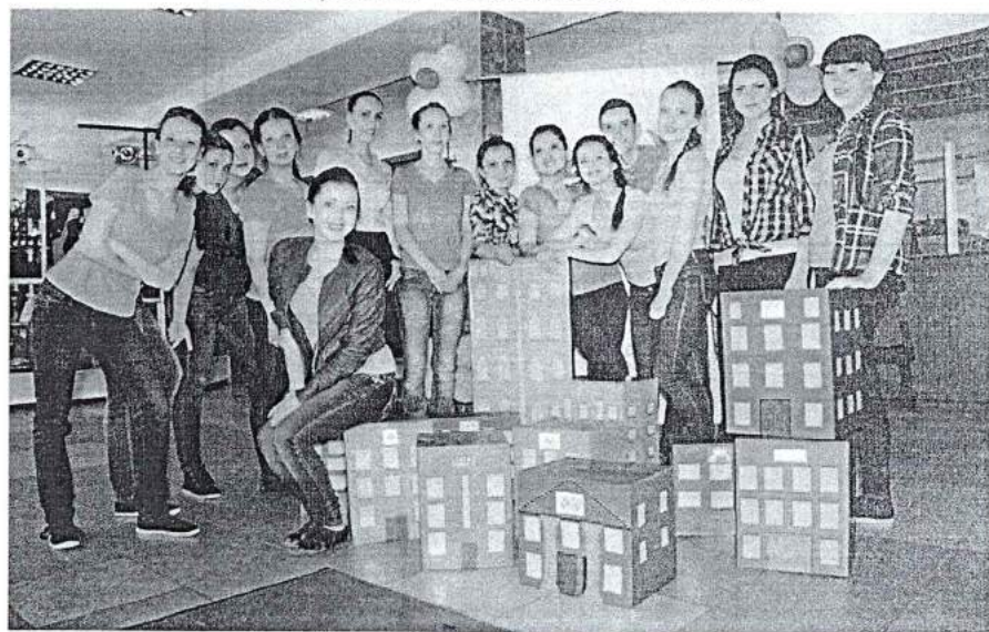
18 апреля 2014 г. III Всероссийский фестиваль-конкурс социально-культурных проектов студентов «Академия лета»