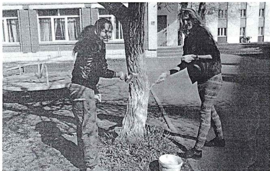
21 апреля 2014 г. Академический субботник