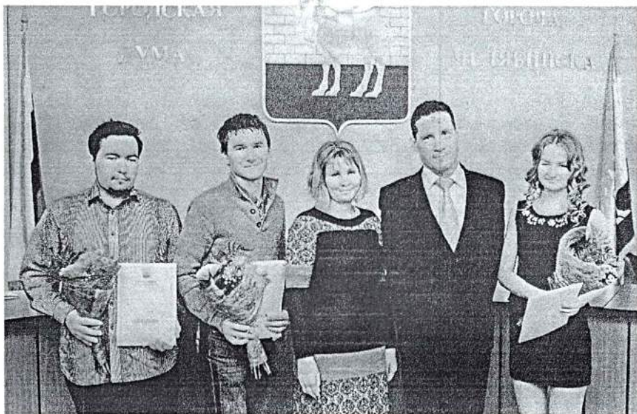
15 ноября 2013 г. Стипендиаты Администрации г. Челябинска