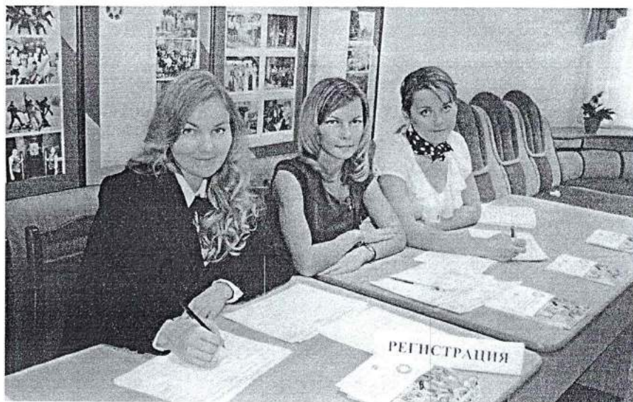
1–2 ноября 2013 г. XII Международный научно-творческий форум «Молодежь в науке и культуре XXI века»