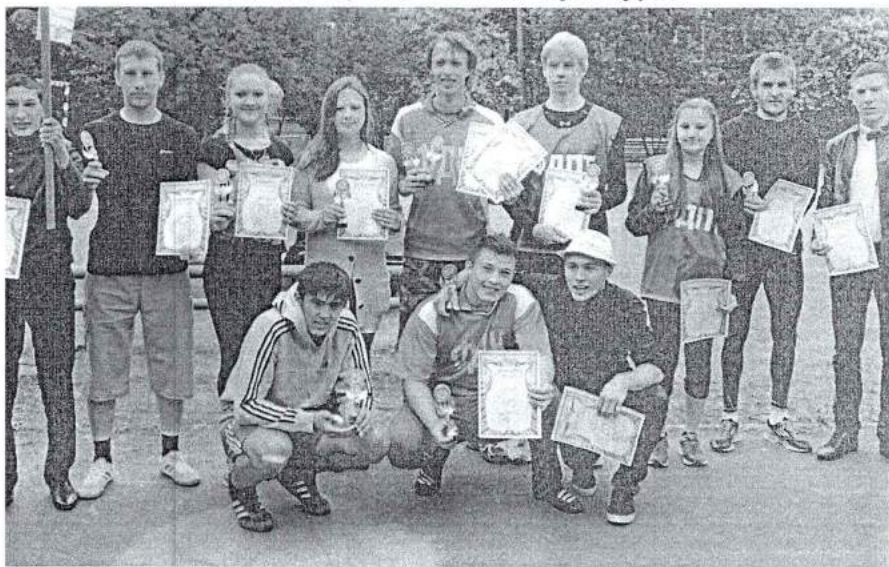
21 мая 2014 г. Закрытие межвузовской спартакиады