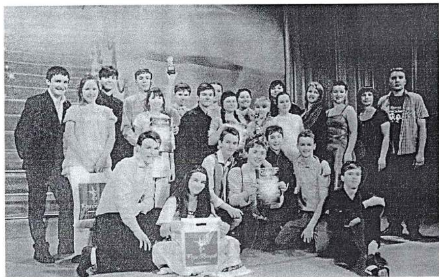
16–26 марта 2014 г. Международный фестиваль-конкурс детского и юношеского творчества «Роза ветров» в г. Сочи