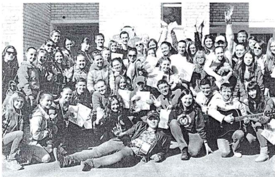
19–20 апреля 2014 г. Сборы студенческого актива академии