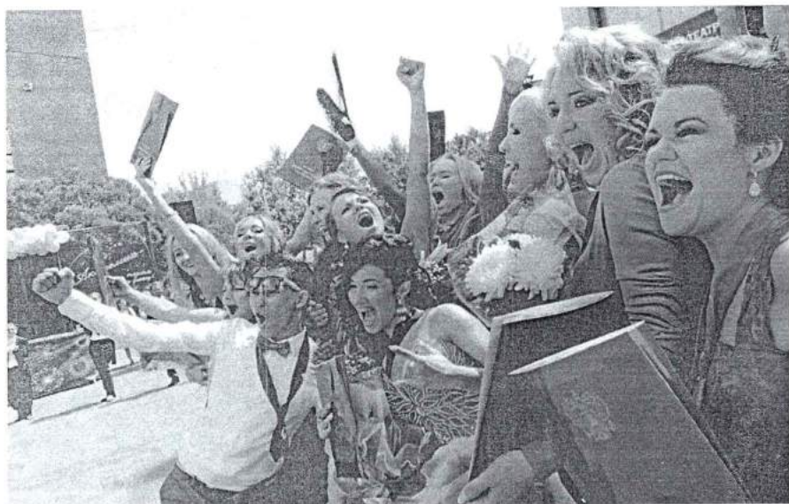
28 июня 2014 г. Церемония вручения дипломов «Будущее культуры России»