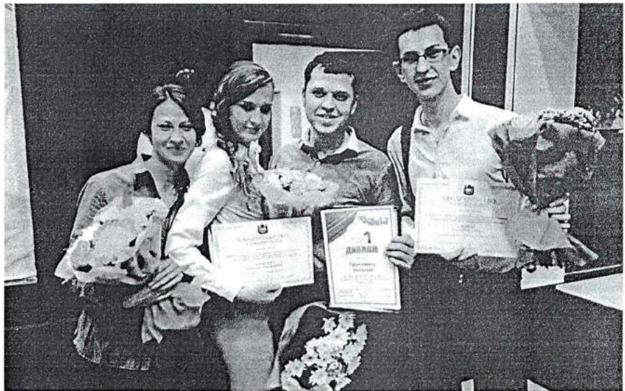
24 декабря 2013 г. Стипендиаты губернатора Челябинской области