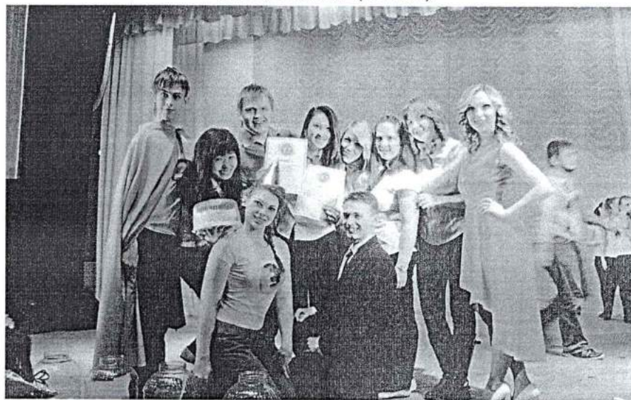
4 апреля 2014 г. Конкурс «Информационная капель»