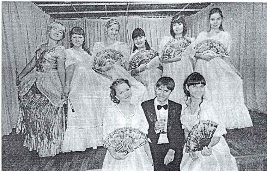
25 октября 2013 г. Презентация книги «Школьный праздник» в честь 400-летия дома Романовых