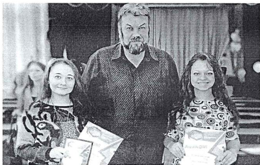
15 ноября 2013 г. Всероссийский конкурс социальной рекламы «Взгляд молодых – 2013»