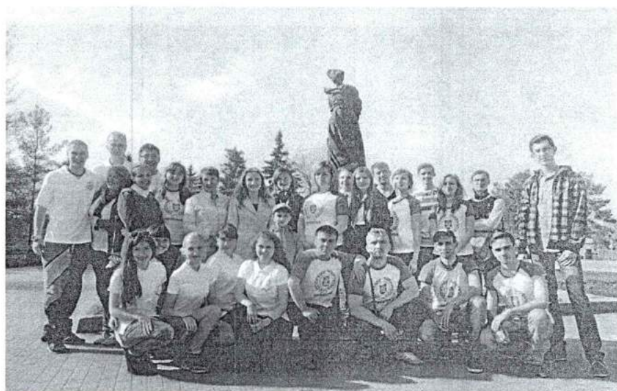
6 мая 2014 г. Отправление в ВДЦ «Артек», «Орленок», «Океан»