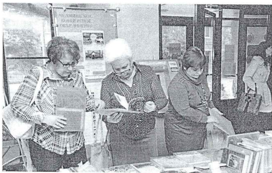
19–20 сентября 2013 г. II Международный интеллектуальный форум «Чтение на евразийском перекрестке»