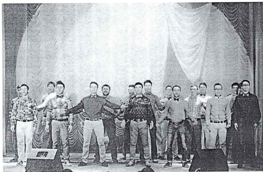
7 марта 2014 г. Праздник «Вы, как весна, прекрасны!»