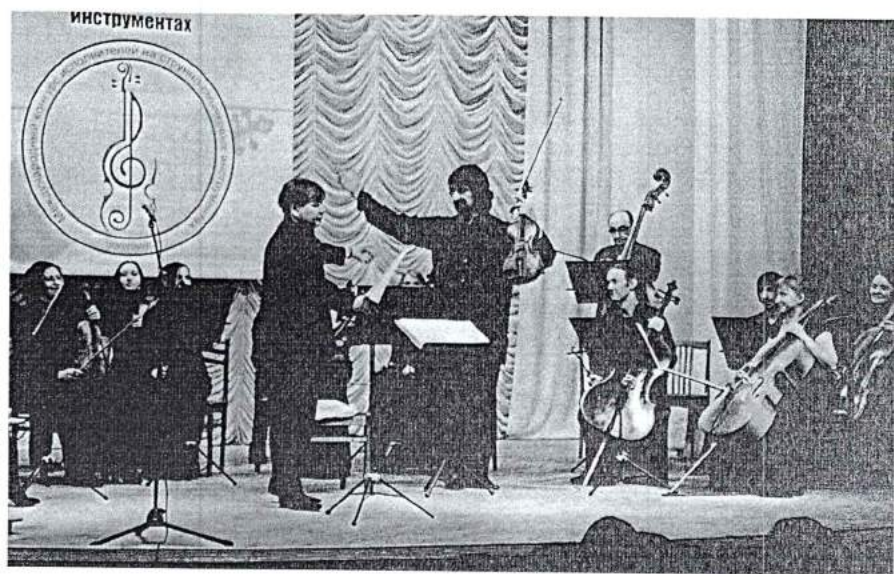
3–6 февраля I Международный конкурс исполнителей на струнно-смычковых инструментах