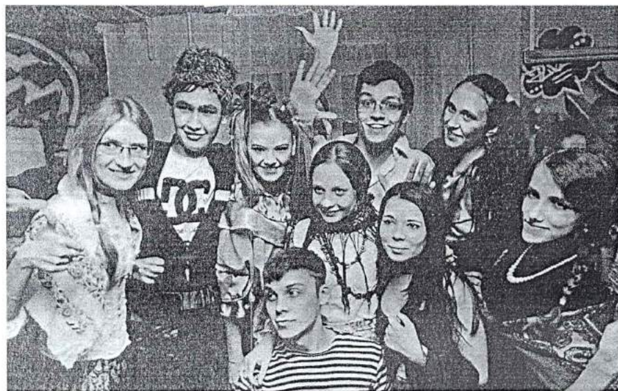
27 февраля 2014 г. Масленица в общежитии