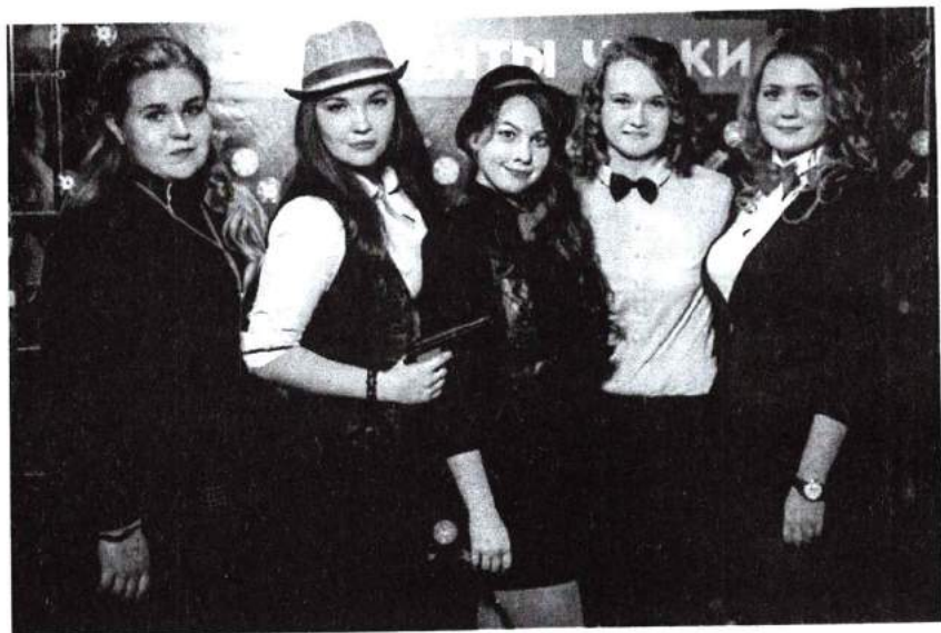
21 сентября 2015 г. Общевузовское посвящение в студенты «CHICAGO»