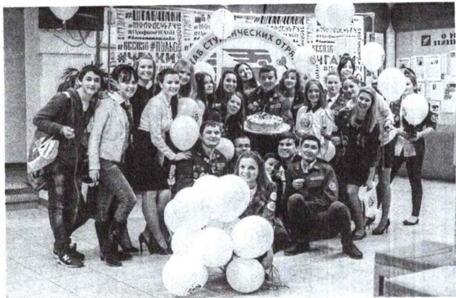
7–11 декабря 2015 г. Празднование 10-летия Штаба студенческих отрядов вуза