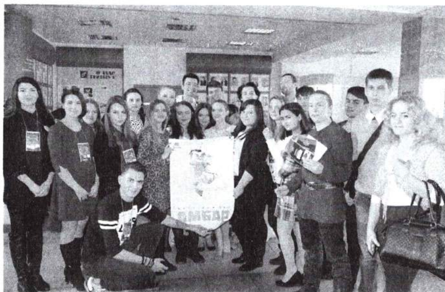
24 февраля 2016 г. «Защитники культуры» – праздничное мероприятие студенческого совета