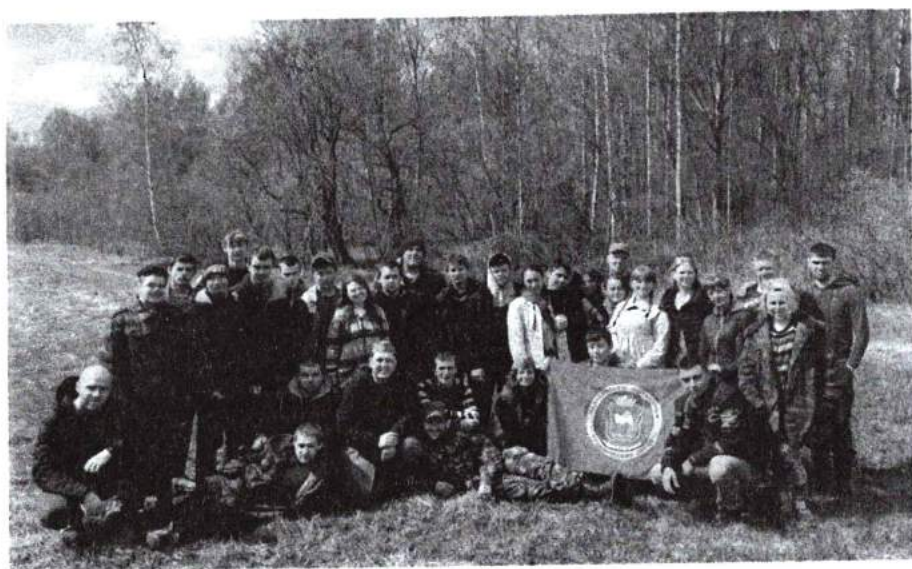
22–30 сентября 2015 г. Поисковый отряд «Звезда» принял участие в осенней поисковой вахте в Тверской области