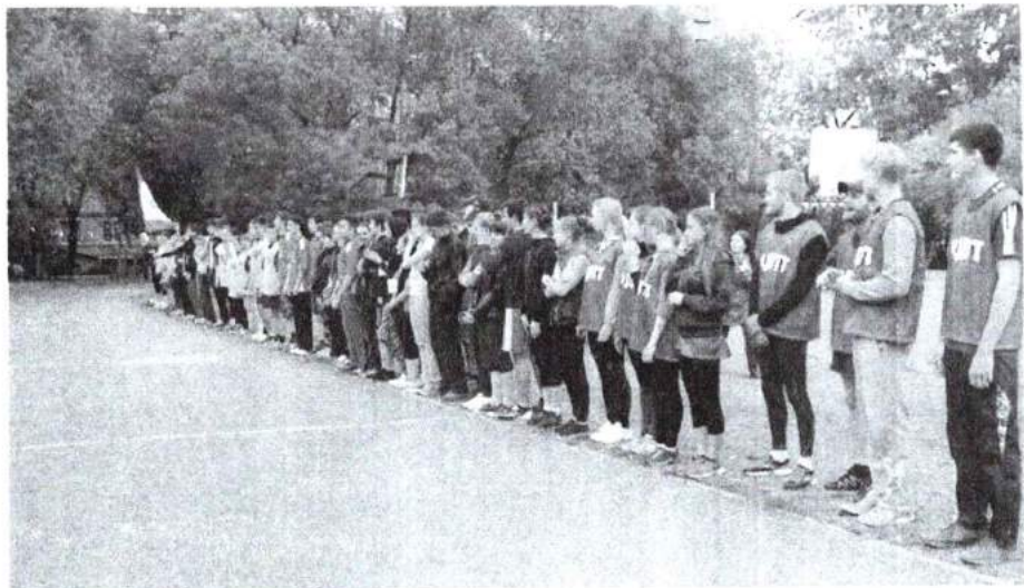
Апрель 2016 г. Кубок ректора по футболу