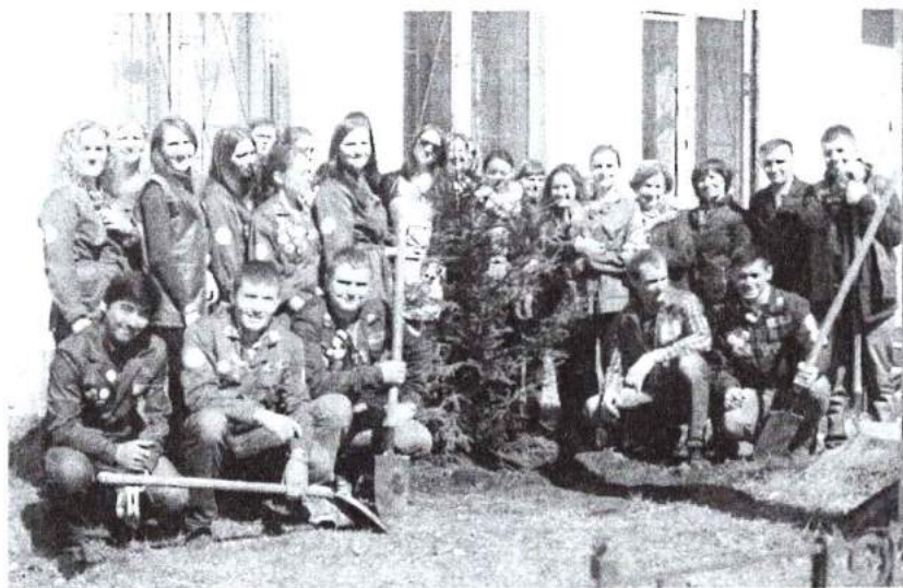
24 апреля 2016 г. Участие студентов ЧГИК во Всероссийской акции «Дерево Победы»