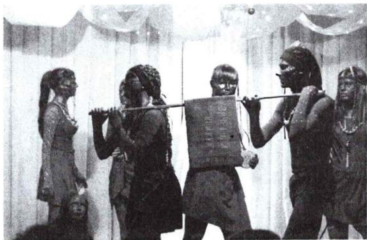
Сентябрь 2015 г. Посвящение в студенты первокурсников кафедры социально-культурной деятельности