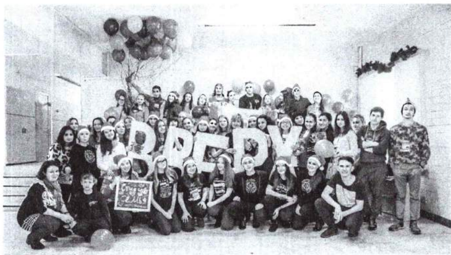
19–20 декабря 2015 г. Выездные учебно-методические сборы студенческого актива «Верх!»