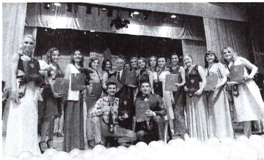
1 июля 2016 г. «Драгоценный выпуск» – торжественная церемония вручения дипломов выпускникам вуза