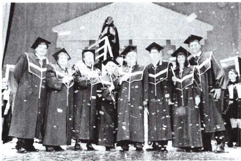
1 сентября 2015 г. Посвящение в студенты «Школа чародейства и волшебства»