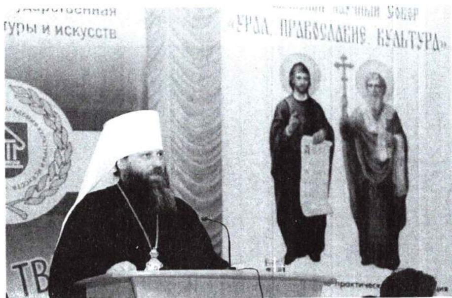
24–25 мая 2016 г. XIV Славянский научный сбор «Урал. Православие. Культура»