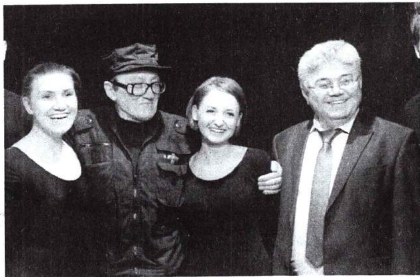
28 апреля 2016 г. Творческая встреча с российским и американским художником, скульптором, лауреатом Государственной премии России М. М. Шемякиным