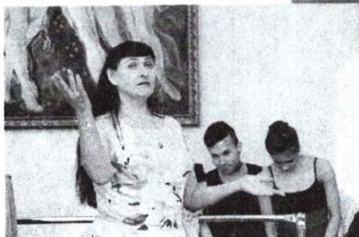
23–27 мая 2016 г. Курсы повышения квалификации под патронажем Министерства культуры РФ «Адаптация современного танца в среду хореографического искусства»