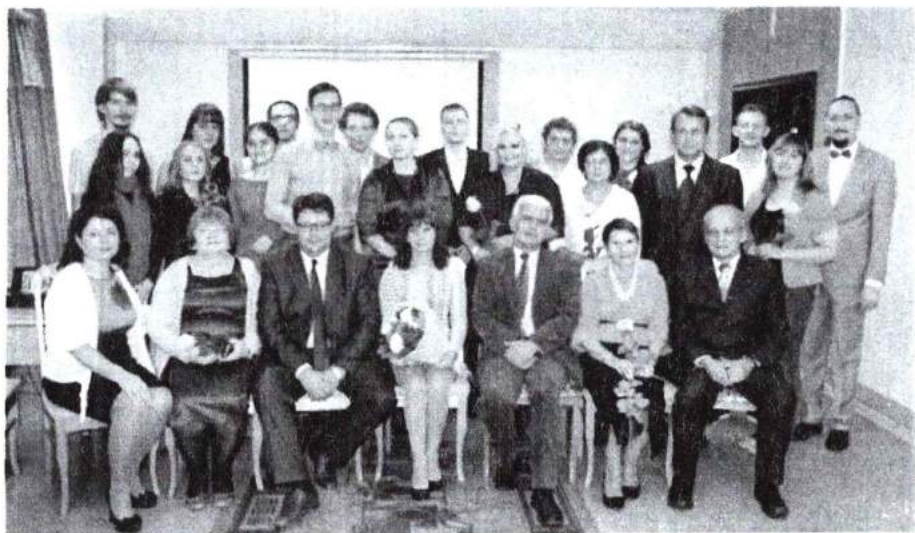
6 ноября 2015 г. Посвящение в аспиранты «Что? Где? Когда»