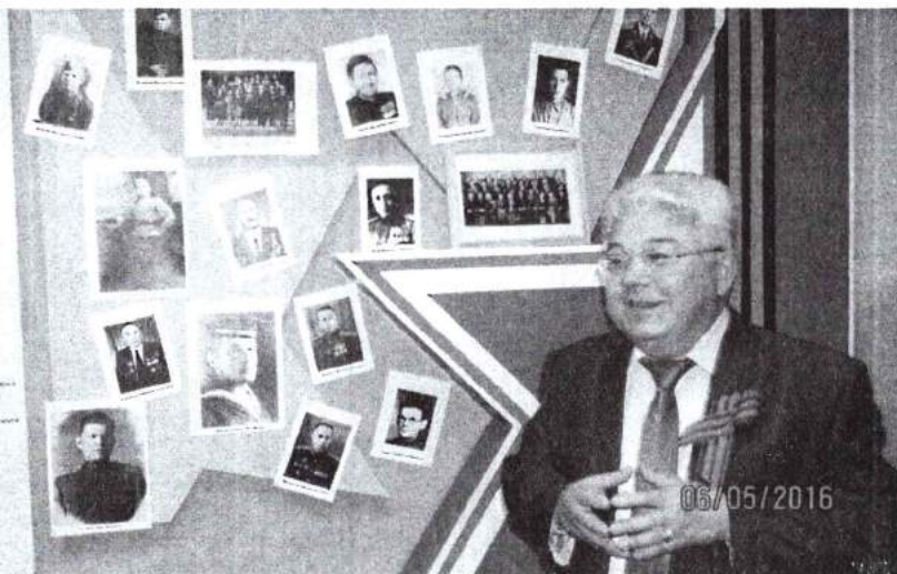
6 мая 2016 г. Открытие мемориала в стенах вуза «Они сражались за Родину», посвященного преподавателям и сотрудникам вуза – участникам Великой Отечественной войны