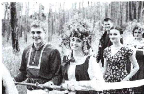
11 июня 2016 г. Вожделение стрелы – традиционный народный праздник