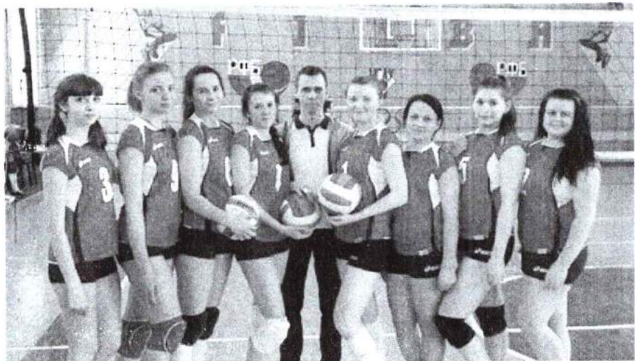
Март 2016 г. Первенство среди вузов г. Челябинска в рамках межвузовской спартакиады «Буревестник» по волейболу Девушки – I место. Юноши – II место