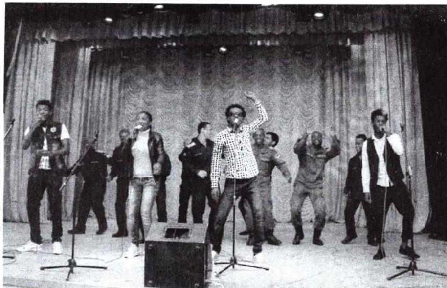
1 июня 2016 г. I Межвузовский фестиваль иностраннных студентов г. Челябинска