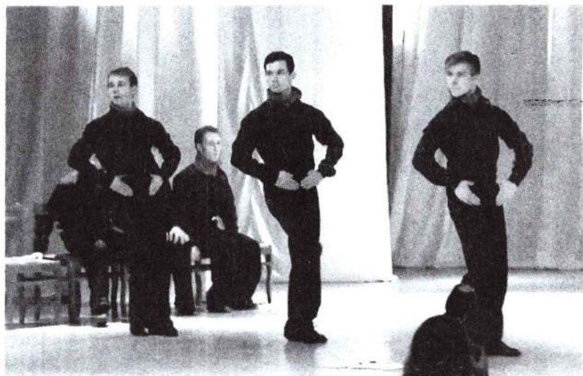
5 октября 2015 г. «Мужской Dance Club поздравляет» – праздничный концерт студентов и преподавателей хореографического факультета, посвященный Дню учителя