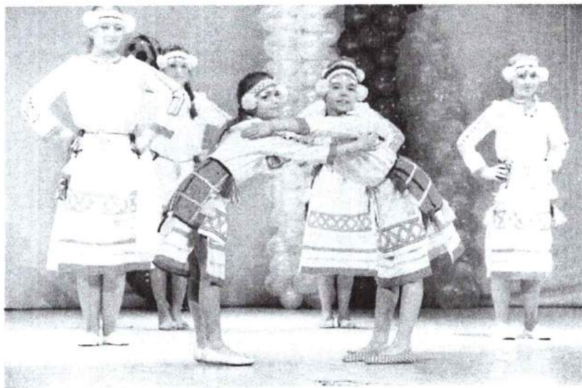
9 апреля 2016 г. Проведение XIII Областного фестиваля сотворчества «Ты не один!» – «Культур много, а Россия одна»