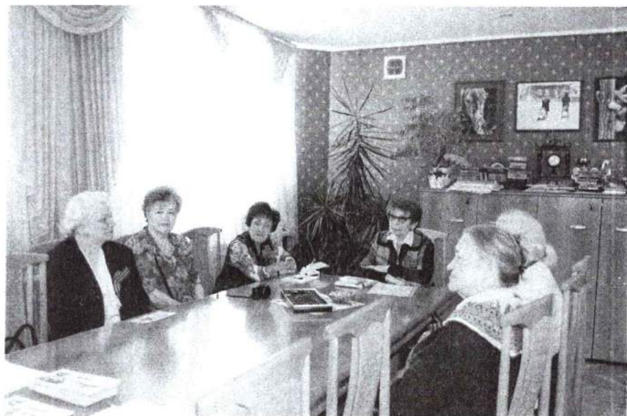
6 мая 2016 г. Торжественный прием у ректора ветеранов института