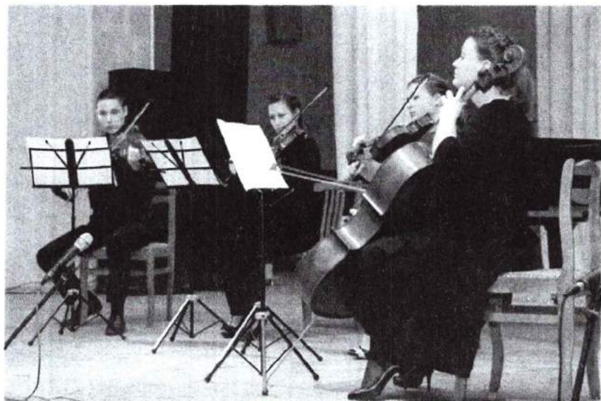
1 октября 2015 г. Международный день музыки