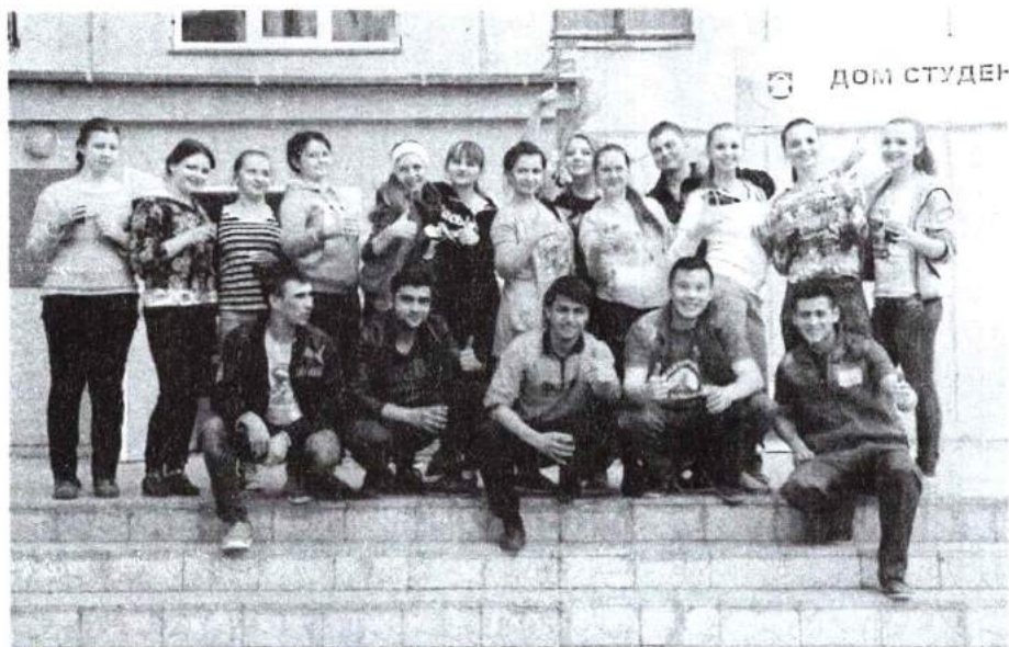
14–16 апреля 2016 г. Субботник в доме студентов и на территории ЧГИК