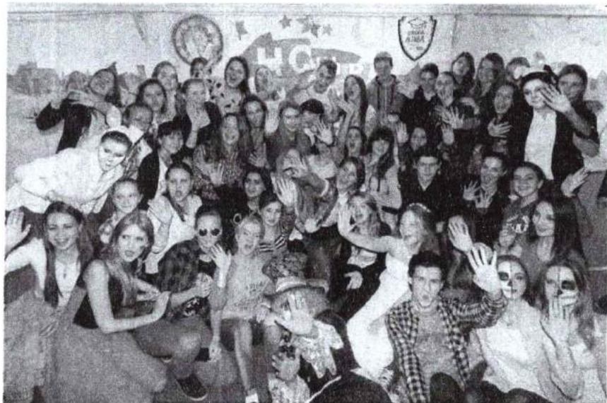
17–18 октября 2015 г. Ночь студенческого совета в Центре досуга студентов