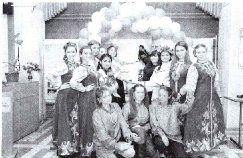
27 октября 2015 г. Ярмарка студенческого совета культурологического факультета «Начало пути»