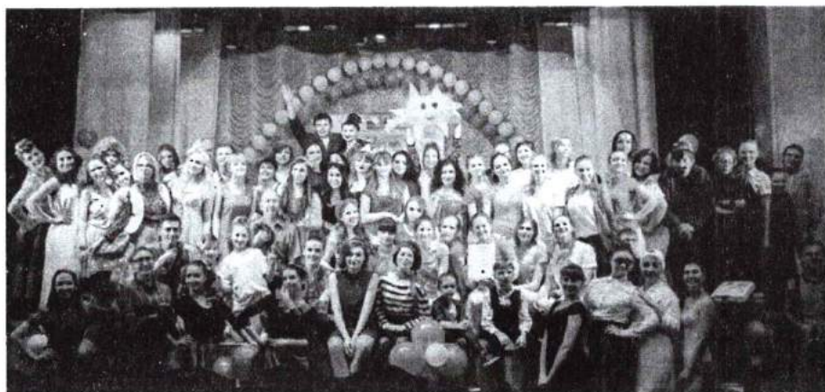
21 апреля 2016 г. V Всероссийский фестиваль-конкурс социально-культурных проектов студентов «Академия лета»