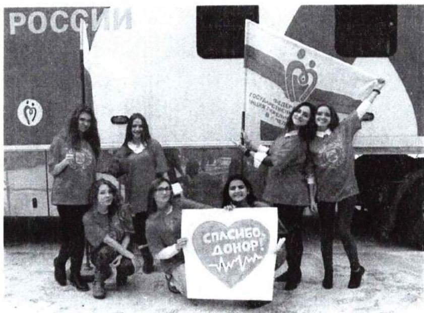
11 ноября 2015 г. День донора