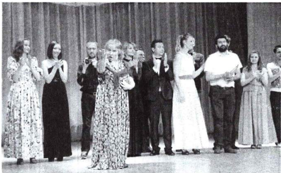
27 июня 2016 г. Театральное событие «Искусство созерцания», посвященное юбилею профессора Е. В. Калужских