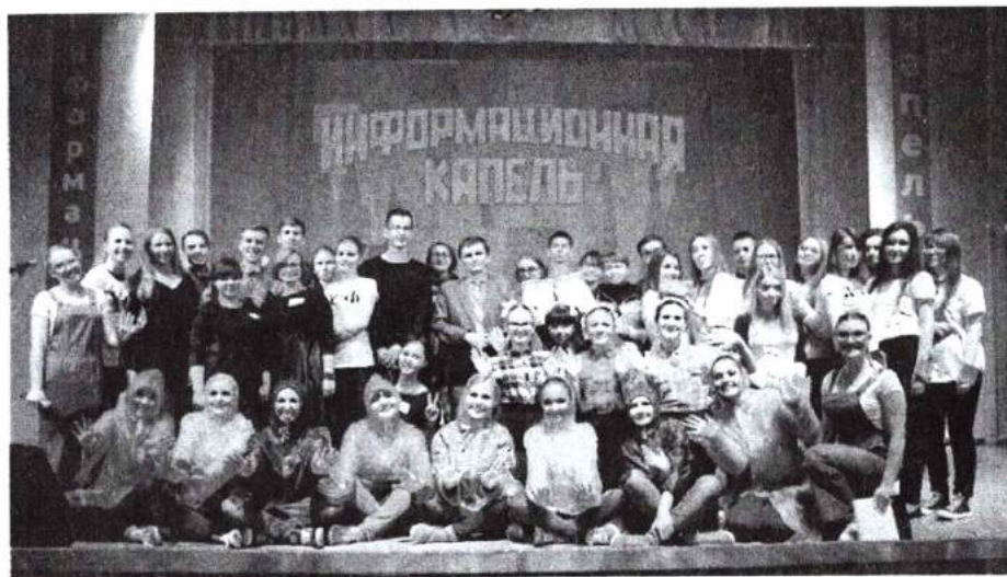
14 апреля 2016 г. Интеллектуально-творческое шоу «Информационная капель»