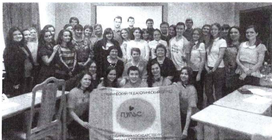
18 декабря 2016 г. IX Студенческая психолого-педагогическая олимпиада, посвященная 85-летию со дня рождения Ш. А. Амонашвили