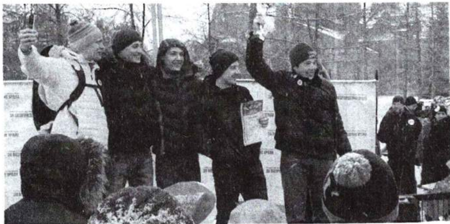
28 февраля 2016 г. Поисковый отряд «Звезда» стал победителем в спортивном турнире «Горячий снег»