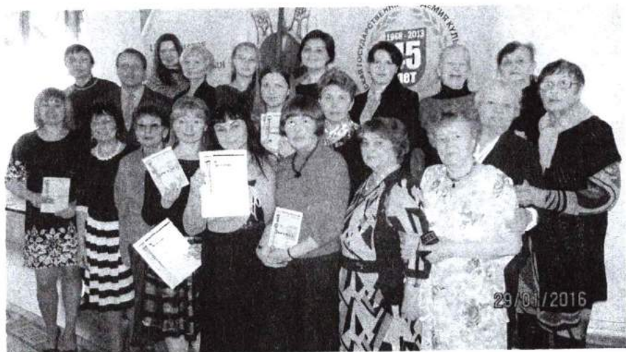
29 января 2016 г. Празднование 10-летия «Музейного вестника»