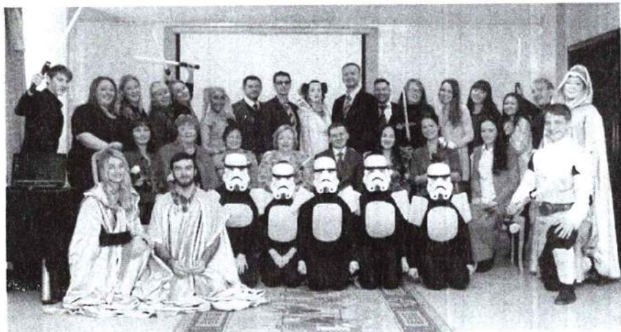
7 октября 2015 г. Посвящение в магистранты