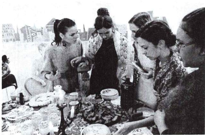
18 ноября 2015 г. Кулинарное шоу «Плита». Организатор – студенческий совет общештудия