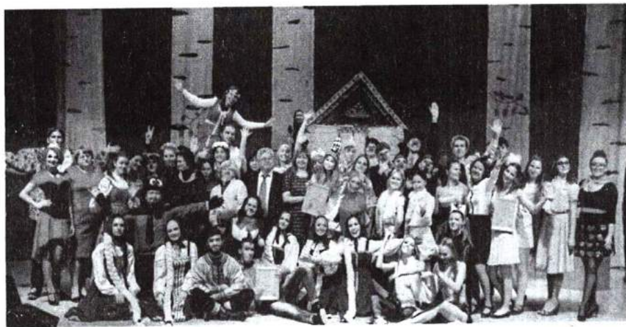
9 декабря 2015 г. Интеллектуальная игра «В некотором царстве, в Академ-государстве»