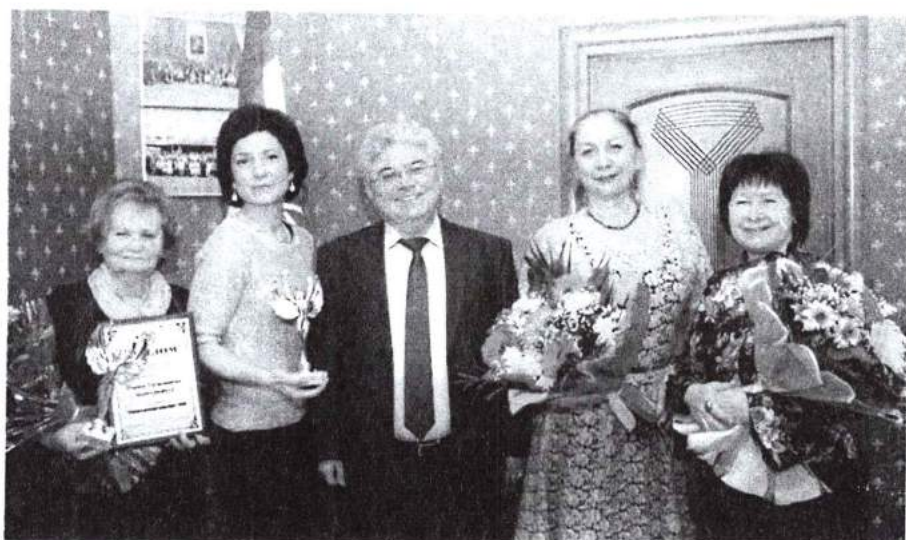
19 февраля 2016 г. XII Церемония вручения премий им. П. В. Сапронова