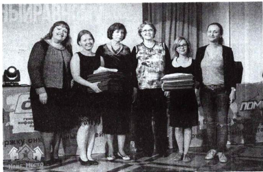
11–13 марта 2016 г. Молодежные деловые игры «Человеку нужен человек» в рамках инклюзивного проекта «Равный равному»