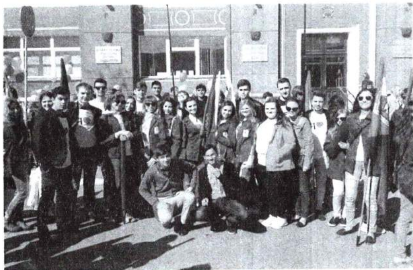
1 мая 2016 г. Участие делегации вуза в праздничной демонстрации