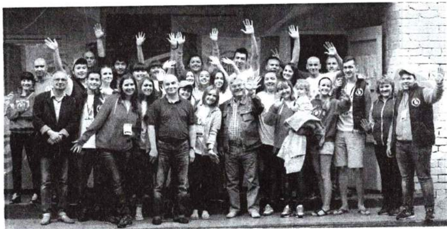
25–30 июня 2015 г. Второй летний студенческий форум «Академия – путь к твоему успеху!»