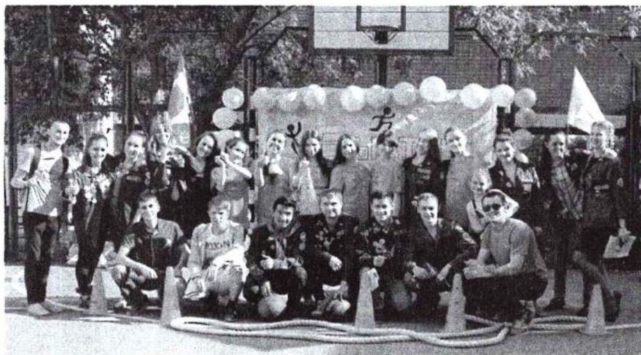
2 июня 2016 г. Спортивное открытие третьего трудового семестра