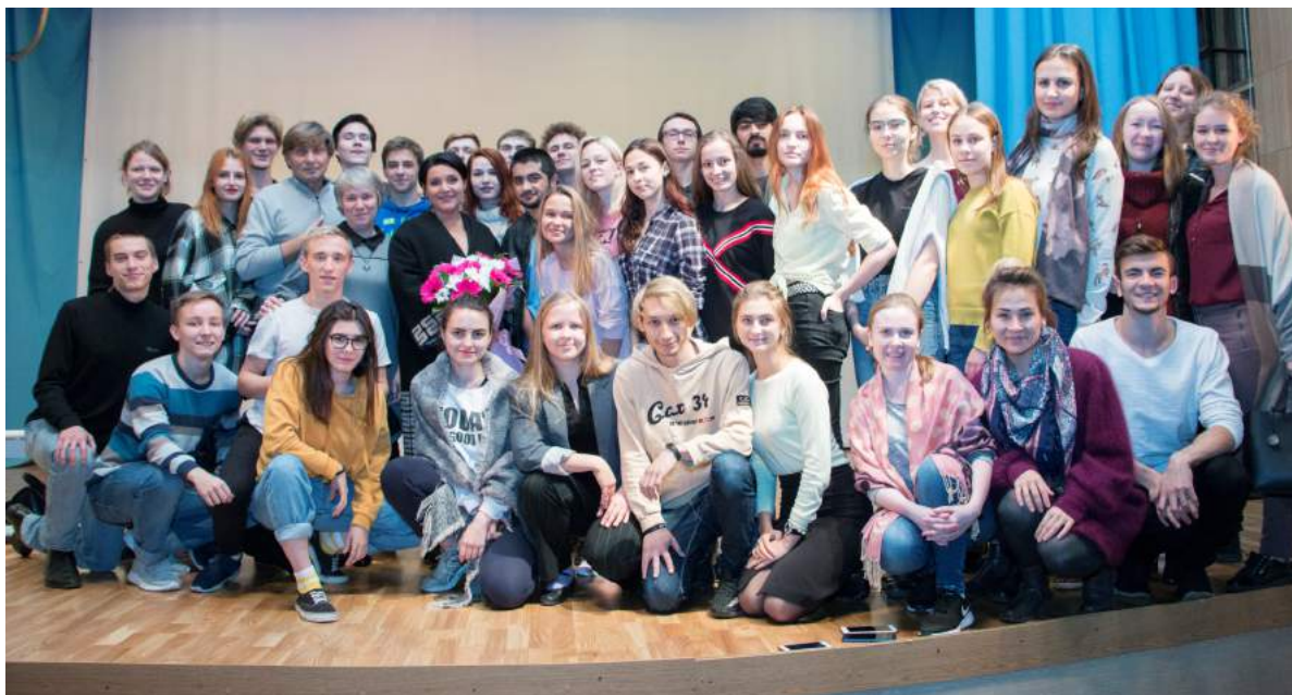
Творческая встреча с актрисой Ингой Оболдиной – выпускницей ЧГИК, заслуженной артисткой РФ 6 октября 2018 г.