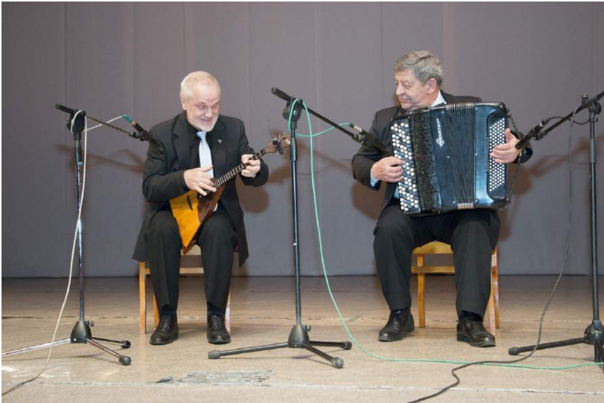
Фестиваль «Баянные и аккордеонные вечера» 1–4 ноября 2018 г.