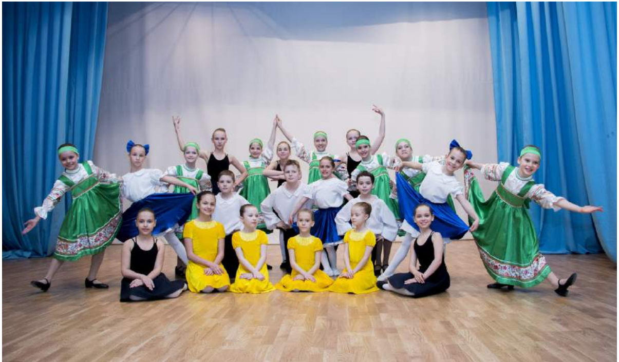
Отчетный концерт ДШИ ЧГИК 24 апреля 2019 г.