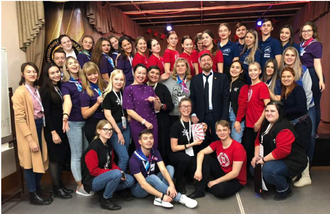
Студенческий форум образовательных организаций культуры и искусств «Творческая коллаборация» 9–11 ноября 2018 г.