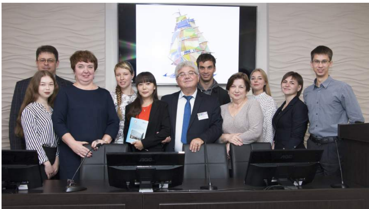
Коллектив авторов библиографического указателя «Труды Челябинского государственного института культуры: 2013–2017 гг.» 20 сентября 2018 г.