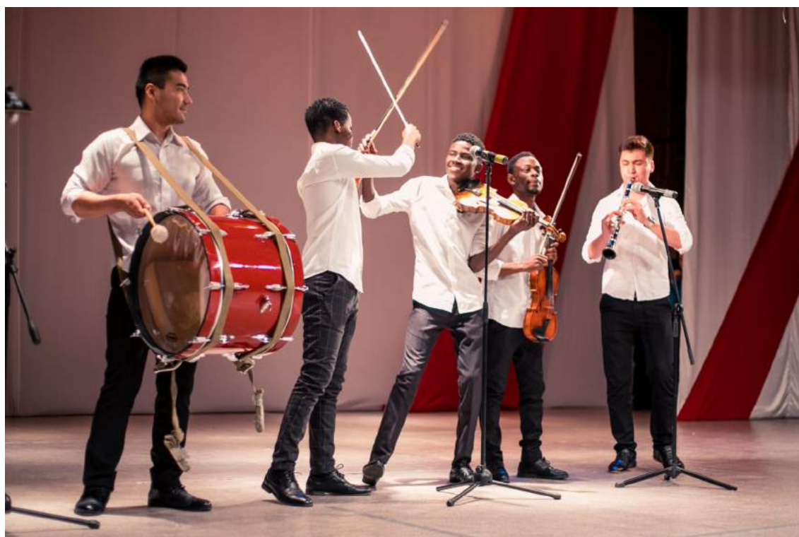
Праздничный концерт, посвященный Дню работника культуры «Культура: время вызовов» 25 марта 2019 г.