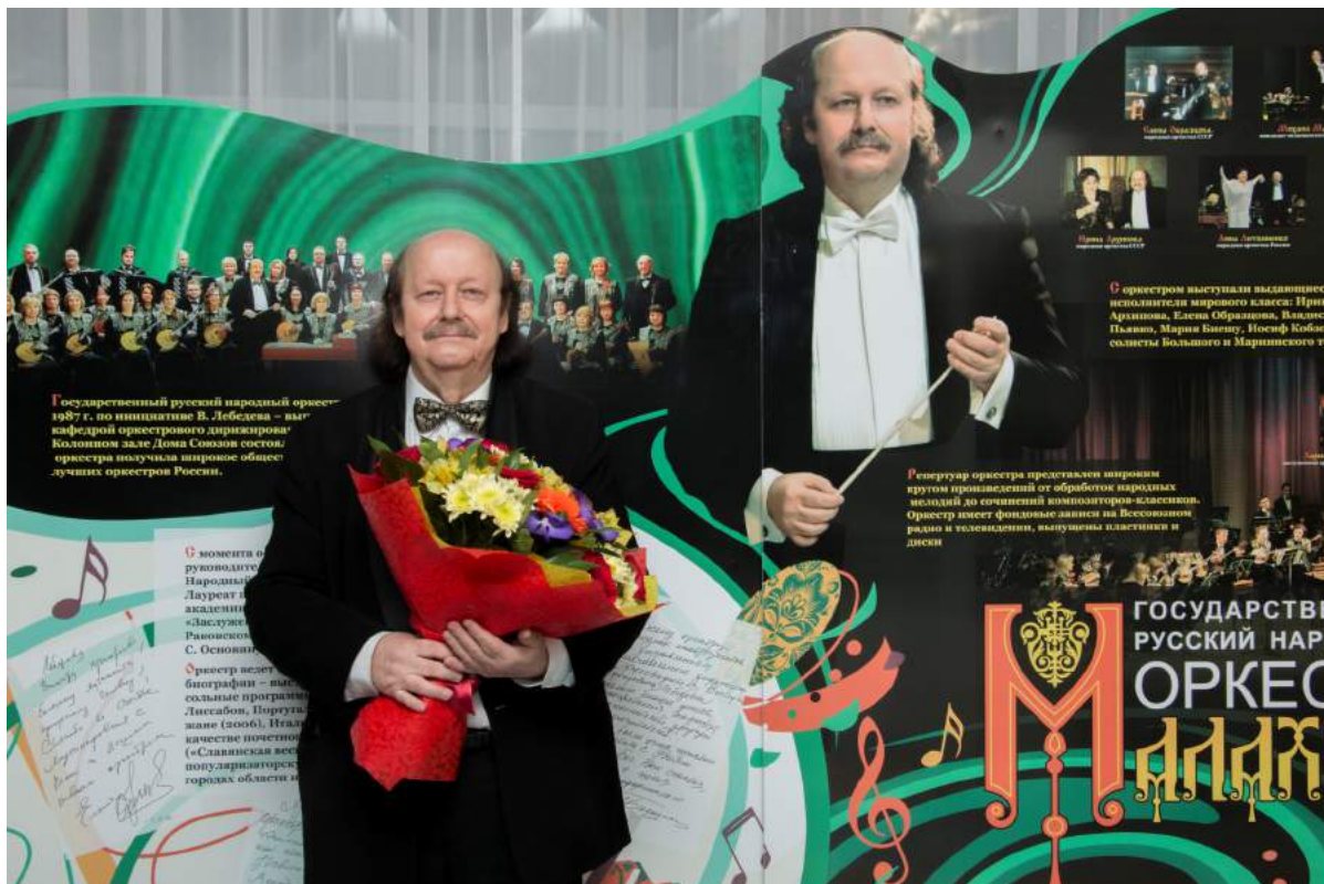
Открытие памятного стенда, посвященного Государственному русскому народному оркестру «Малахит» 18 января 2019 г.