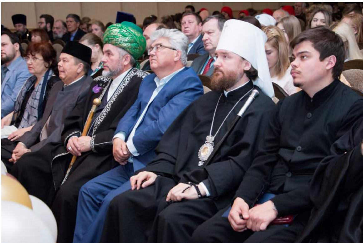
XVII Славянский научный сбор «Урал. Православие. Культура» 16–17 мая 2019 г.