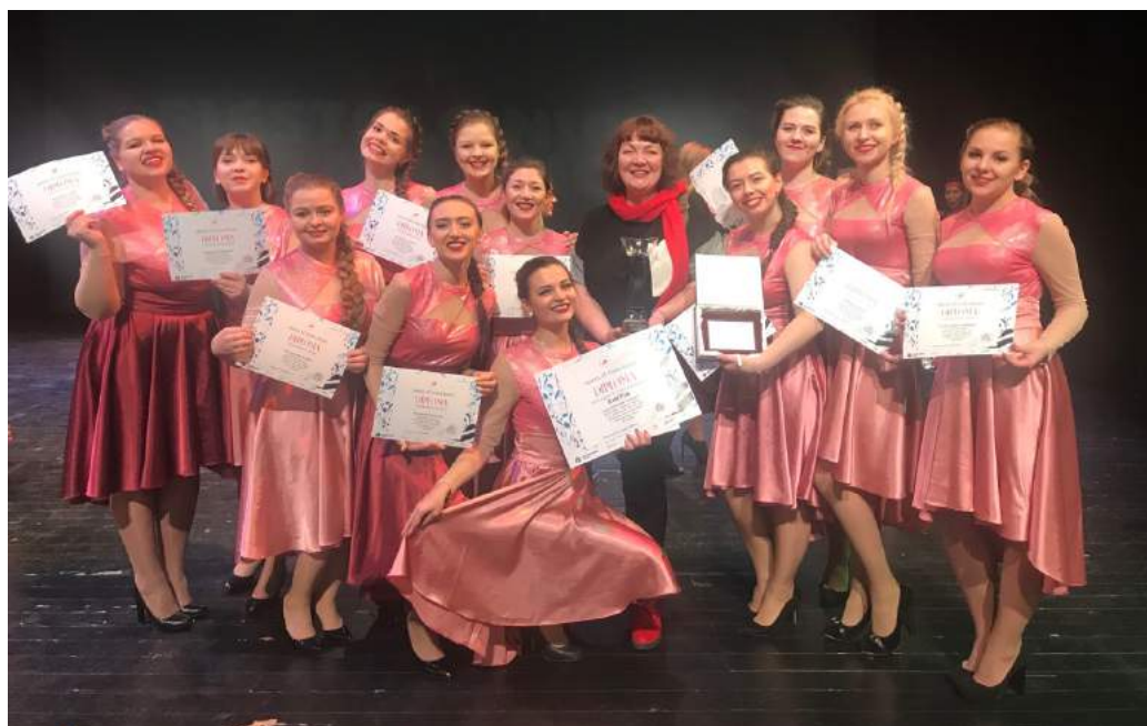
Гран-при Международного конкурса «Голоса Коста Бравы» (Испания) получил вокальный ансамбль «Субтон» 2–5 декабря 2018 г.