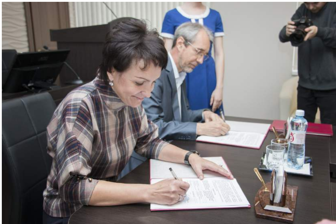
Подписание договора о сотрудничестве между Челябинским государственным институтом культуры и Магнитогорской государственной консерваторией 6 ноября 2018 г.