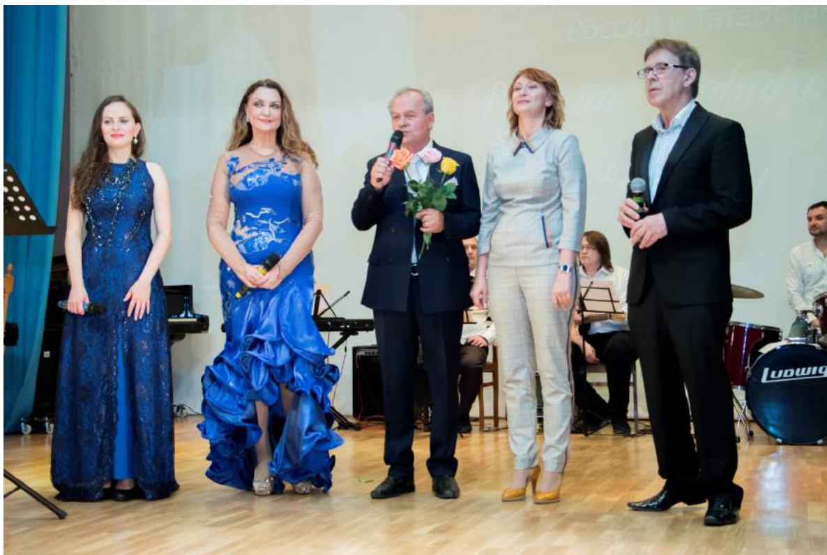
Юбилейный вечер заслуженного деятеля искусств России и Татарстана, профессора Р. Г. Хабибулина 14 сентября 2018 г.