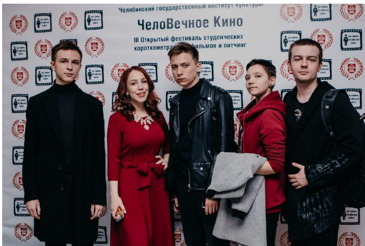
III Международный фестиваль короткометражных фильмов «Человечное кино» 1–4 апреля 2019 г.