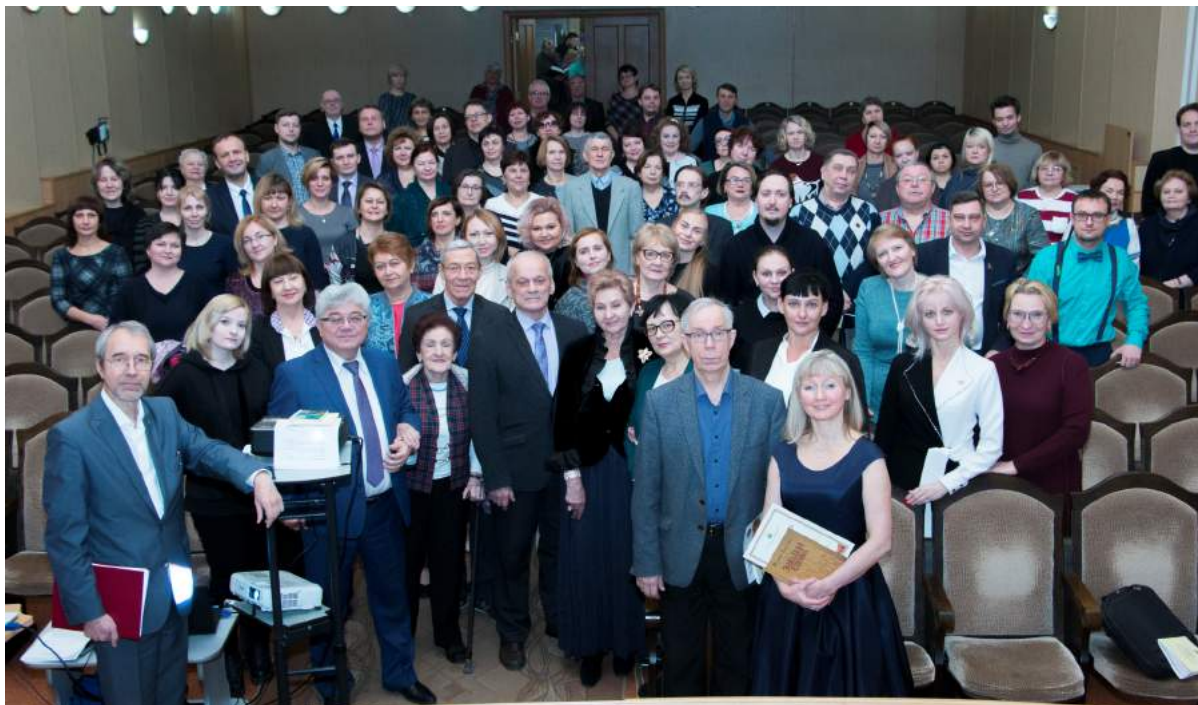
Презентация книги В. С. Толстикова «Челябинский государственный институт культуры. 50 лет. Страницы истории», посвященной золотому юбилею вуза 3 февраля 2019 г.