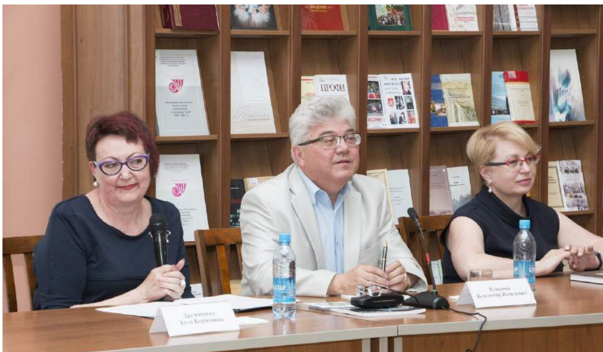
Презентация книги В. Я. Рушанина «Мария Васильевна Каменская. Школьная мама» Челябинская областная универсальная научная библиотека, 29 мая 2019 г.