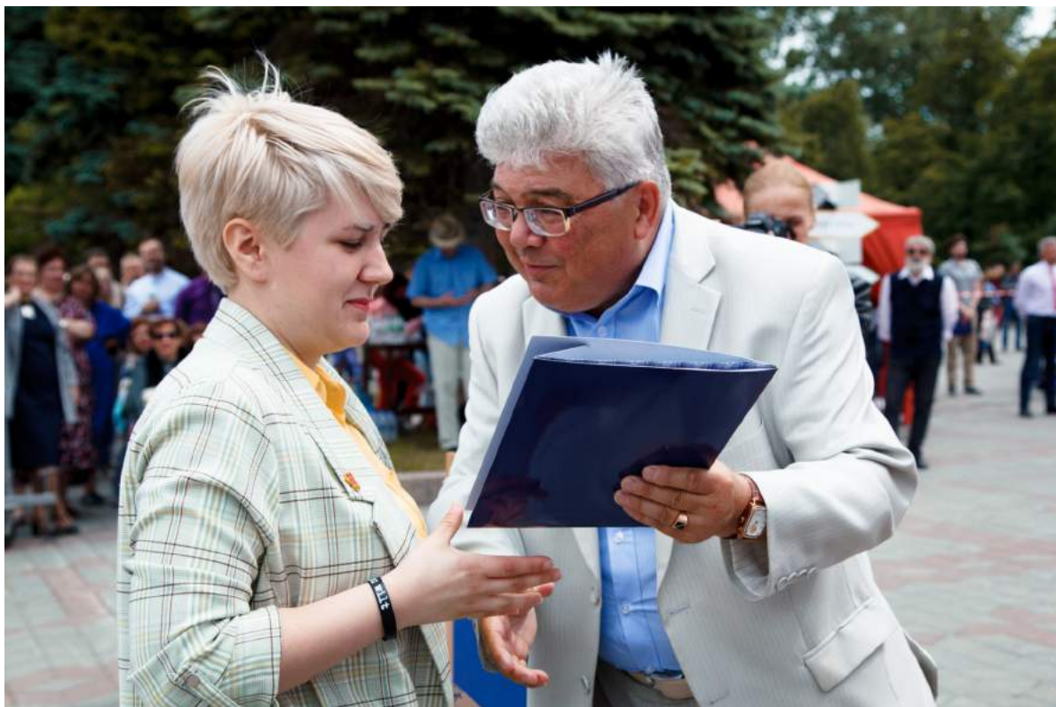
Церемония вручения дипломов выпускникам дневного отделения ЧГИК на Театральной площади 29 июня 2019 г.