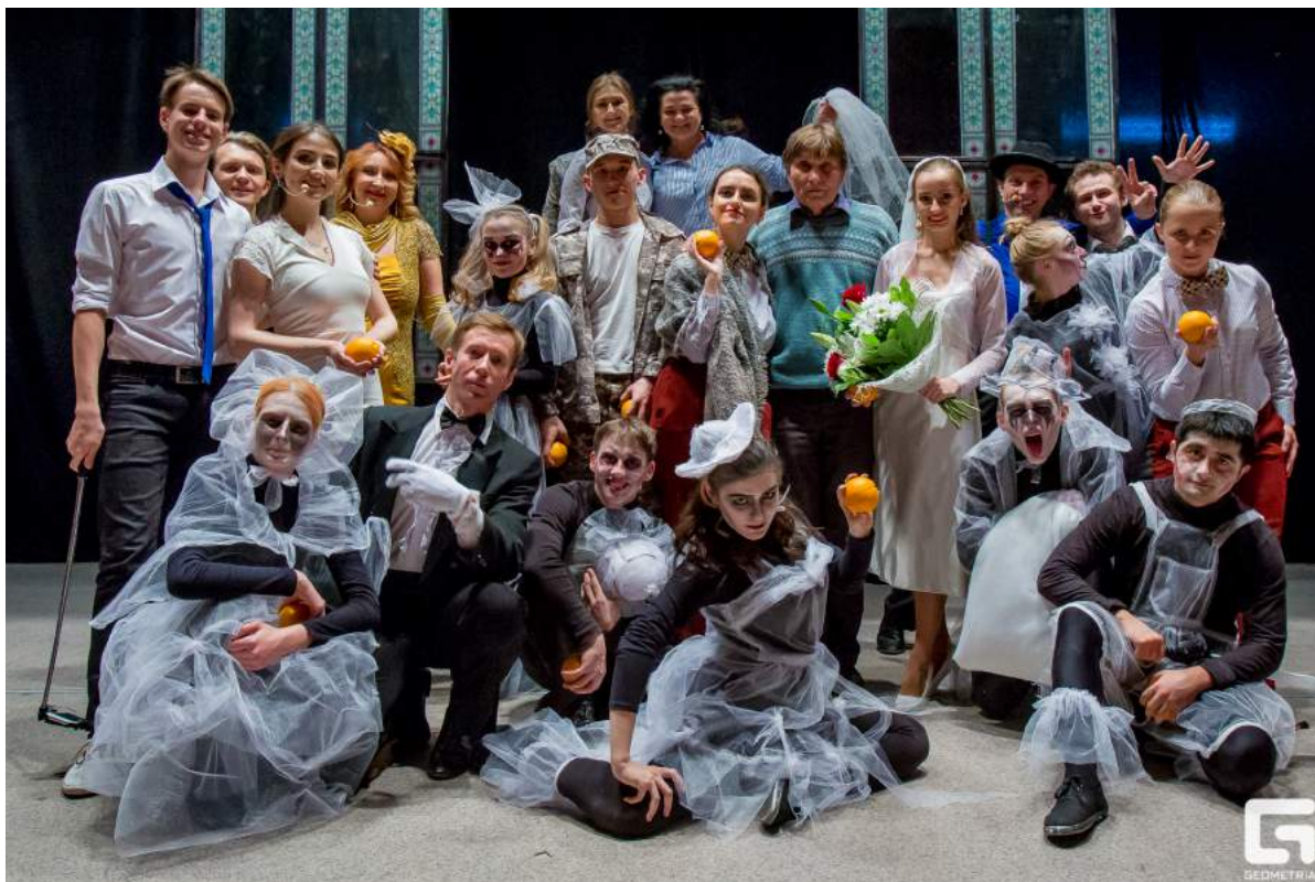
Премьера комедийного мюзикла «Кентервильское привидение» 18 ноября 2018 г.