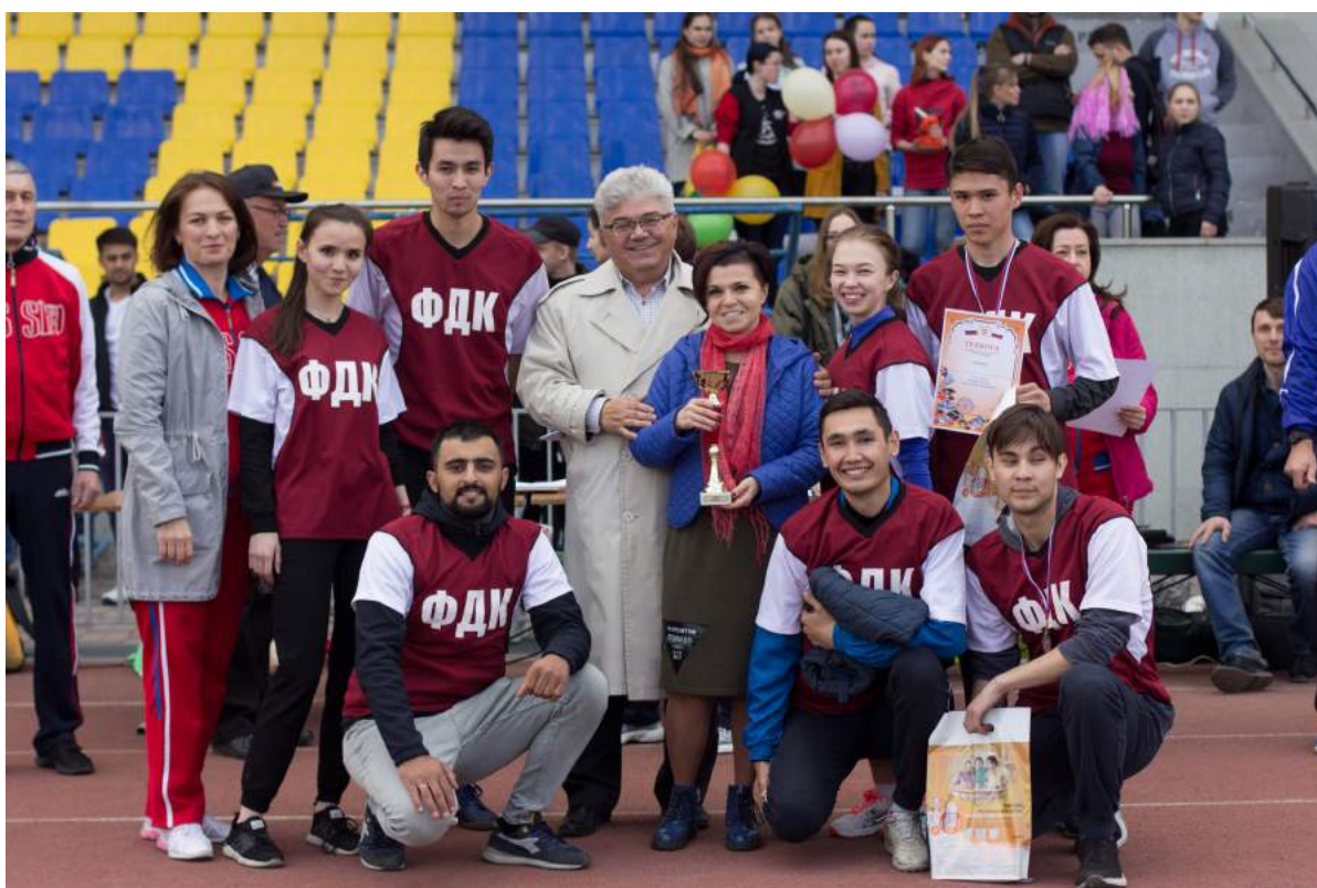
Победители XVI Ежегодной спартакиады ЧГИК – студенты факультета документальных коммуникаций и туризма 22 мая 2019 г.