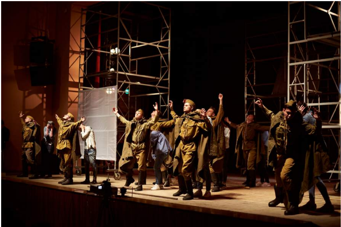
Театрализованное представление «Вечно живые» 8 мая 2019 г.