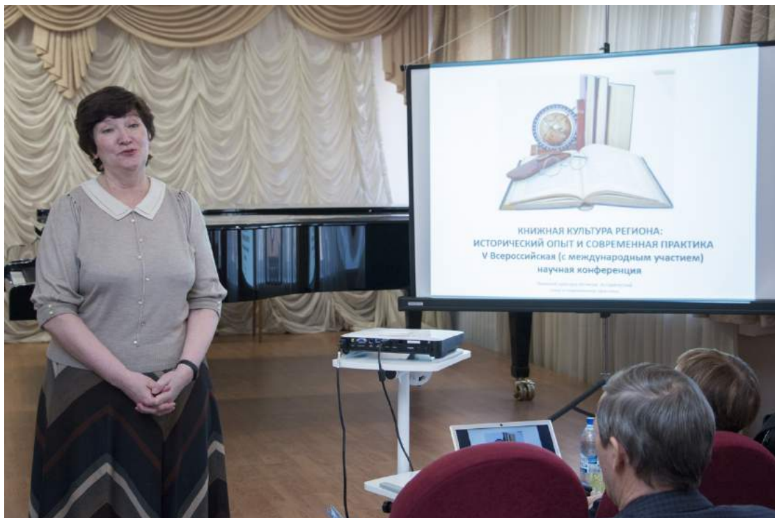
Всероссийская (с международным участием) научная конференция «Книжная культура региона: исторический опыт и современная практика» 15–16 ноября 2018 г.