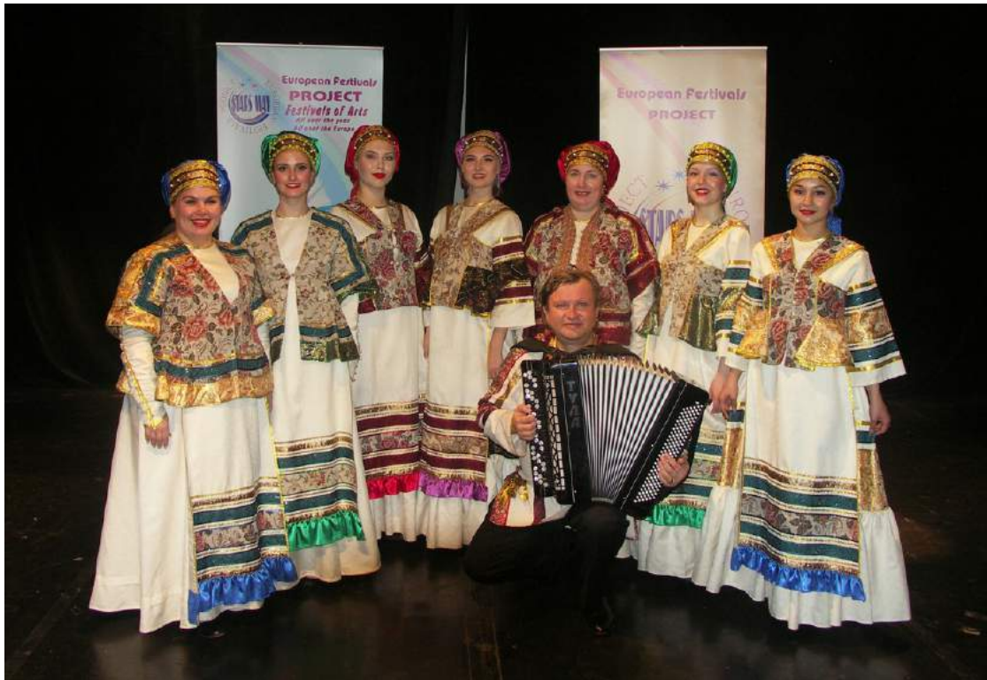
Ансамбль хора народной музыки «Песни Урала» удостоен Гран-при в XIV Международном мультижанровом фестивале-конкурсе Crystal Star Paris (Франция) 12–21 октября 2018 г.