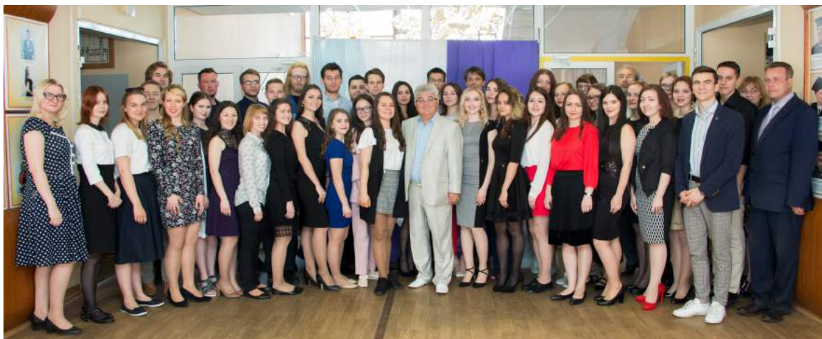
Прием у ректора победителей Всероссийской научной конференции молодых исследователей «Культурные инициативы» и активистов Научного студенческого общества ЧГИК 30 мая 2019 г.