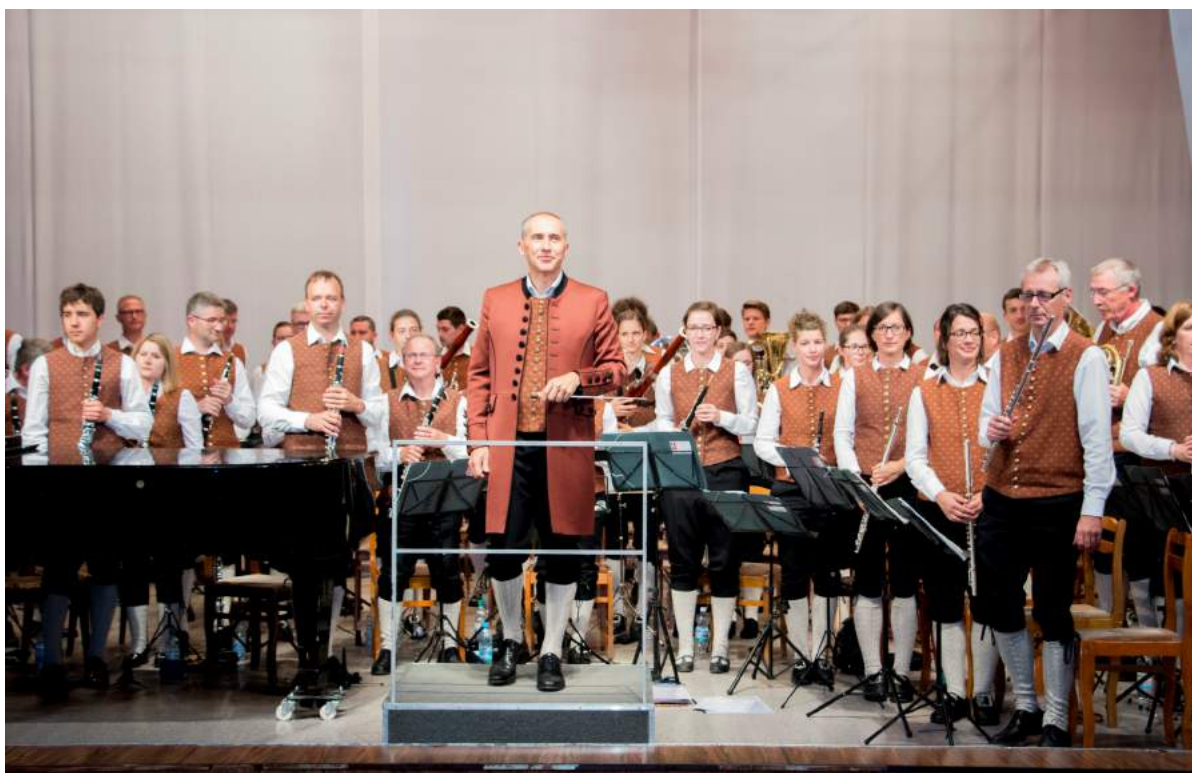
Концерт Большого духового оркестра из Германии Stadtkapelle Wangen под управлением художественного руководителя и главного дирижера Тобиаса Цинзера 21 июня 2019 г.