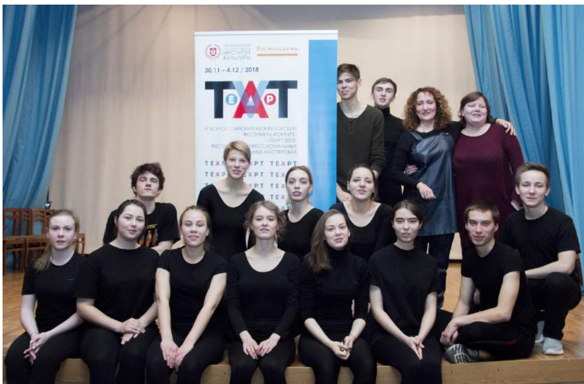
V Ежегодный всероссийский межвузовский фестиваль-конкурс «TeArT» 30 ноября – 4 декабря 2018 г.