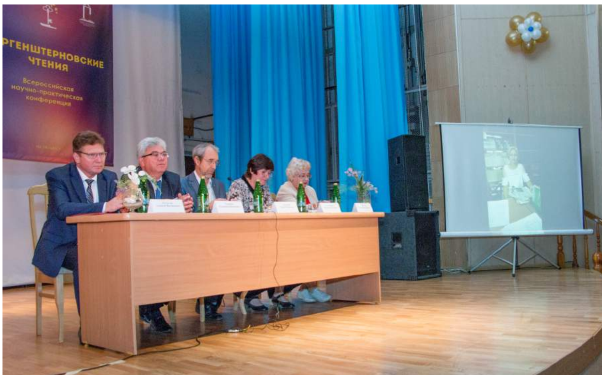
Всероссийская научно-практическая конференция «Моргенштерновские чтения – 2018» 20–21 сентября 2018 г.