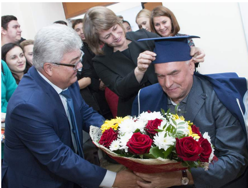
С. В. Мирошниченко, заслуженный деятель искусств РФ, профессор, лауреат двух Государственных премий РФ (Москва)