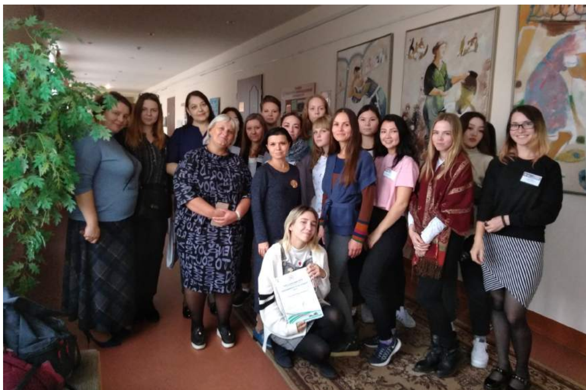
Участники проекта «Библиотрансфер» 17–21 сентября 2018 г.