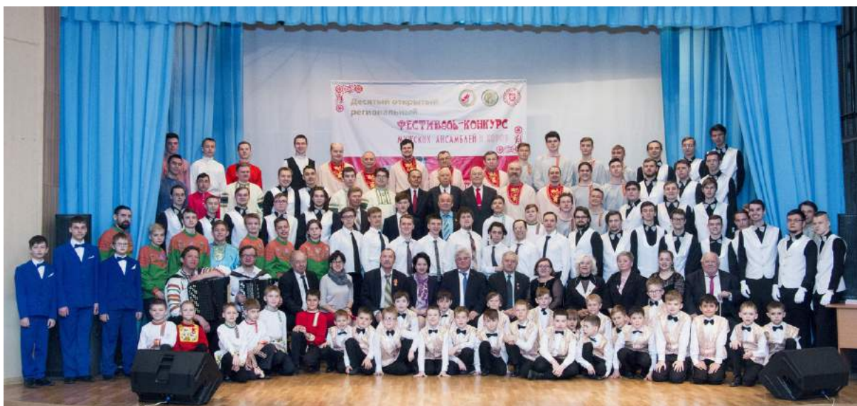
Международный конкурс мужских хоров и ансамблей им. В. П. Поляничко 31 марта 2019 г.