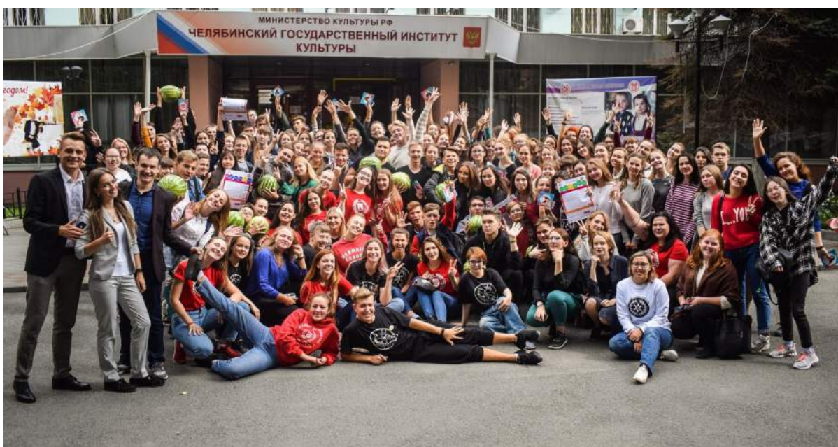
Неделя адаптации первокурсников 3–7 сентября 2018 г.