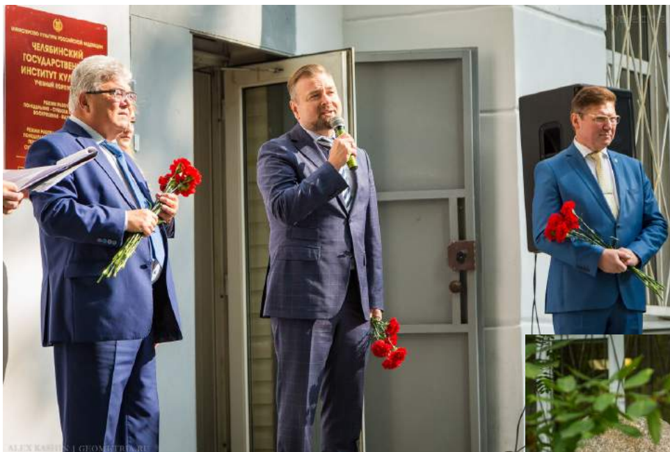
Открытие памятного камня в честь золотого юбилея ЧГИК 1 сентября 2018 г.