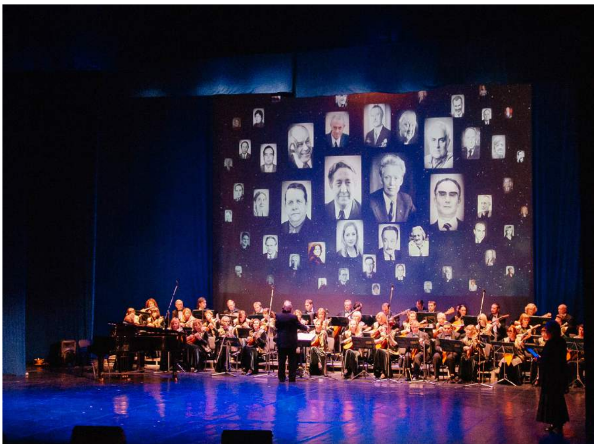
Торжественный концерт «Устремленные в будущее», посвященный 50-летию юбилею ЧГИК Челябинский государственный академический театр драмы им. Н. Ю. Орлова, 3 октября 2018 г.