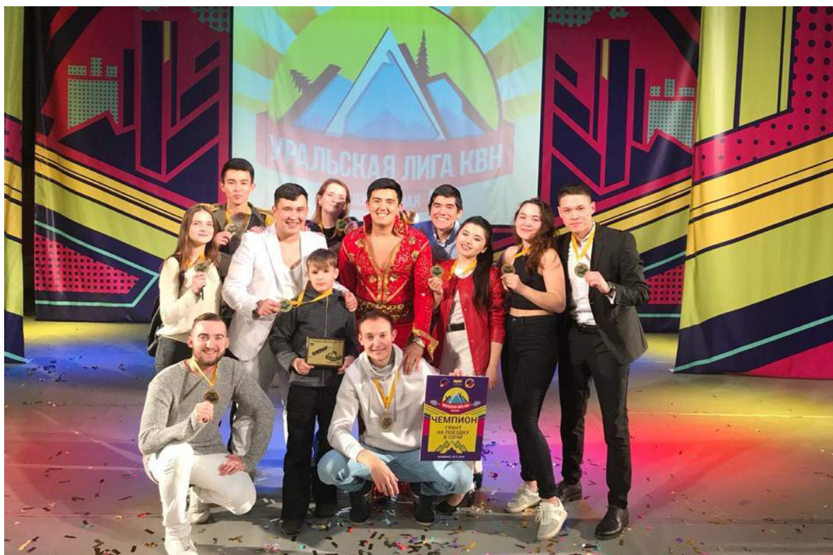
Команда КВН ЧГИК «Сборная казахов» – победитель Центральной Уральской Лиги КВН