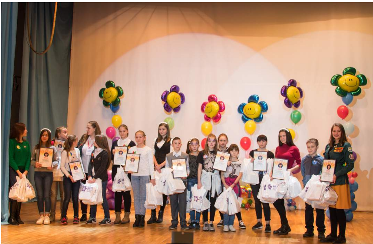
V Областной день детского творчества 28 октября 2018 г.