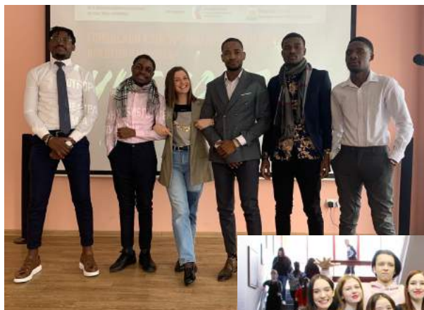
Участие студентов консерваторского факультета в городском конкурсе поэтического чтения «ЧиБИС'22» Апрель 2022 г.