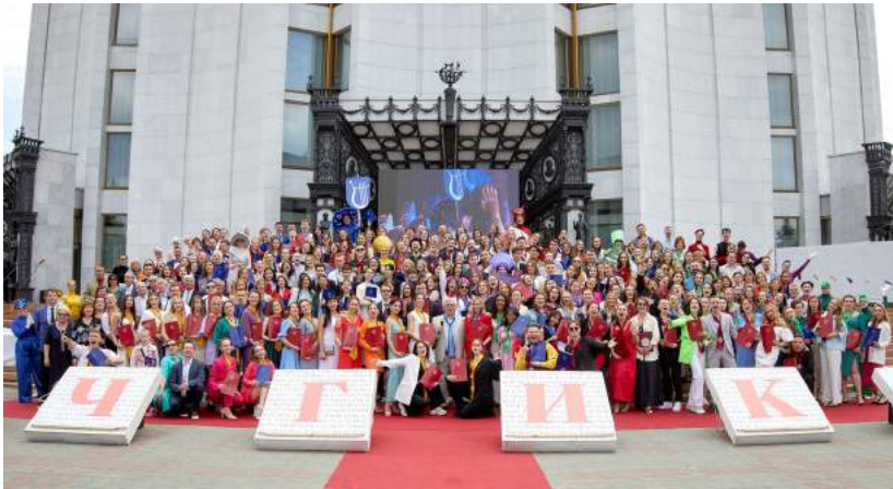
Церемония вручения дипломов выпускникам дневного отделения 2 июля 2022 г.