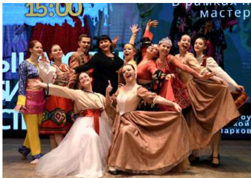
Концерт и мастер-класс хореографического факультета в рамках Танцевально- просветительского десанта «Танцы народов Челябинской области» Южноуральск, 9 декабря 2021 г.