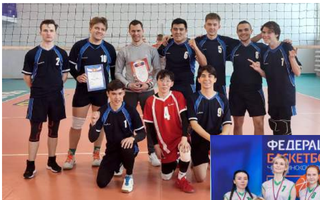
Спартакиада вузов Челябинска

Мужская сборная студентов ЧГИК – победитель (1 место) в соревнованиях по волейболу Март 2022 г.