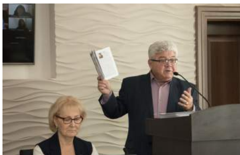
XX Международный научно-творческий форум «Научные школы. Молодежь в науке и культуре XXI века» 18–19 ноября 2021 г.