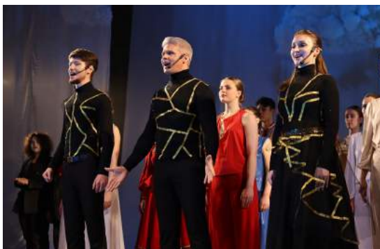
Шоу-программа «Дары культуры» 25 марта 2022 г.