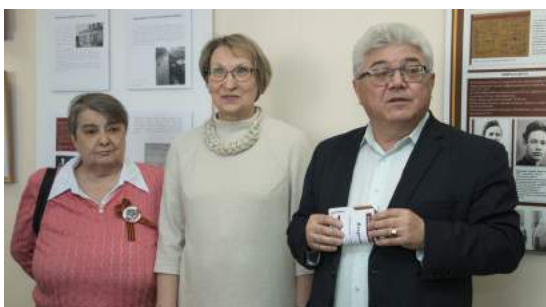
Открытие выставки «Этот воздух пусть будет свидетелем...»: Эвакогоспиталь 1722 в документах, фотографиях, воспоминаниях» 4 мая 2022 г.