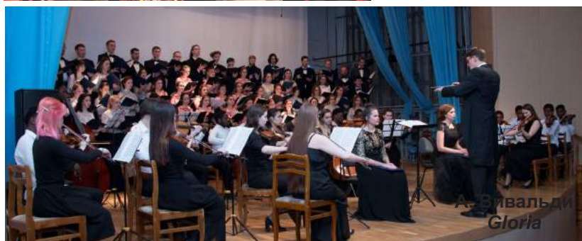
Совместный концерт камерного оркестра и академического хора консерваторского факультета с академическим хором Асбестовского колледжа искусств 16 декабря 2021 г.