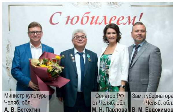
Министр культуры Челяб. обл. А. В. Бетехтин