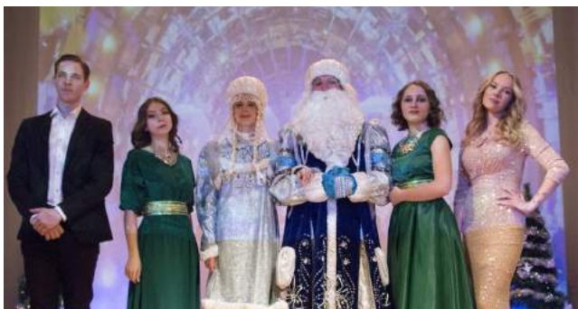
Новогодний концерт «Как Елки новогоднее настроение поднимали...» 29 декабря 2021 г.

Открытие выставки Студенческой лаборатории музейного проектирования факультета документаль- ных коммуникаций и туризма «На елку с книжных страниц! Из истории елочной игрушки»