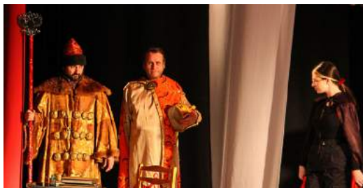
Интеллектуальная общевузовская игра «Черный князь» 9 декабря 2021 г.