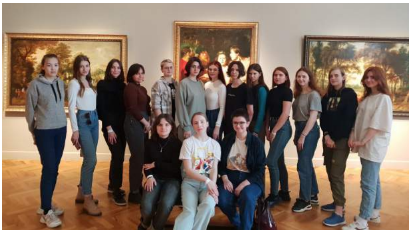
Рабочий визит в рамках практической подготовки в художественные музеи Екатеринбурга 14 апреля 2022 г.