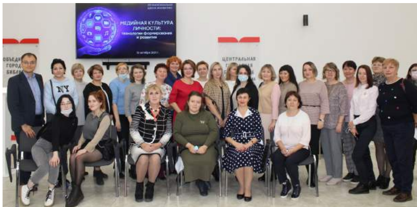
XIII Межрегиональная Школа инноватики «Медийная культура личности: технологии формирования и развития» (г. Магнитогорск) 12 октября 2021 г.