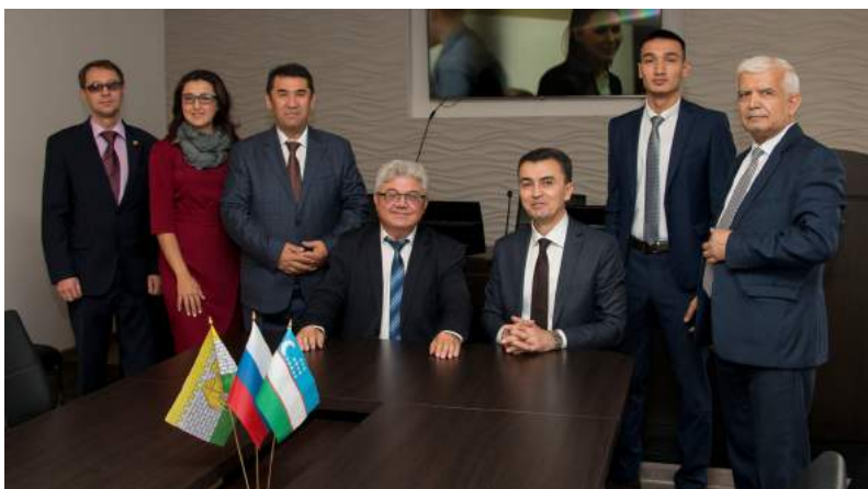
Визит в ЧГИК Генерального консула Республики Узбекистан в городе Екатеринбурге А. К. Хатамова 30 сентября 2021 г.