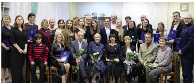
«Научная кухня» – посвящение в аспиранты и вручение дипломов выпускникам аспирантуры 26 ноября 2021 г.