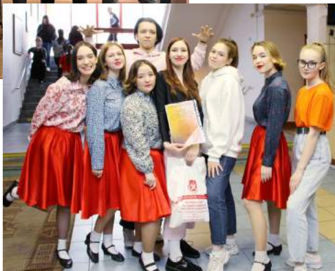
Всероссийский фестиваль-конкурс «Академия лета» 27 апреля 2022 г.