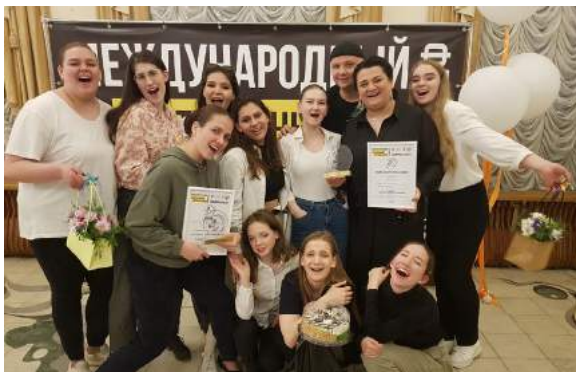
Студенты кафедры ТИС – победители Международного театрального музыкального фестиваля «Камерный Beat» Апрель 2022 г.