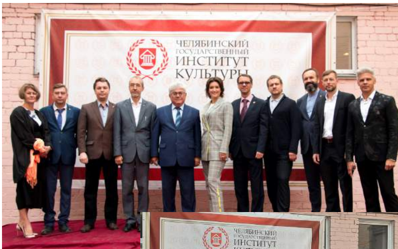
Торжественная линейка, посвященная Дню знаний 1 сентября 2021 г.