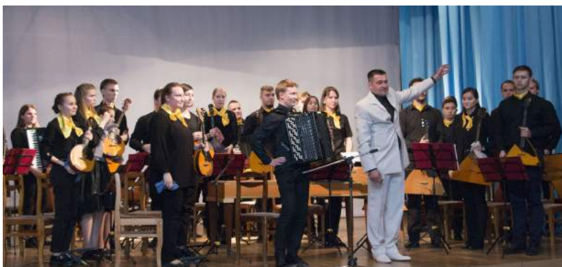
Концерт «Звуки сердца», посвященный Международному дню музыки 1 октября 2021 г.