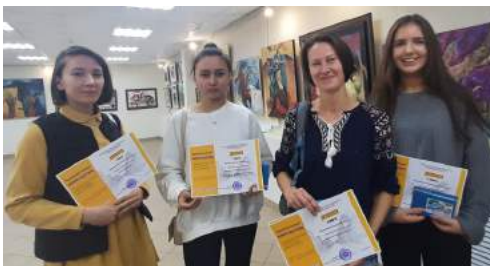
Студенты ФДПТ – победители конкурса-выставки «Городской пленэр» Сентябрь 2021 г.