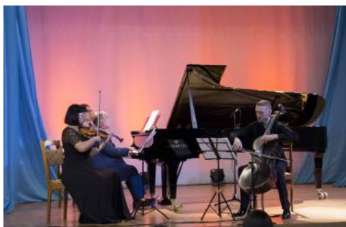
Презентация концертного рояля Bechstein Ноябрь 2021 г.