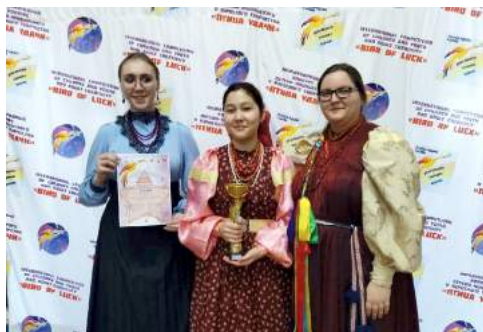
Фольклорный ансамбль «Радованье» – обладатель Гран-при в Международном конкурсе «Птица удачи» 5 марта 2022 г.