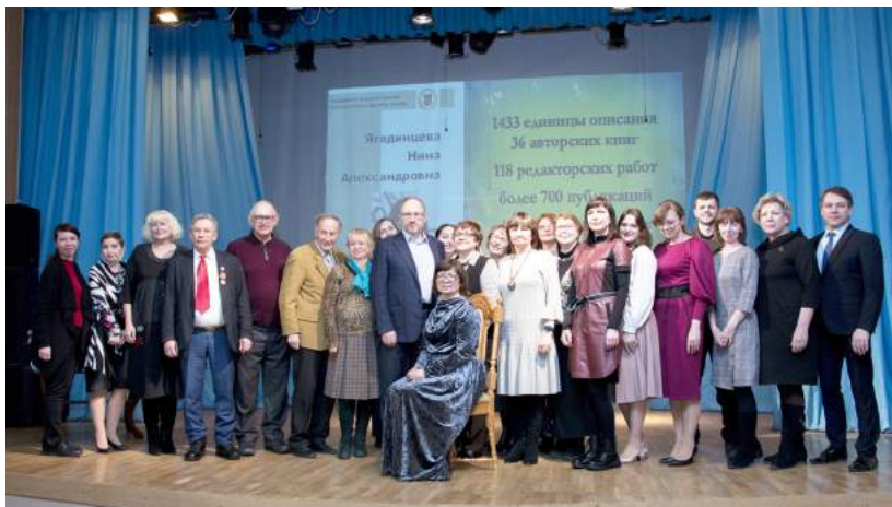
Литературный вечер, посвященный юбилею Н. А. Ягодинцевой – поэта, секретаря Союза писателей России, профессора 8 февраля 2022 г.