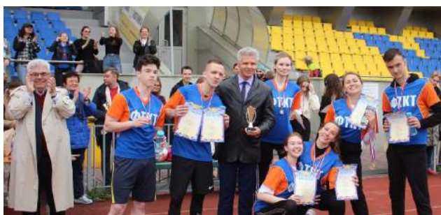
Закрытие Спартакиады вуза 24 мая 2022 г.