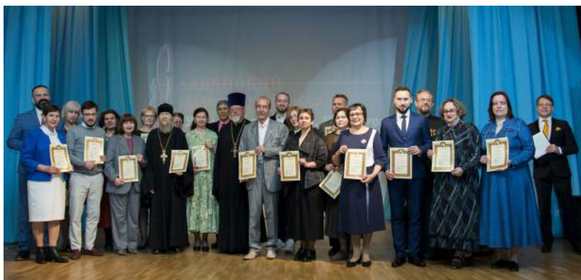
Двадцатый Славянский научный сбор «Урал. Православие. Культура» 14–21 мая 2022 г.