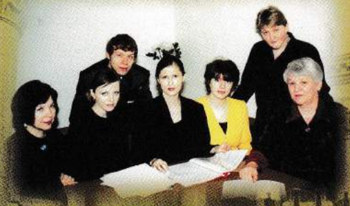
Аспиранты набора 2000 г. в научном отделе

Более чем 2,5 тысячам студентов дневного и заочного отделений академии создаются необходимые условия для постижения творческих профессий, овладения основами научных знаний, навыками исследовательской работы. Учебный театр "Дебют", рассчитанный на 500 мест, позволяет осуществить в сезон до 5 постановок, являясь одновременно удобной учебной и концертной площадкой.