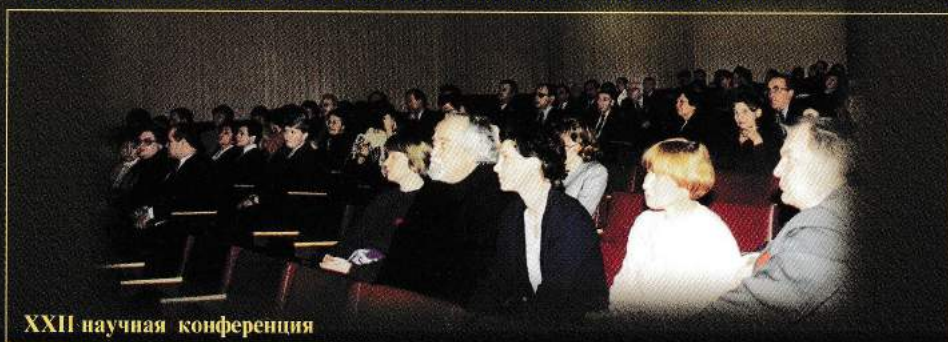
XXII научная конференция

Академия является базой проведения международных, всероссийских, региональных конференций, симпозиумов, фестивалей, творческих конкурсов. Традиционными стали Бирюковские и Виноградовские чтения, единственные в России студенческие социологические чтения.