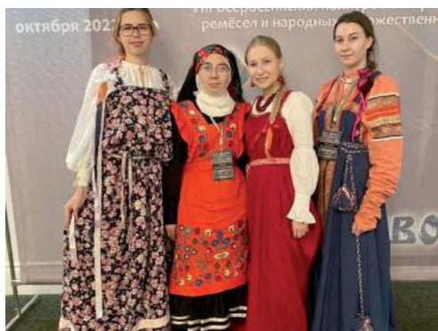
Студенты и выпускники ФДПТ — участники Всероссийского конкурса мастеров народных промыслов и традиционных ремесел «Урал мастеровой» 1–2 октября 2022 г.