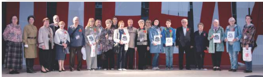
Презентация книги «Герои госпиталя 1722» 22 июня 2023 г.