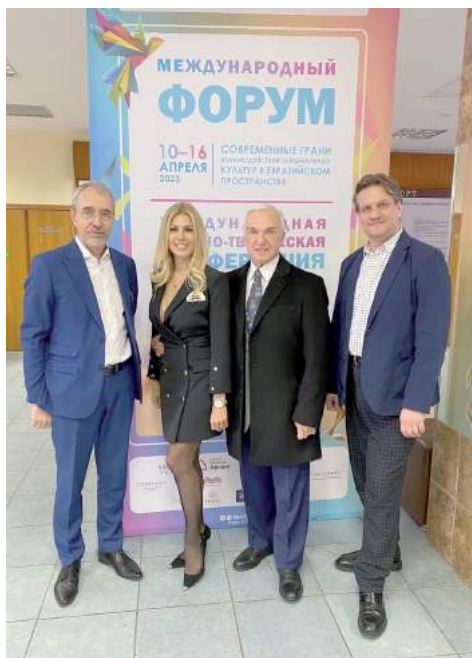
Международный форум «Современные грани взаимодействия танцевальных культур в Евразийском пространстве» 10–16 апреля 2023 г.