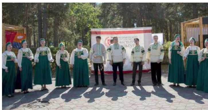
ЧГИК стал участником Общественно-политического вернисажа — 2022 5 сентября 2022 г.