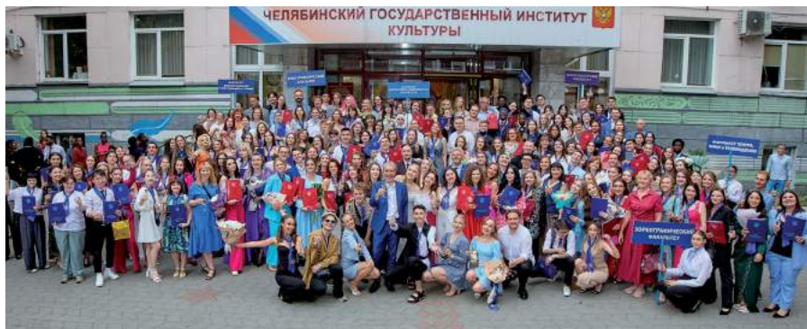
Церемония вручения дипломов выпускникам дневного отделения. 3 июля 2023 г.