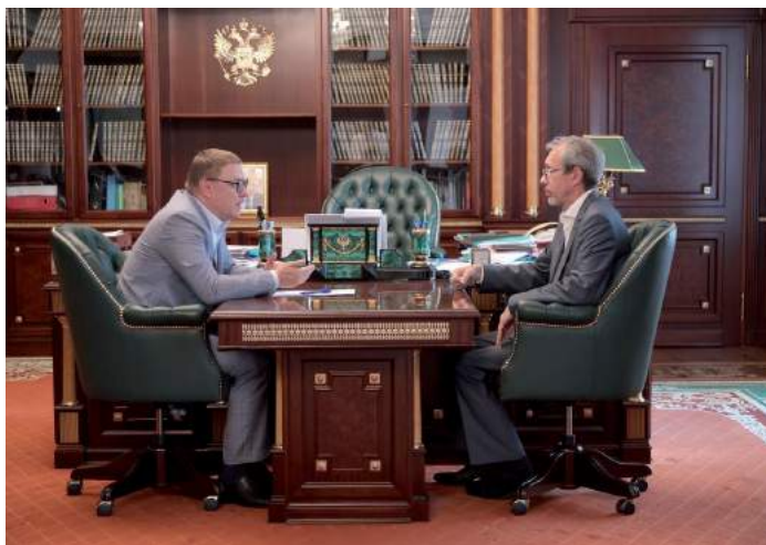
Рабочая встреча губернатора Челябинской области А. Л. Текслера с и. о. ректора ЧГИК С. Б. Синецким. 16 августа 2022 г.