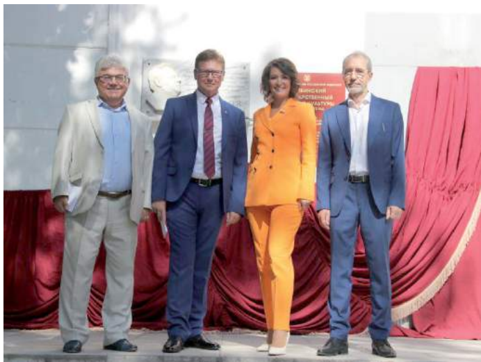
Торжественная линейка, посвященная Дню знаний 1 сентября 2022 г.