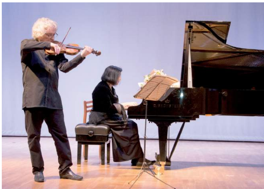
Творческая встреча со знаменитым дуэтом: Леонидом Лундстремом и Марией Воскресенской. 3 марта 2023 г.