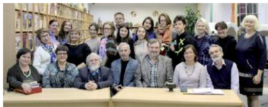
Участники лаборатории поэтического перевода «Мосты над облаками» 30 января 2023 г.