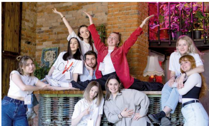
Школа актива студенческого самоуправления «ШАНС» Апрель 2022 г.