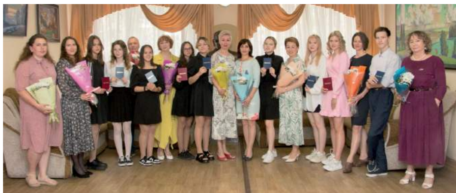
Торжественное вручение свидетельств об окончании ДШИ ЧГИК первым выпускникам. 9 июня 2023 г.