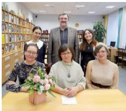
Победители внутривузовского конкурса педагогического мастерства 3 февраля 2023 г.