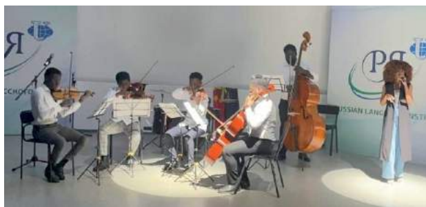
Выступление студентов консерваторского факультета в Посольстве Анголы в Москве. 11–12 ноября 2021 г.