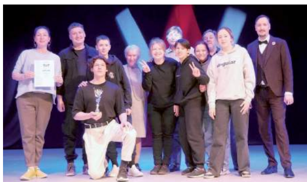
VI Всероссийский фестиваль-конкурс детских и юношеских театров «ТЕАРТ» 8–9 апреля 2023 г.