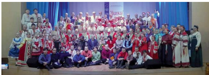
VI Всероссийский конкурс исполнителей народной песни «Надежда». 9 апреля 2023 г.