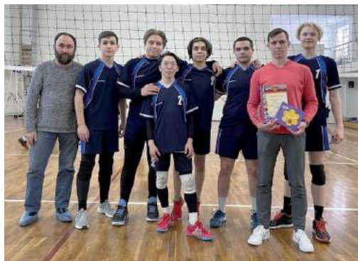
Сборная мужская команда по волейболу — 2-е место в зачете Спартакиады Челябинска среди мужских команд 15 февраля 2023 г.