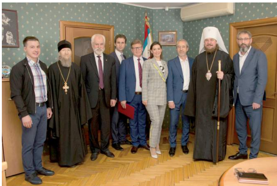
XXI Славянский научный сбор «Урал. Православие. Культура». 17–18 мая 2023 г.