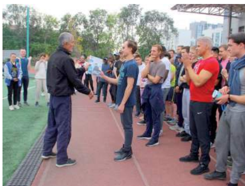
Всероссийский студенческий патриотический забег 24 сентября 2022 г.