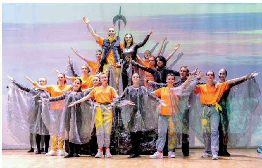
Премьера рок-мюзикла «Луна и Солнце». 27 мая 2023 г.