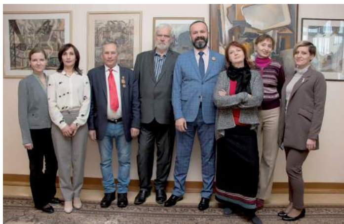
Открытие выставки «СОЦРЕАЛИЗМ. Народность. Идейность. Конкретность. Работы уральских художников 1930–1990 гг.» 8 декабря 2022 г.