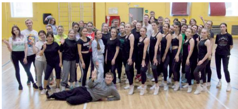
Участники всероссийской студенческой патриотической акции «Знай наших». 28 октября 2022 г.