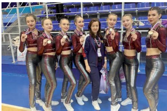
Команда «Спортлайф» — финалист кубка России по фитнес-аэробике. 3 марта 2022 г.