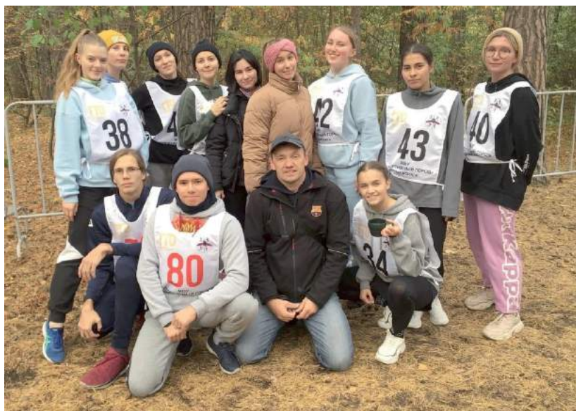
Сборная команда по лёгкой атлетике ЧГИК заняла 1-е место в легкоатлетическом кроссе Универсиады образовательных организаций высшего образования Челябинской области 2022–2023 учебного года 30 сентября 2022 г.