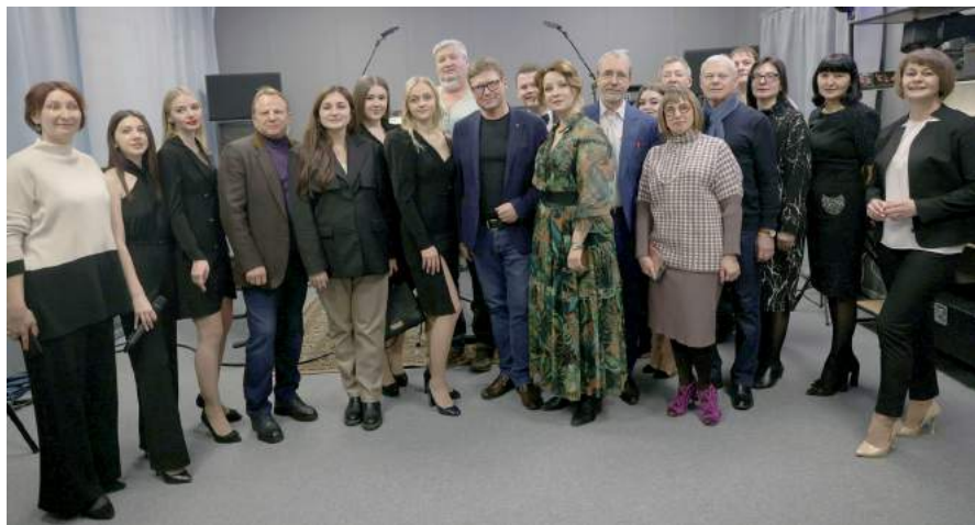
Открытие Центра прототипирования современной музыки, звукового дизайна и создания клипов «В КУБЕ». 1 июля 2022 г.