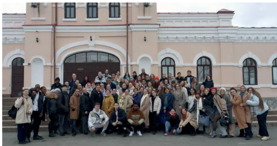
Концерт-презентация ЧГИК в Кыштыме. 18 марта 2023 г.