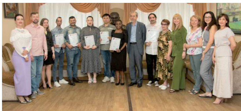
Торжественное вручение свидетельств об обучении слушателям подготовительного отделения для иностранных граждан. 29 июня 2023 г.