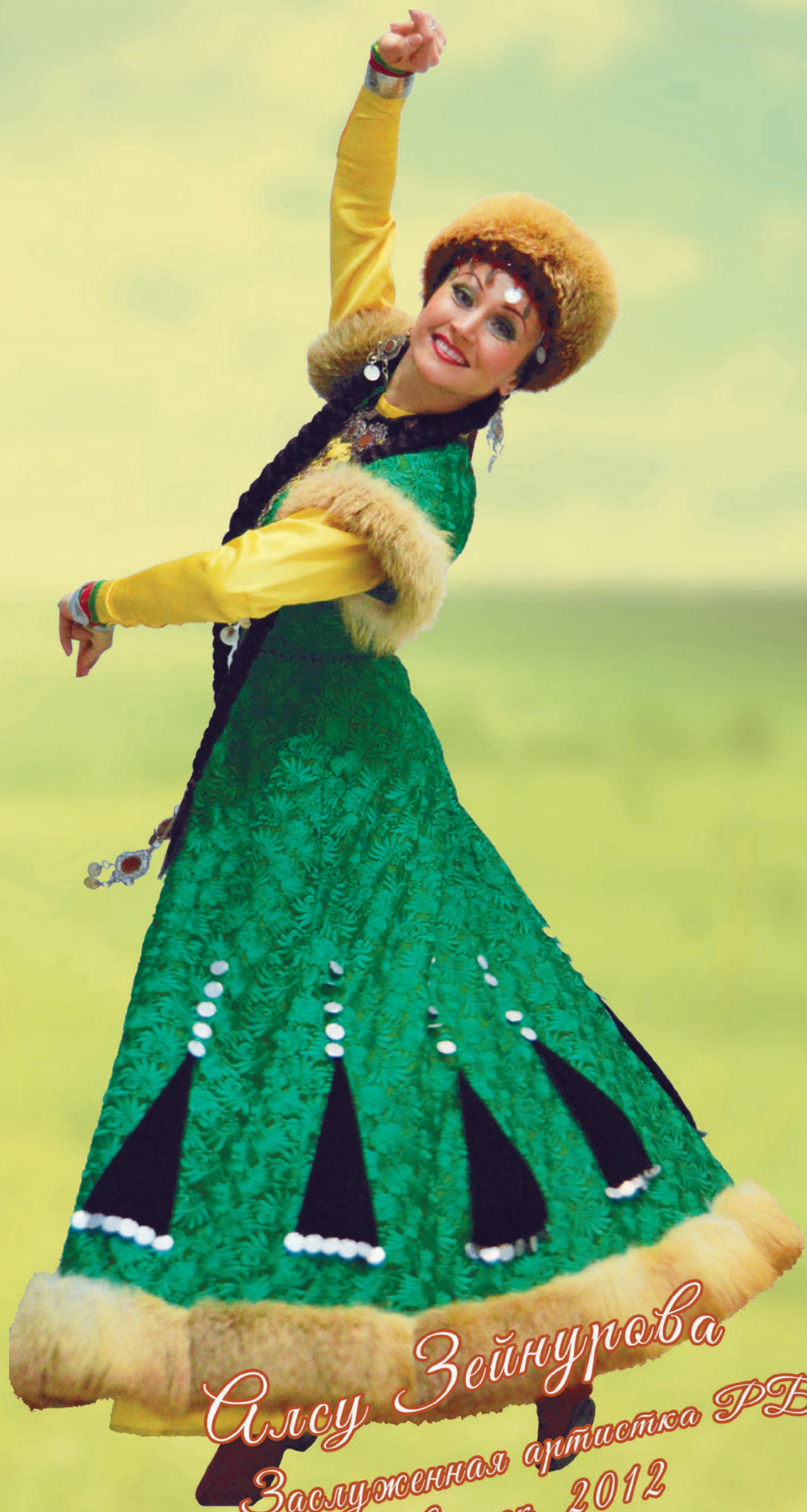
Алсу Зейнурава Заслуженная артистка РБ выпуск 2012