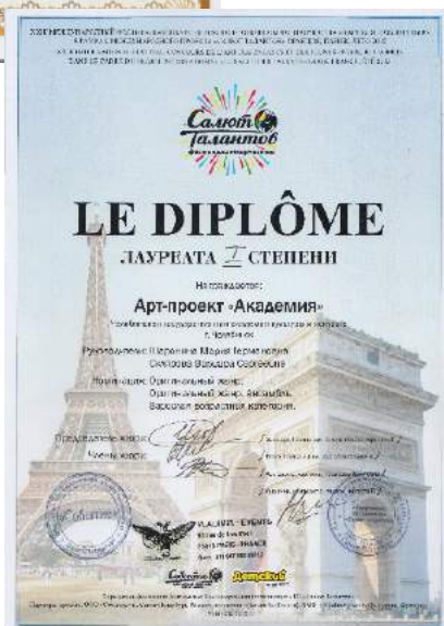
Дипломы и сертификат участника международного фестиваля-конкурса детского и юношеского творчества «Салют талантов»