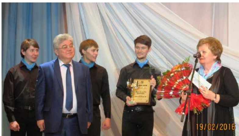
Вручение Премии имени первого ректора П. В. Сапронова выпускникам вуза за выдающиеся достижения в развитии и популяризации культуры и искусств. 2016 г.