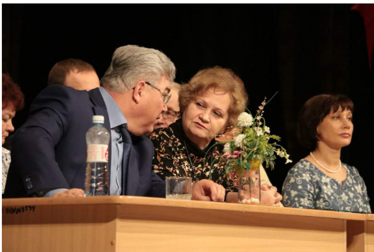
День открытых дверей в ЧГАКИ. 2015 г.