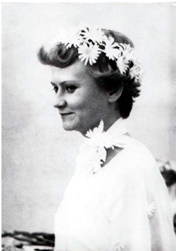
Невеста. 1978 г.