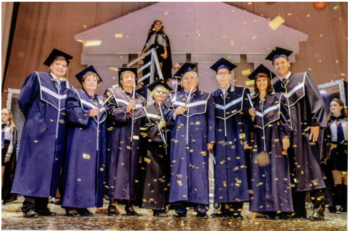
Деканский корпус. 2015 г.