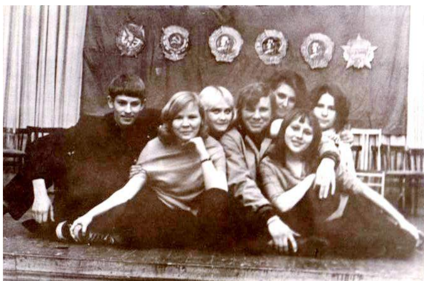
Участники дипломного спектакля – студенты железно- дорожного техникума. 1974 г.