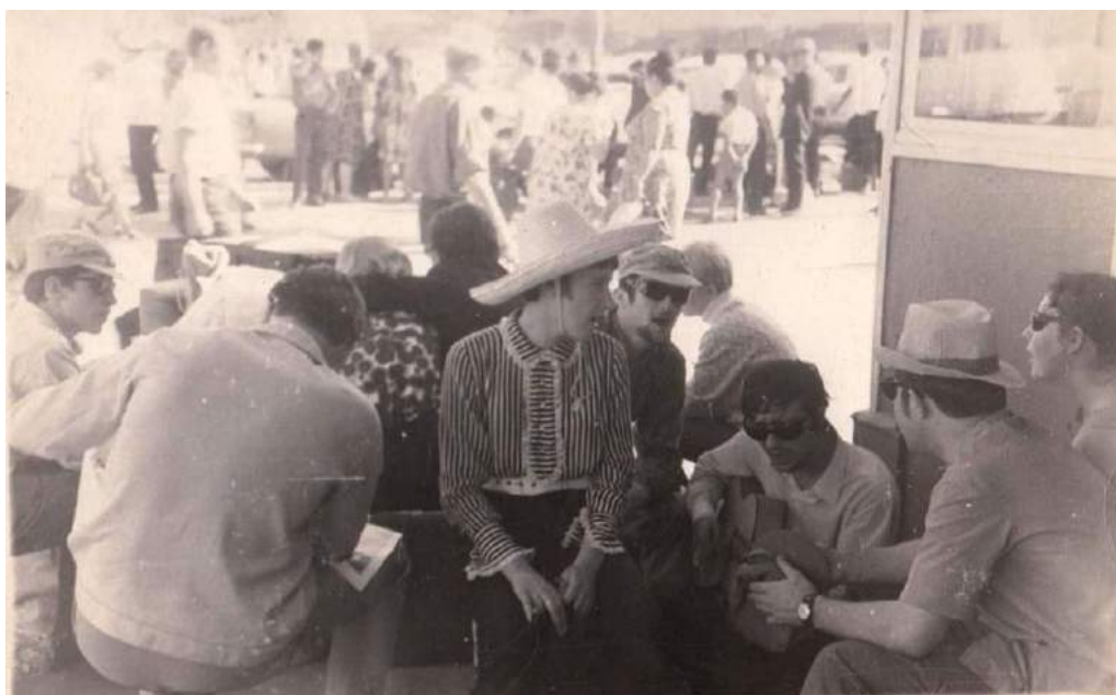
Отправка в Туркмению с концертами по комсомольской путевке. 1972 г.