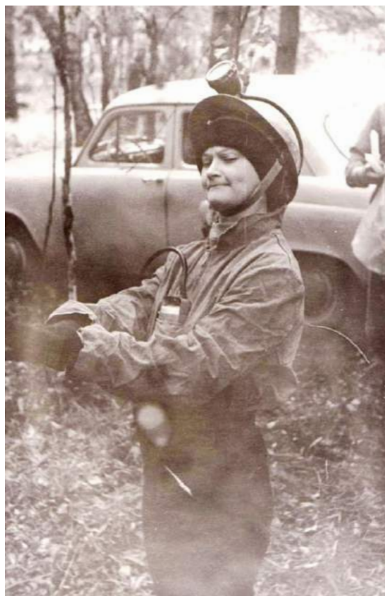
Свадебное путешествие в пещеру. 1978 г.