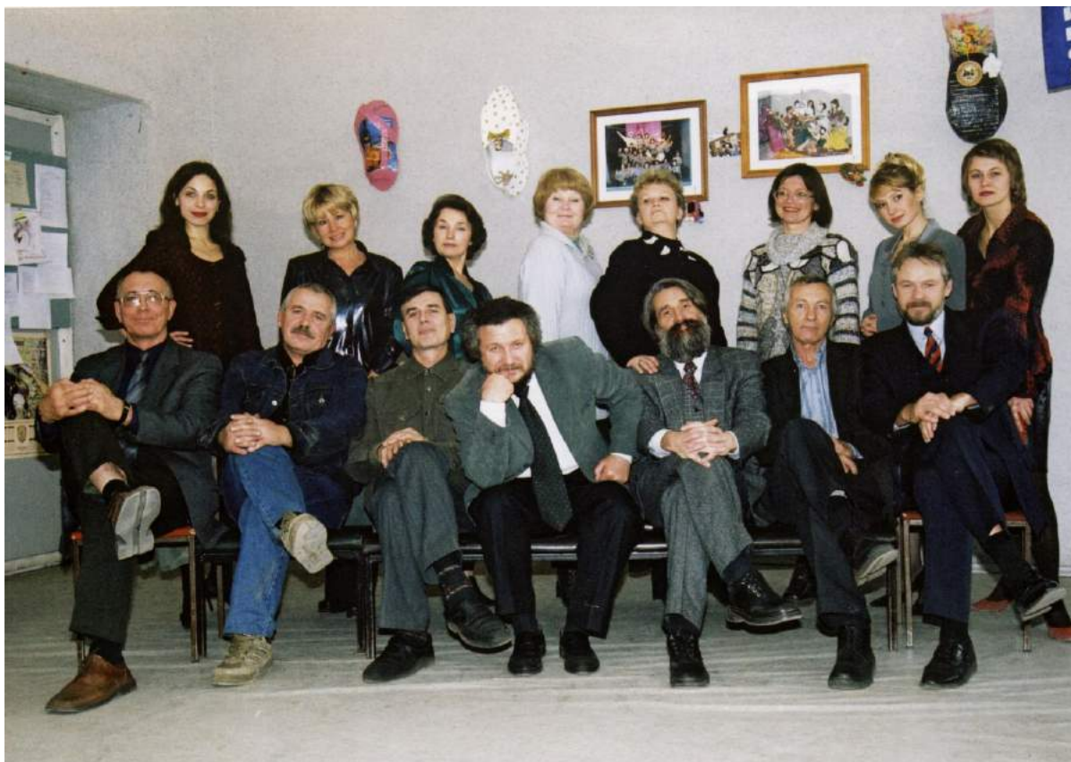
Состав кафедры РТПП. 2002 г.