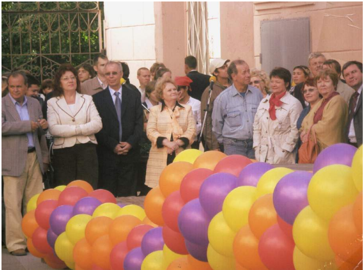
День знаний. 2005 г.