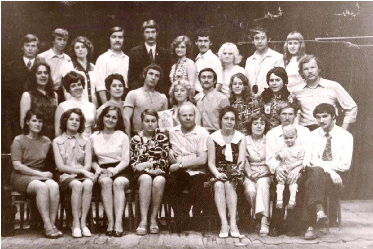
Выпуск ЧГИК 1974 г. Театральная группа