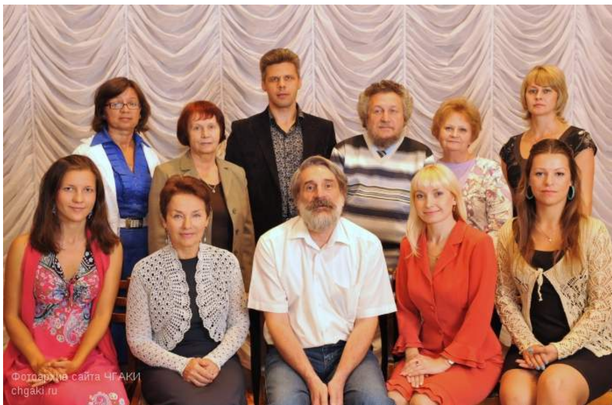
Состав кафедры режиссуры театрализованных представлений и праздников. 2012 г.