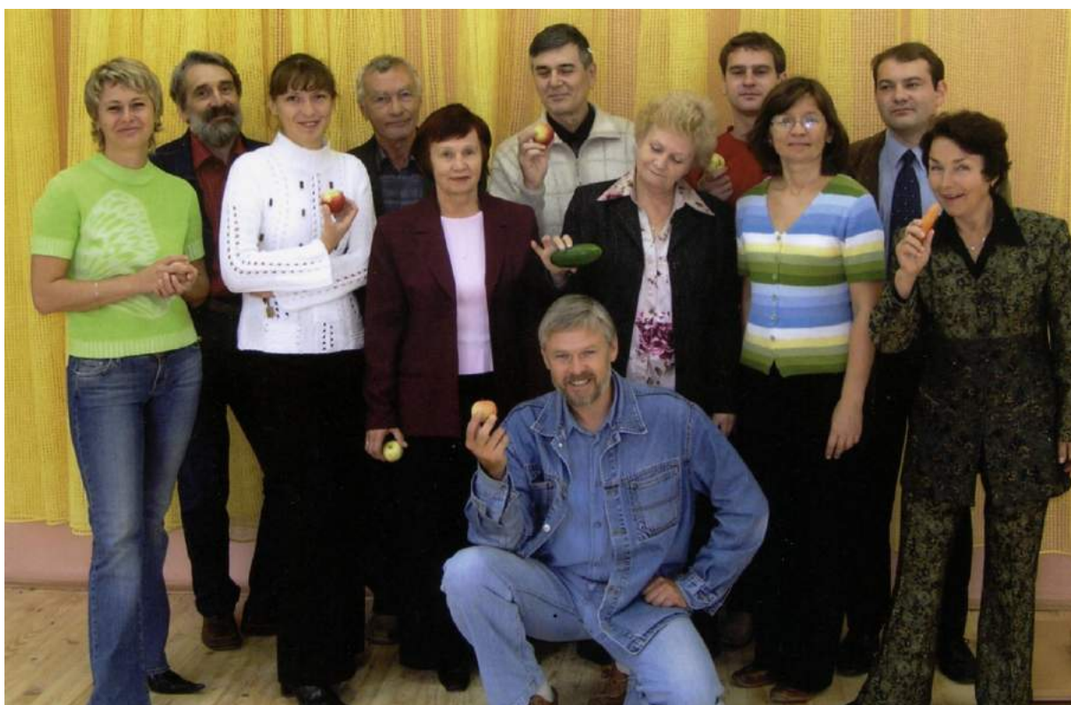
Праздник урожая на кафедре РТПП. 2004 г.