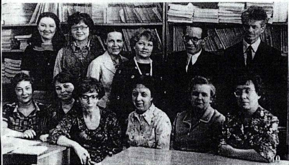
10. Кафедра библиографии ЧГИК. 1978 г.