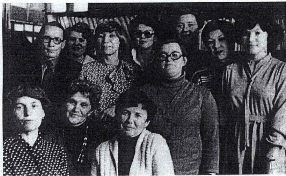
13. Коллектив библиографического отдела ЧОУНБ. 1984 г.