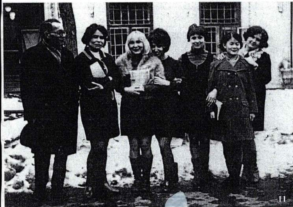
11. Со студентами на производственной практике (70-е годы)