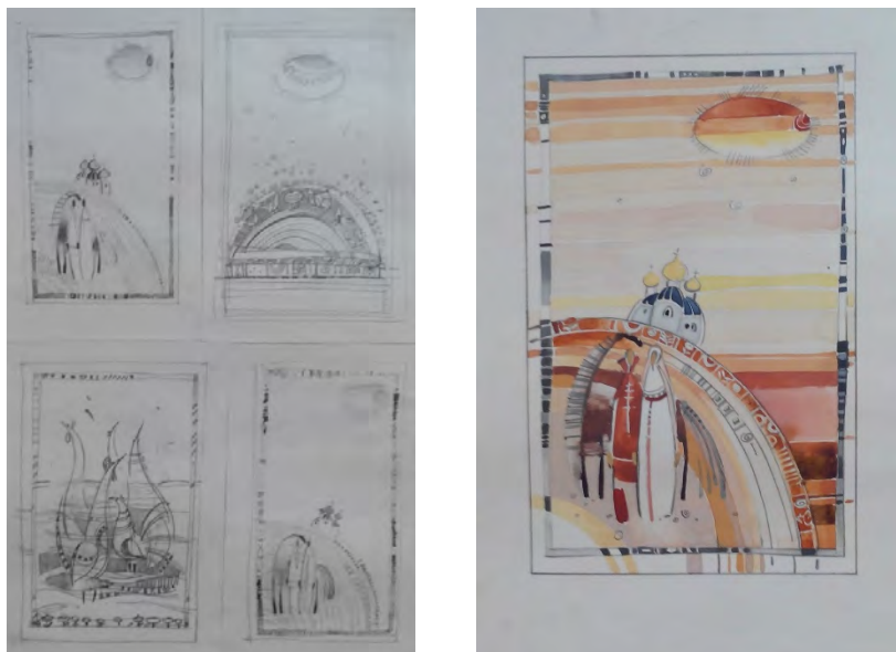
Эскиз для гобелена на тему «Русь»

Задание: декоративная композиция на заданную тему (по желанию абитуриента возможно выполнение натюрморта из бытовых предметов, геометрических фигур и т.д.)