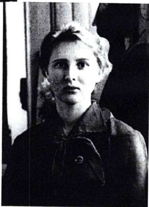
Старшая пионервожатая интерната № 5 г. Челябинска. 1961 г.