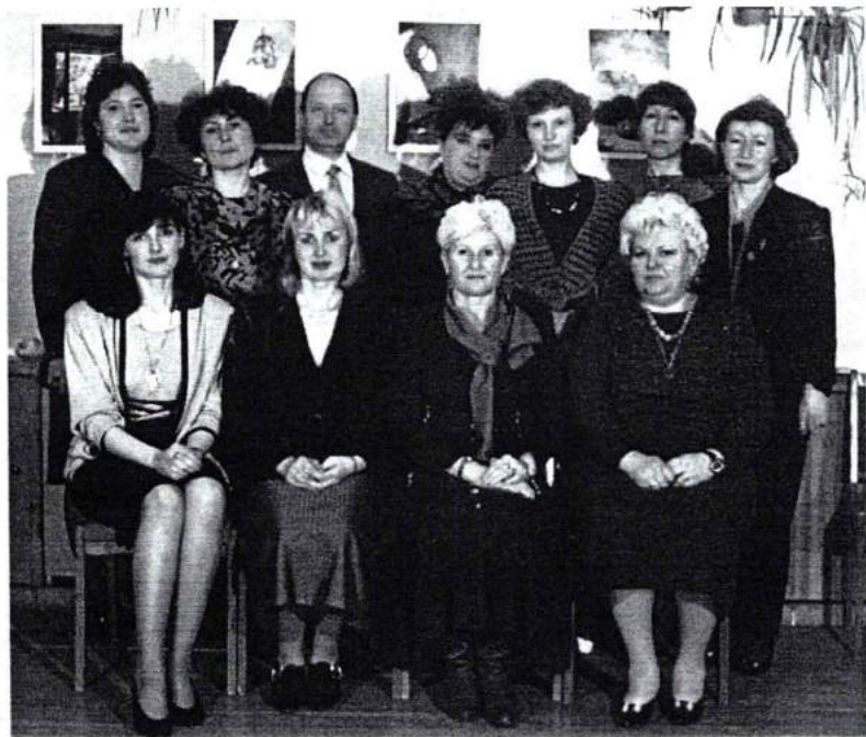
Курсы подготовки социальных педагогов в Калининском районе г. Челябинска. 1995 г.