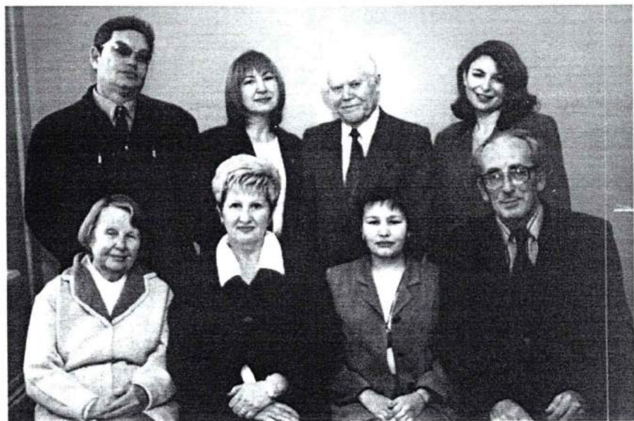
Кафедра педагогики и психологии ЧГАКИ. 2004 г.