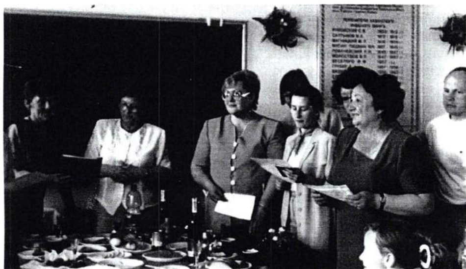
Кафедра социальной педагогики и психологии ЧГПУ. Поздравления с юбилеем. 2002 г.