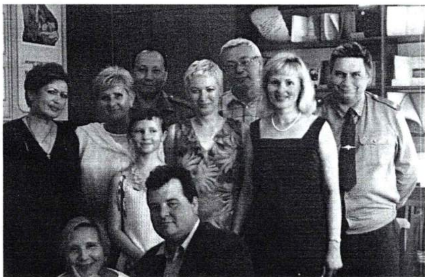
Докторанты, аспиранты и соискатели кафедры социальной педагогике и психологии ЧГПУ. 2002 г.