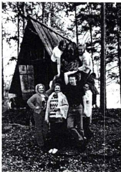
С аспирантами и соискателями в санатории «Еловое» (работа с воспитателями по программе «Социально-педагогическая защита детства»). 2004 г.