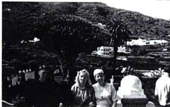
В Испании с семьей. 2003 г.