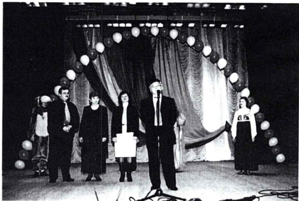
Конкурсная программа среди детей детских домов «Ты не один». 2003 г.