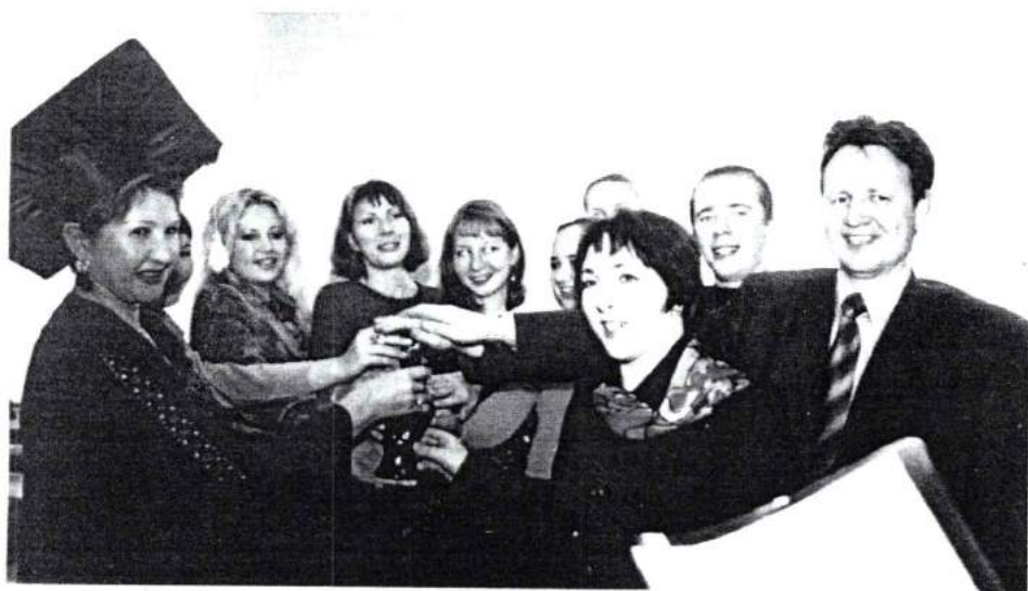
ЧГАКИ. Посвящение в аспиранты. 2004 г.