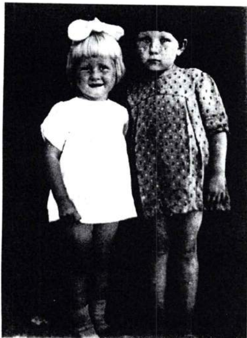
Детские годы, с сестрой Галей. 1946 г.