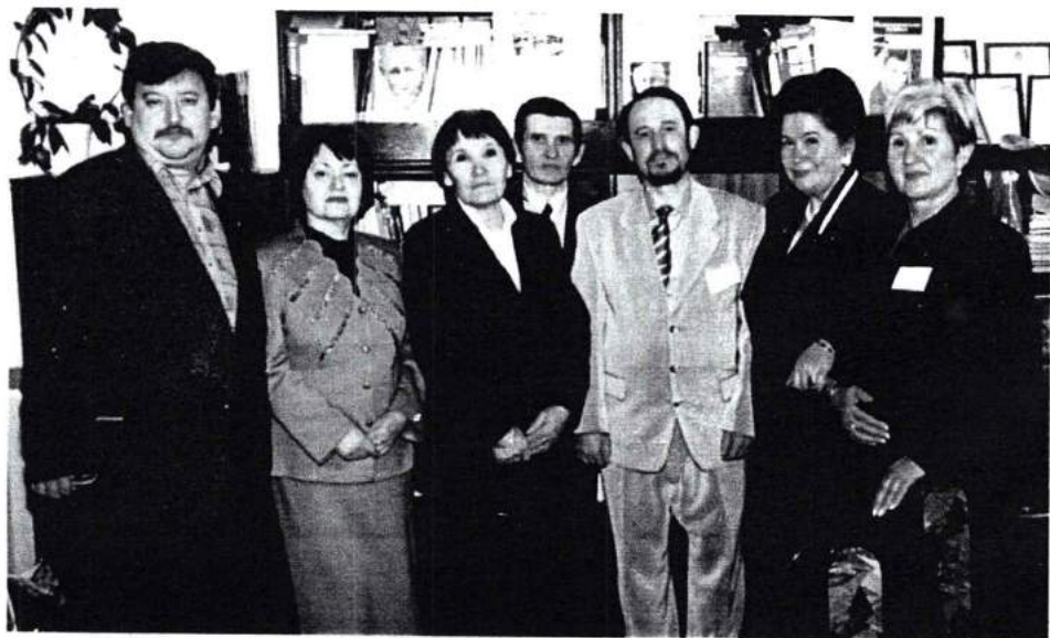
Оренбург, 2002 г.