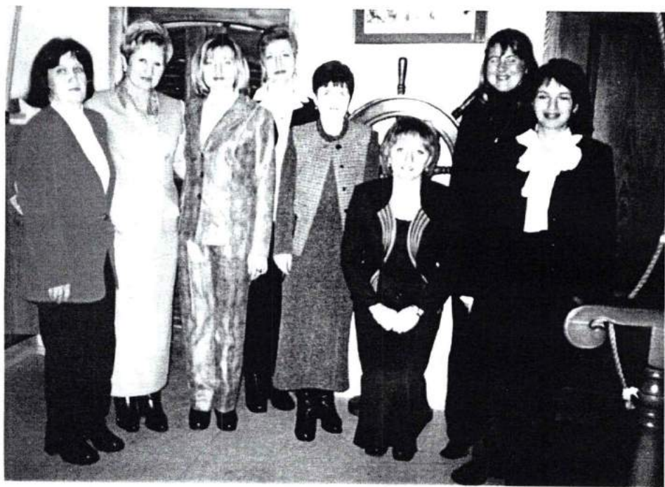
Шадринск, 2002 г.