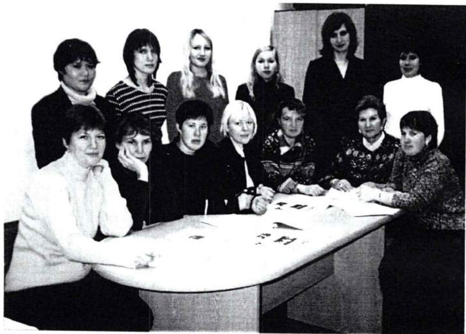
Аспиранты и соискатели кафедры педагогики и психологии ЧГАКИ. 2004 г.