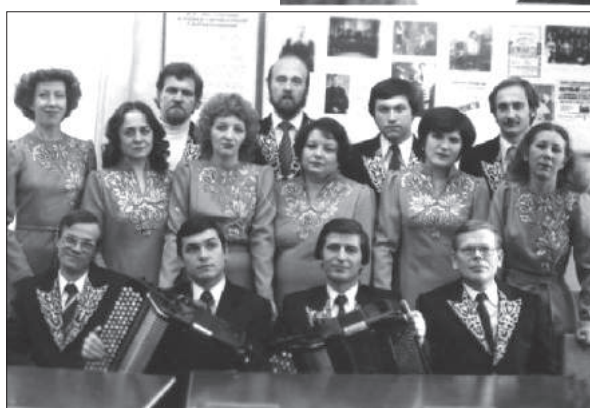
◀ Ансамбль народных инструментов ЧГИК (1980-е гг.)