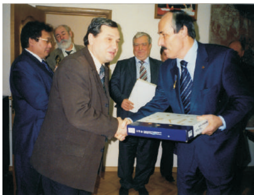
◀ Награждение Золотой медалью Ассамблеи народов России. Награду вручает Р. Г. Абдула- типов – председатель Ассамблеи народов России, ректор МГУКИ (Ярославль, 2008 г.)