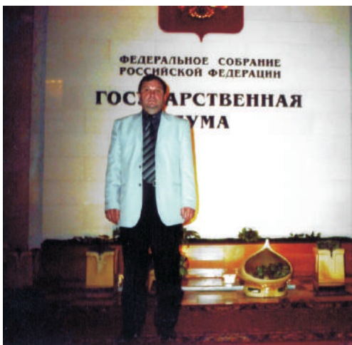
▶ После заседания общественного совета при Совете Федерации и Государственной Думе России (Москва, 2006 г.)