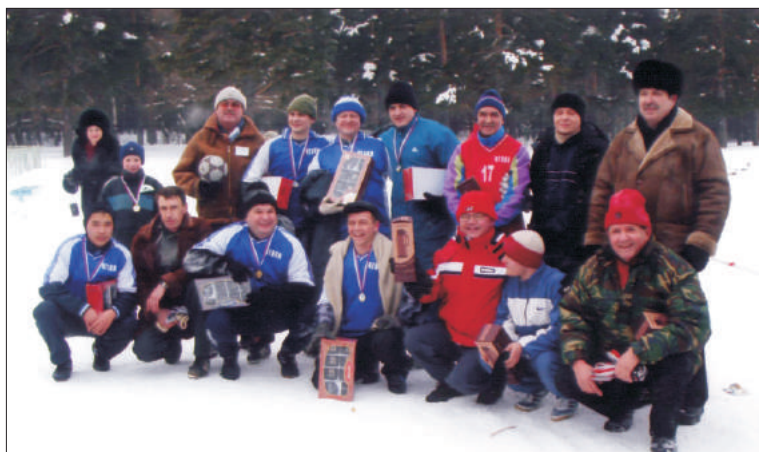
Футбольная команда музыкально-педагогического факультета и сборная академии на спортивном празднике ЧГАКИ