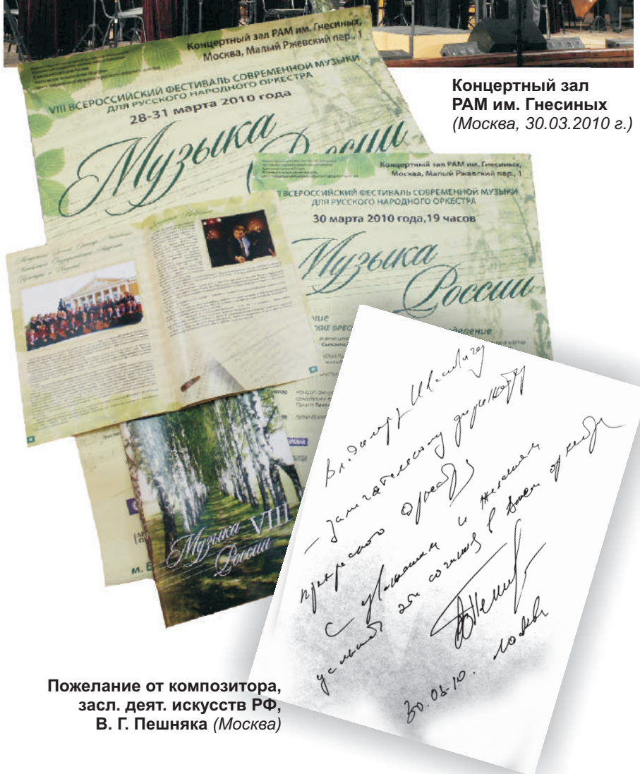
Пожелание от композитора, засл. деят. искусств РФ, В. Г. Пешняка (Москва)