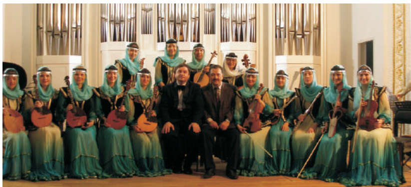
С национальным оркестром народных инструментов Республики Башкортостан (Уфа, зал филармонии, 23.04.10 г.)