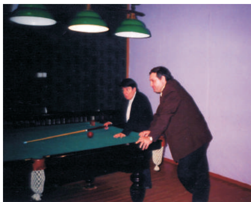
За бильярдным столом с чемпионкой мира по шахматам Нонной Гаприндашвили