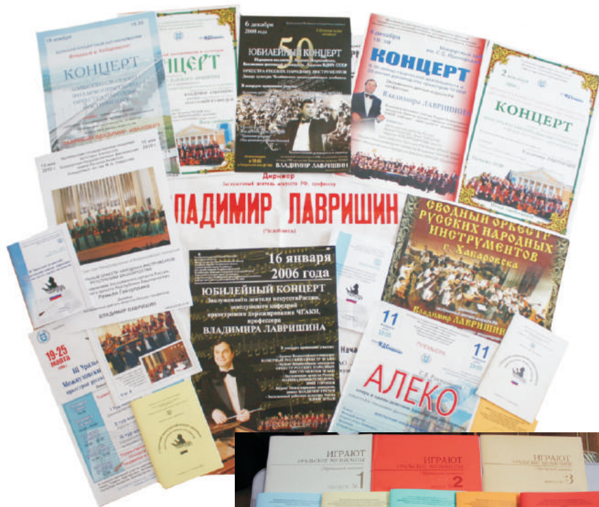
Серии репертуарных сборников и компакт-дисков оркестров под управлением В. И. Лавришина