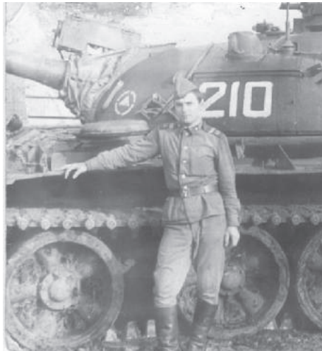
▲ Служба в армии ВЧ 61423 (Свердловск, 1981г.)