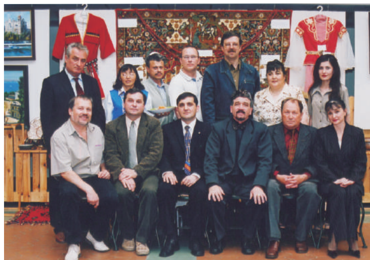
С руководителями национальных культурных центров Челябинской области