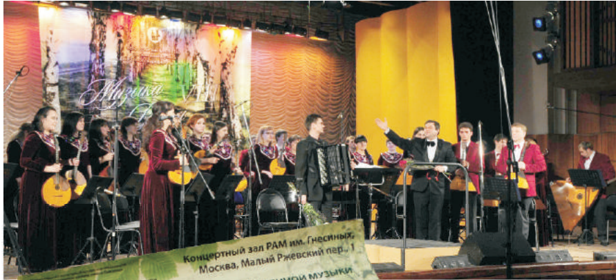
Концертный зал РАМ им. Гнесиных (Москва, 30.03.2010 г.)