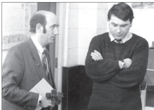
С главным дирижером оркестра, народным артистом России Н. Н. Калинин (1990 г.)