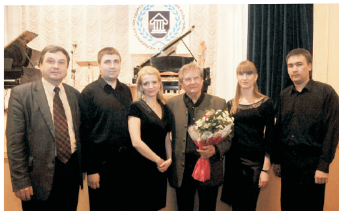
Мастер-класс нар. артиста СССР, гл. дирижера Большого симфонического оркестра им. П. И. Чайковского В. Федосеева (2010 г.)