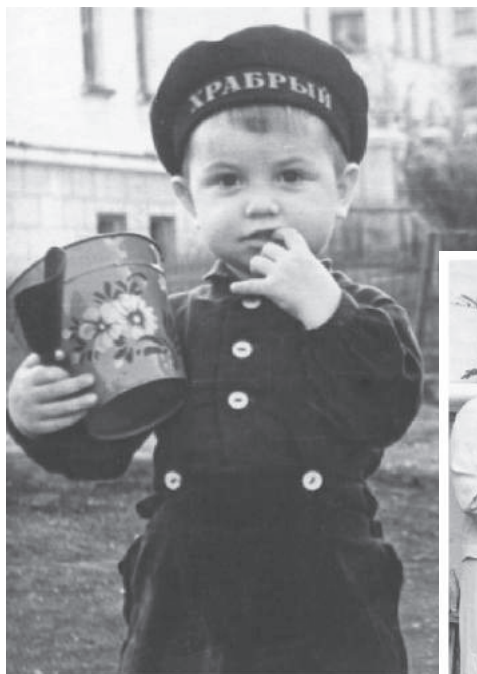
◀ Магнитогорск, 1959 г.