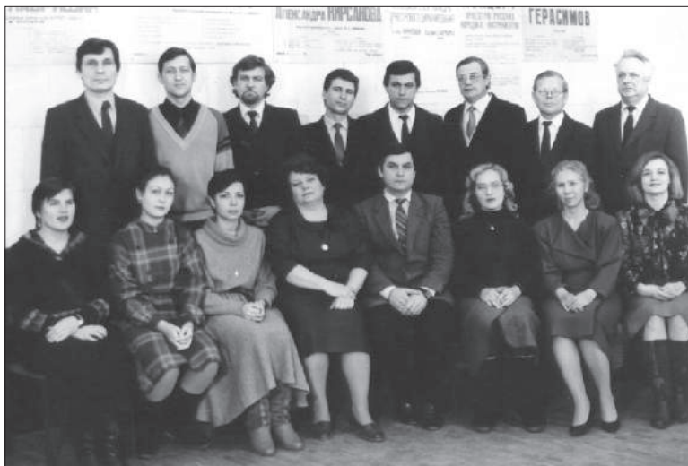
▲ Кафедра оркестрового дирижирования (1988 г.)