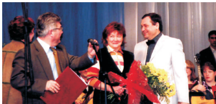
Во время юбилейного концерта в учебном театре ЧГАКИ (16.01.2006 г.)