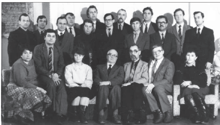
Совещание зав. каф. оркестрового дирижирования СССР. В центре мэтры дирижирования – И. А. Мусин, К. К. Тихонов (Ленинград, 1989 г.)