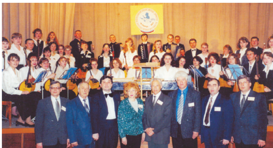
Члены жюри и оркестр ЧГАКИ. Первый в истории России Всероссийский конкурс дирижеров (Челябинск, 2001 г.)