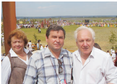
С главой аппарата Президента РФ С. А. Филатовым (Якутск, 2007 г.) ▶