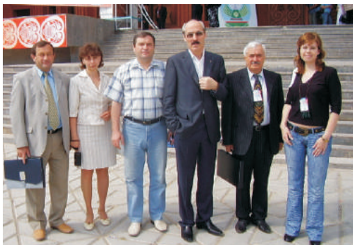
◀ Съезд народов России. С группой руководителей национальных ассамблей регионов России (Якутск, 2007 г.)